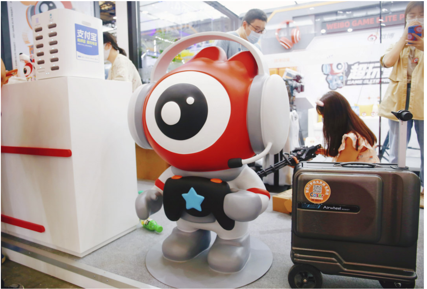
2021年8月1日，上海举行的 ChinaJoy Entertainment Expo，微博的展位。

微博是没有什么海外业务，但是字节跳动的海外业务TikTok并没有在这次入股范围。字节跳动是VIE架构，TikTok等一些海外业务跟国内公司之间并没有直接股权关系，即便有也是跟字节跳动有限公司有关，跟这次入股的实体“北京字节跳动科技有限公司”之间没有股权关联。字节跳动的发言人告诉了《华尔街日报》：这次入股的中国注册公司包含中国市场的短视频和信息平台，拥有一些中国运营业务必要的许可证。