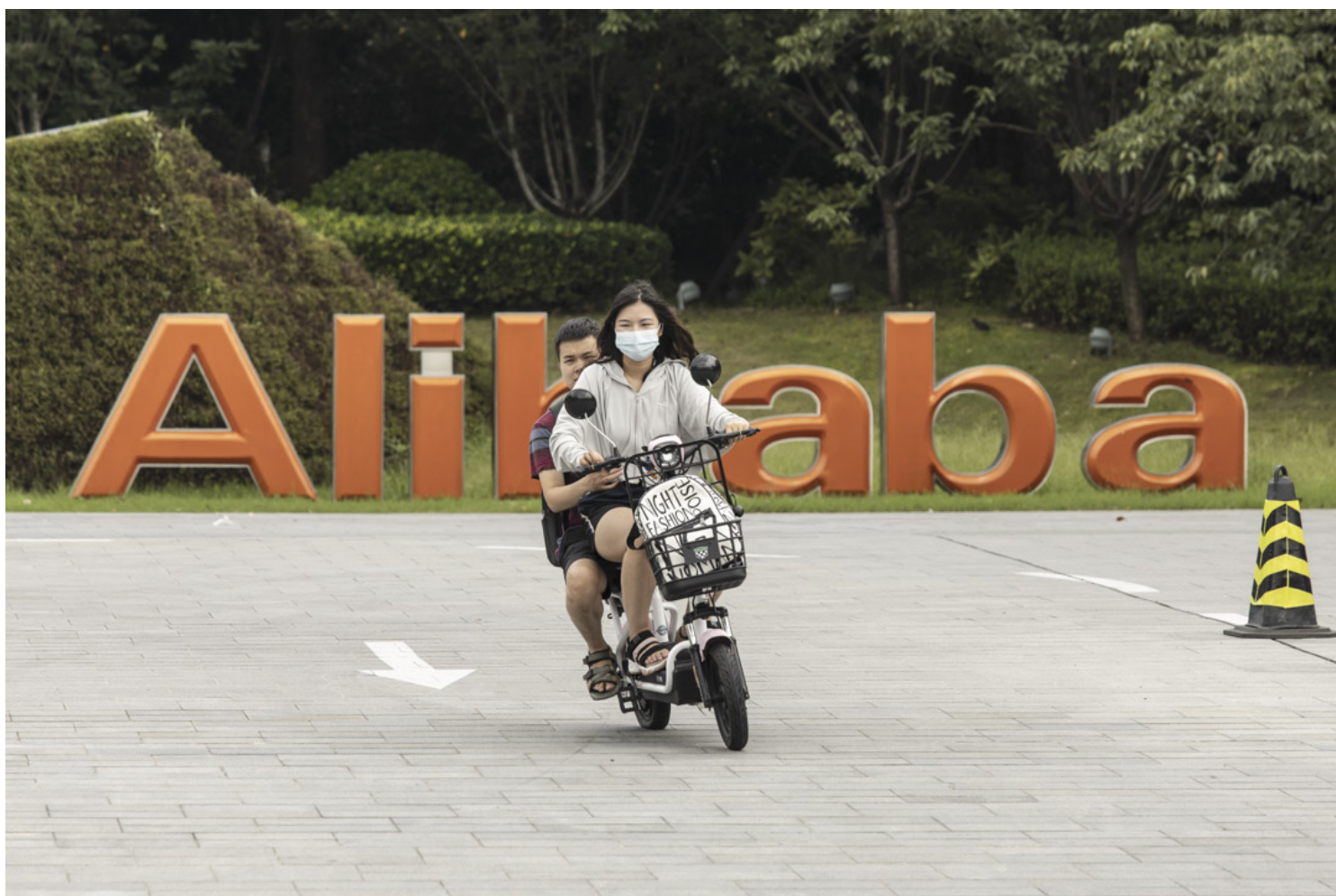
2021年8月2日，杭州的阿里巴巴集团总部，一对夫妇骑着车在前经过。

鲁炜倒台之后，网信办再历两任领导，徐麟和庄荣文都是沉默寡言的技术官僚，互联网管控制度化，法制化，网信办牵头制定的法律、部门规章成为了中国互联网管理的基本规则。《互联网新闻信息服务管理规定》、《网络安全审查办法》等成为管束互联网公司的有效办法，互联网巨头丛林法则和裸奔时代眼看迈向终结。