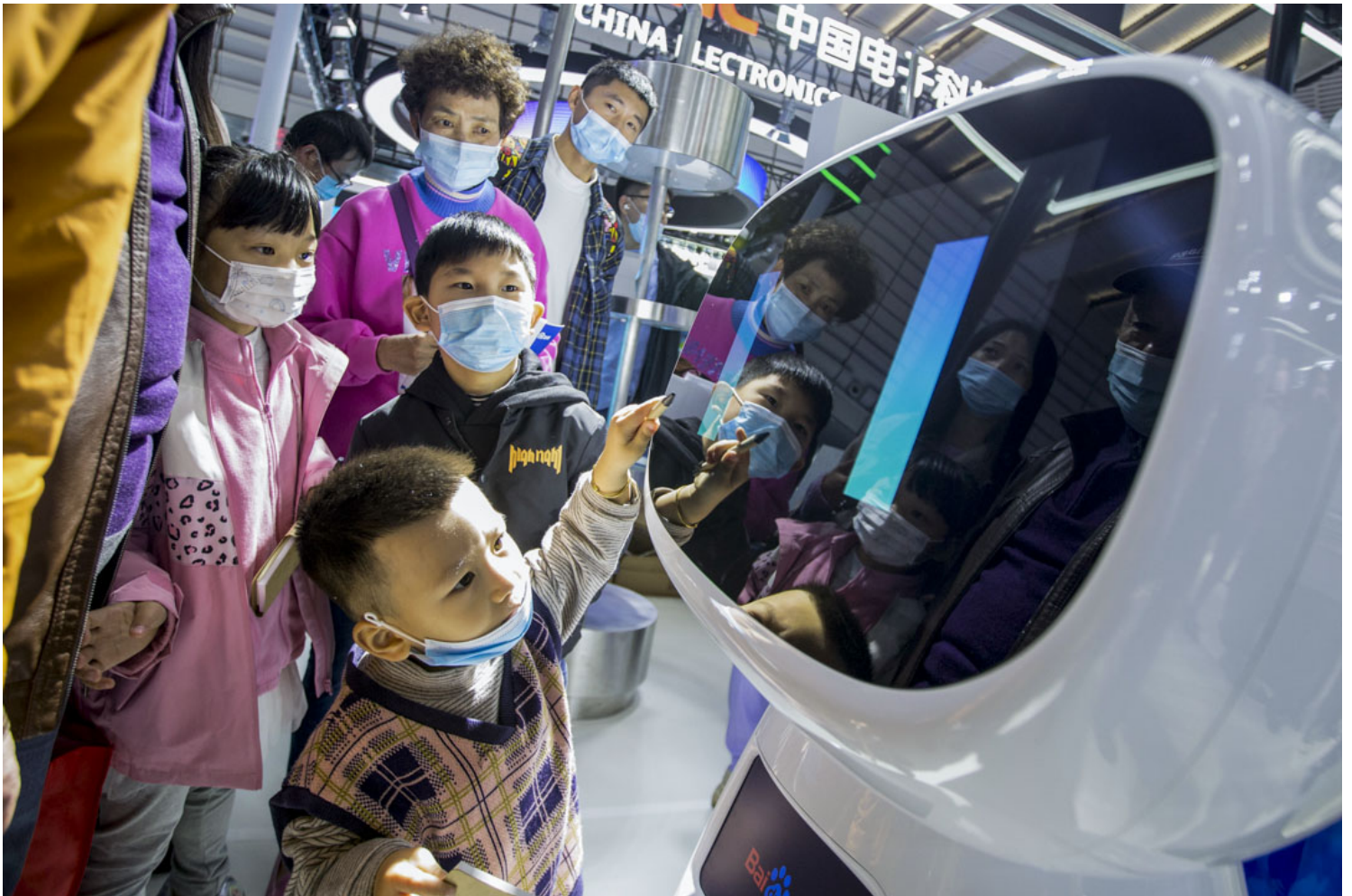
2020年11月22日，浙江省乌镇举行的2020年互联网大会上，一个孩子与百度的机器人互动。

“ 两个舆论场 ”论在2013年前后成为共识，“一个是以党报党刊党台、通讯社为主体的传统媒体舆论场，一个是以互联网为此基础的新媒体舆论场”。官方舆论跟民间舆论脱节，民间舆论拥有强大的动员能力和社会共识塑造能力，也有人认为“互联网成为中国最大的变量”。