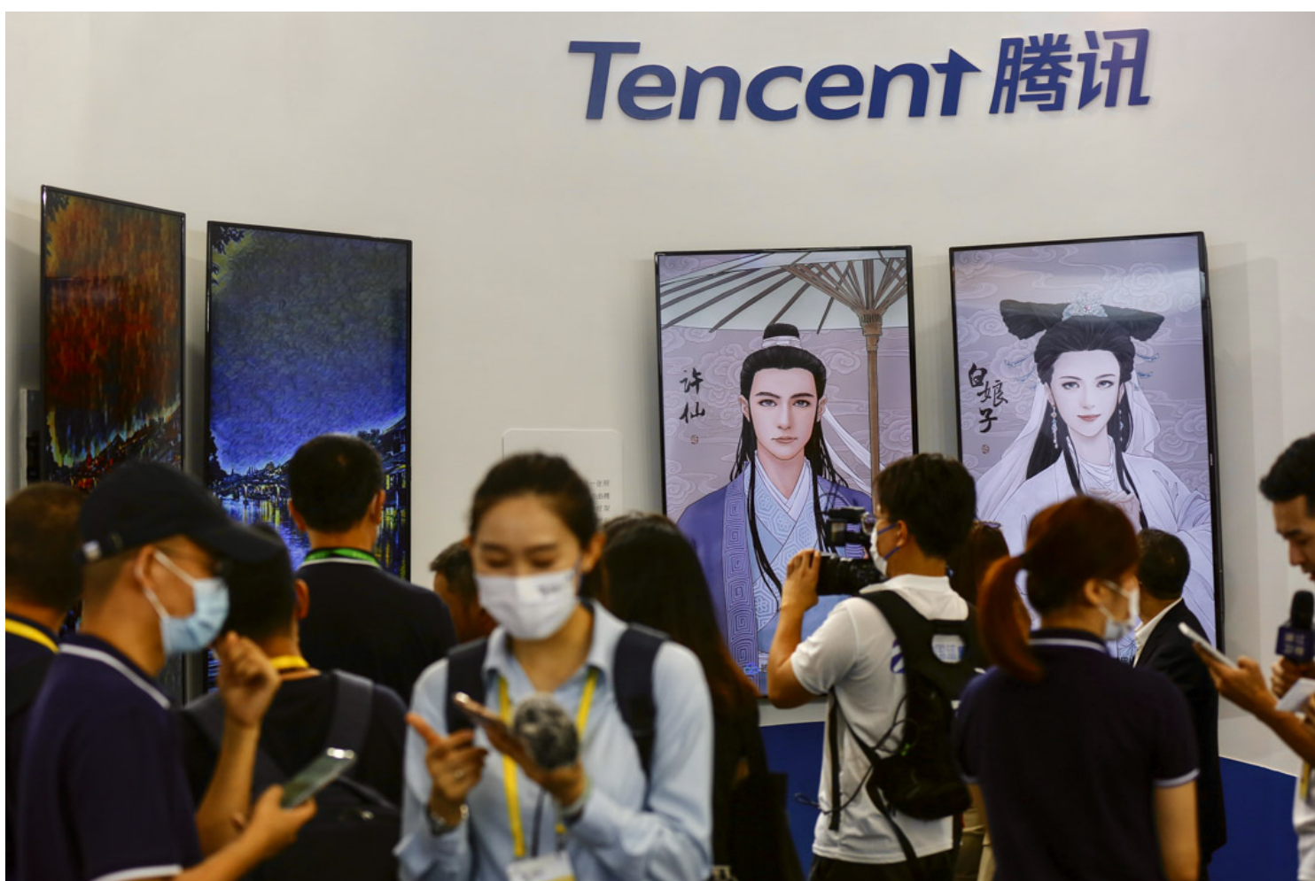
2021年9月26日，乌镇举行的2021年世界互联网大会互联网之光博览会期间，人们参观腾讯AI影楼展台。

从这一系列的时间线可以看出，国家特殊管理股是早有安排，从理论界、学术界到监管层、执行层，不断探讨、酝酿，到最终出台实行，已经有七八年之久。