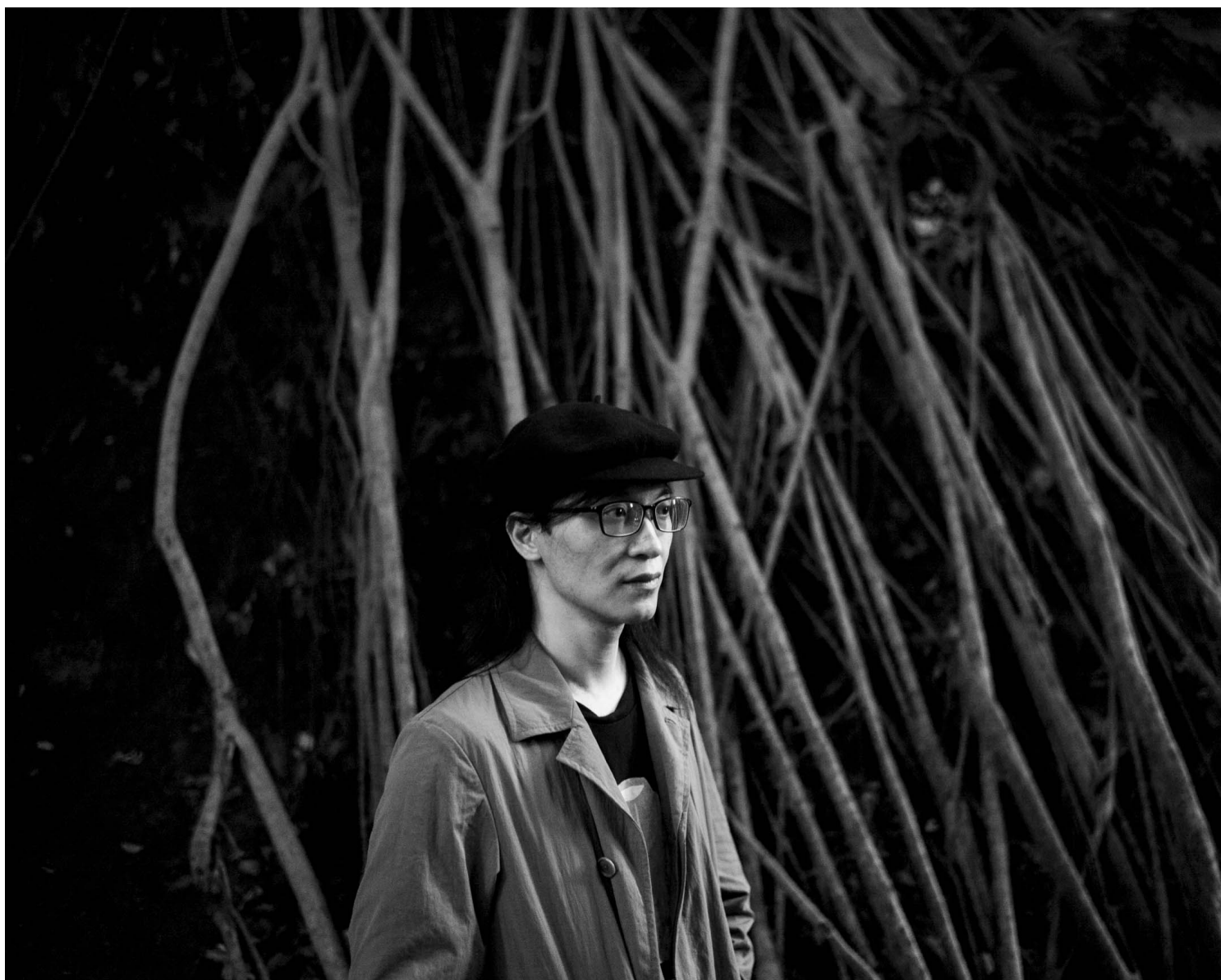
香港作家潘国灵。