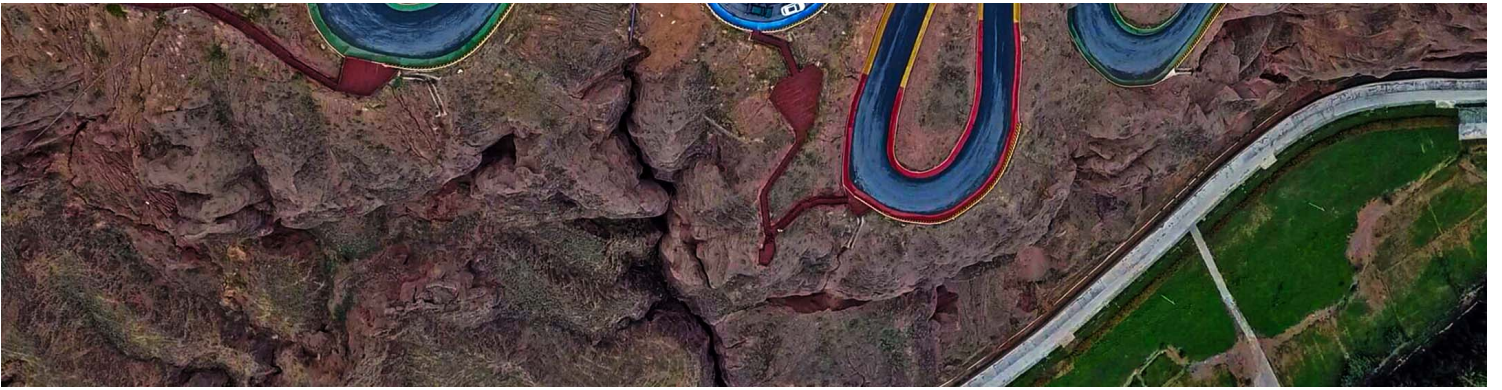
2020年8月14日中国甘肃省白银市，黄河石林国家地质公园山路鸟瞰图。