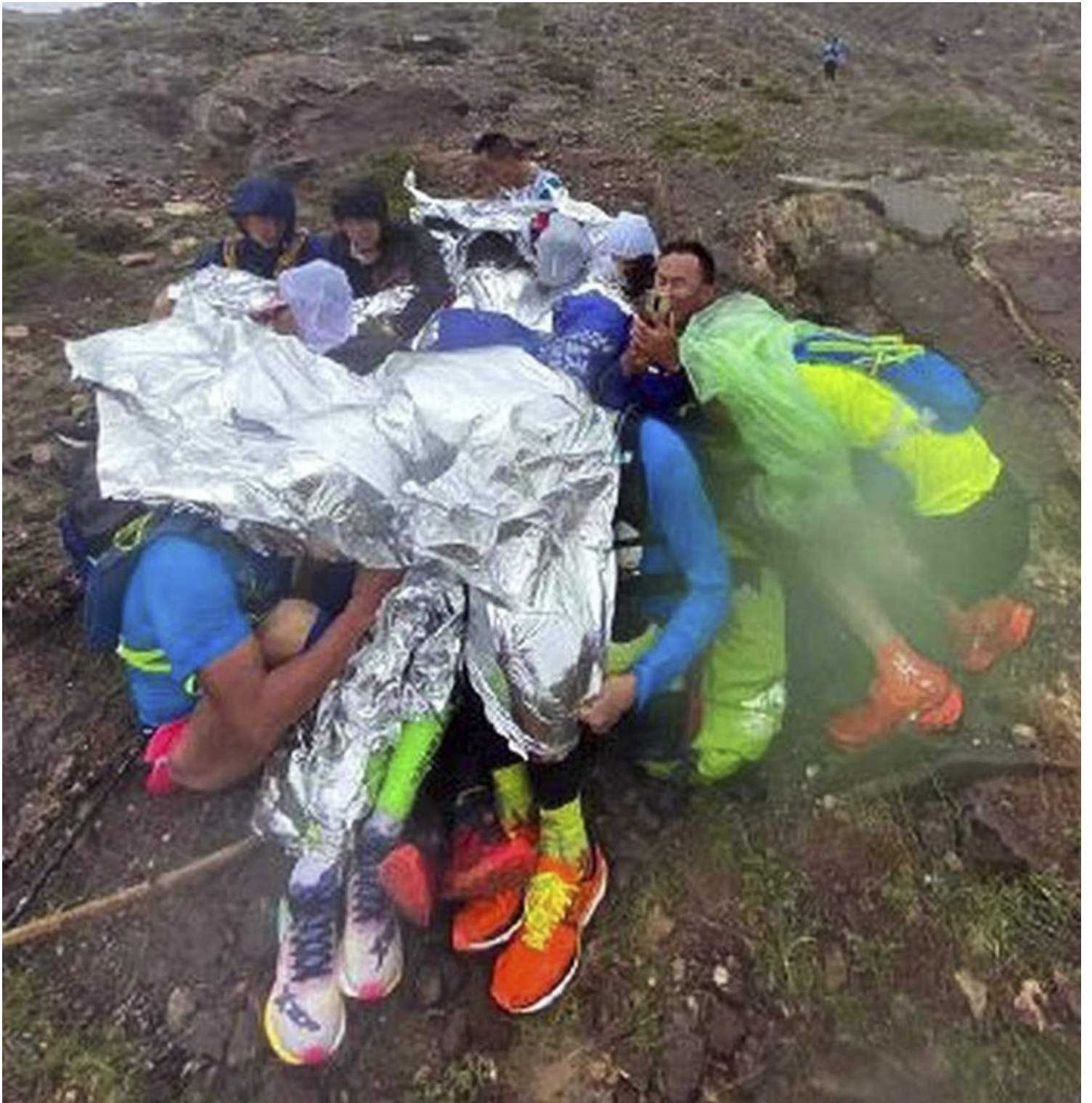
黄河石林百公里越野赛上，172名参赛选手遭遇冰雹、冻雨和大风，多名参赛者抱团取暖。网上图片