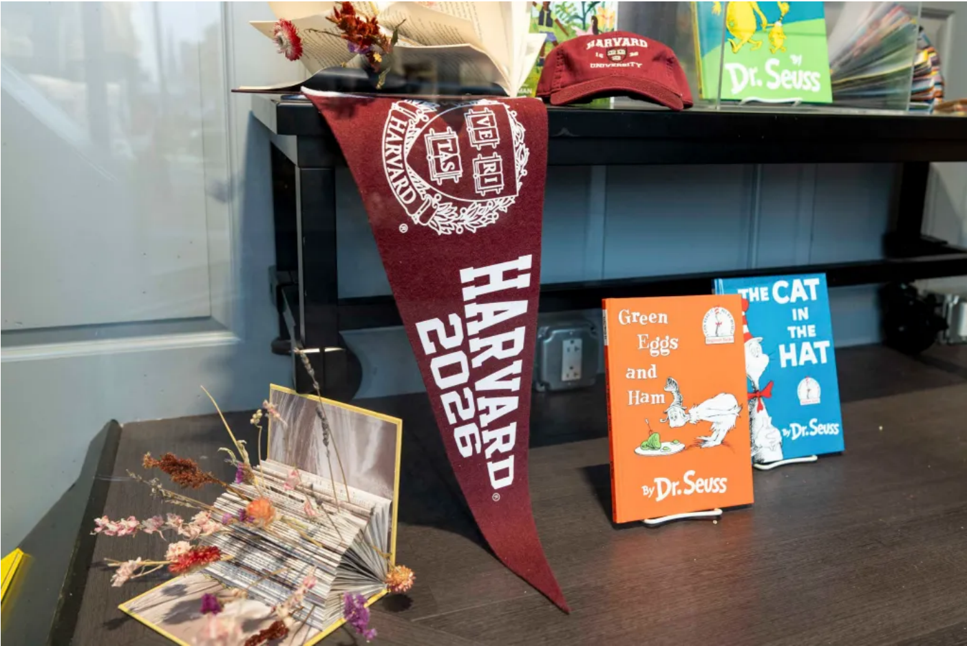
2025 5 5 Mel Musto/Bloomberg via Getty Images

對於哈佛挺身而出對抗特朗普政府，Selina表示：「我覺得一方面社會觀感挺好，另一方面也算是順水推舟吧。因為有哥倫比亞大學的前車之鑑，哈佛知道即便他們服從特朗普所有的要求，政府也不會把經費還給你，那還不如趁這個機會獲取一些正面的社會觀感。」