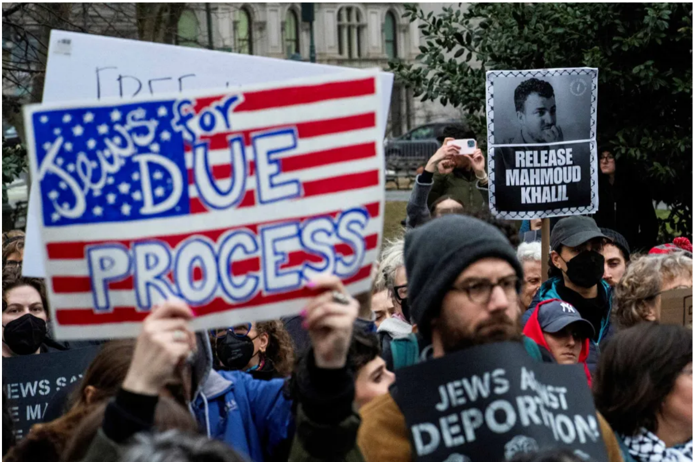
2025 3 20 Mahmoud Khalil ICE