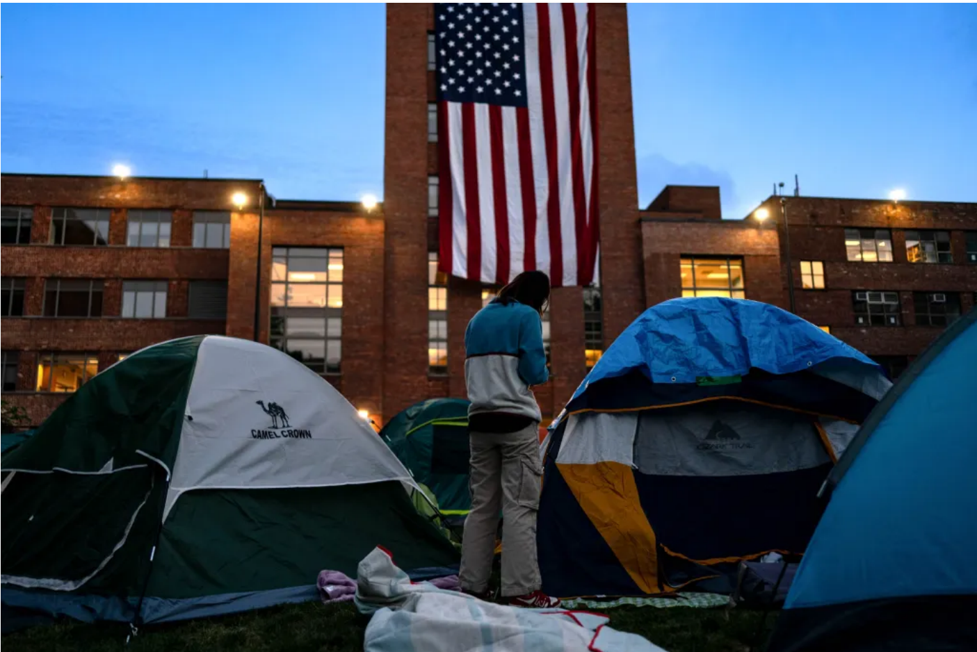
2024 5 3

《行政程序法》（APA）亦規定，聯邦機構在作出可能影響個人權益的決定前，必須提供合理陳述機會。若該決定被認定為「武斷、反常、濫用裁量權，或違反法律」，法院有權將其撤銷。