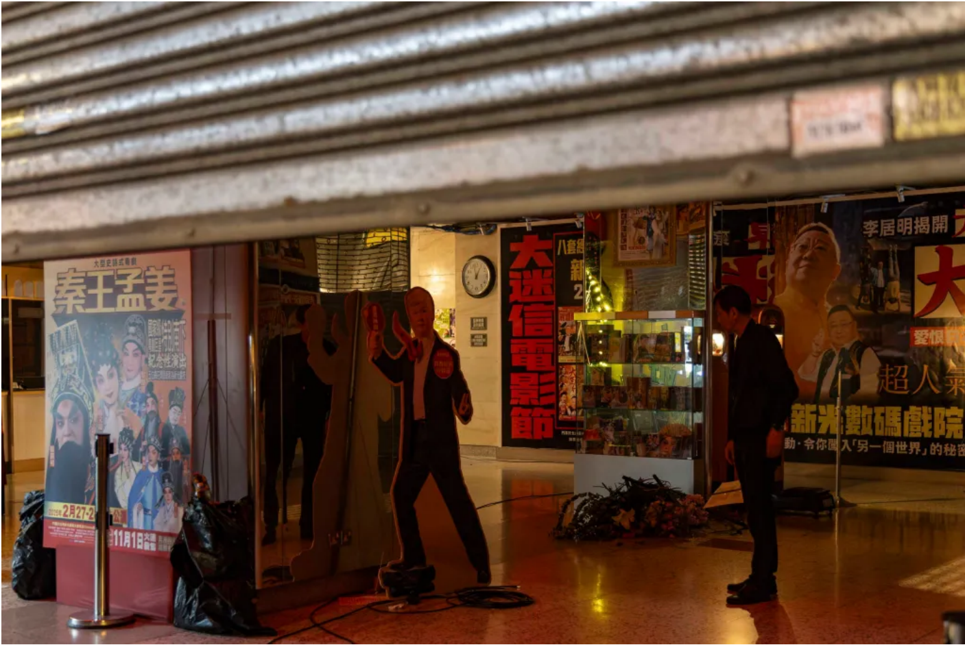
| 2025 3 4 /