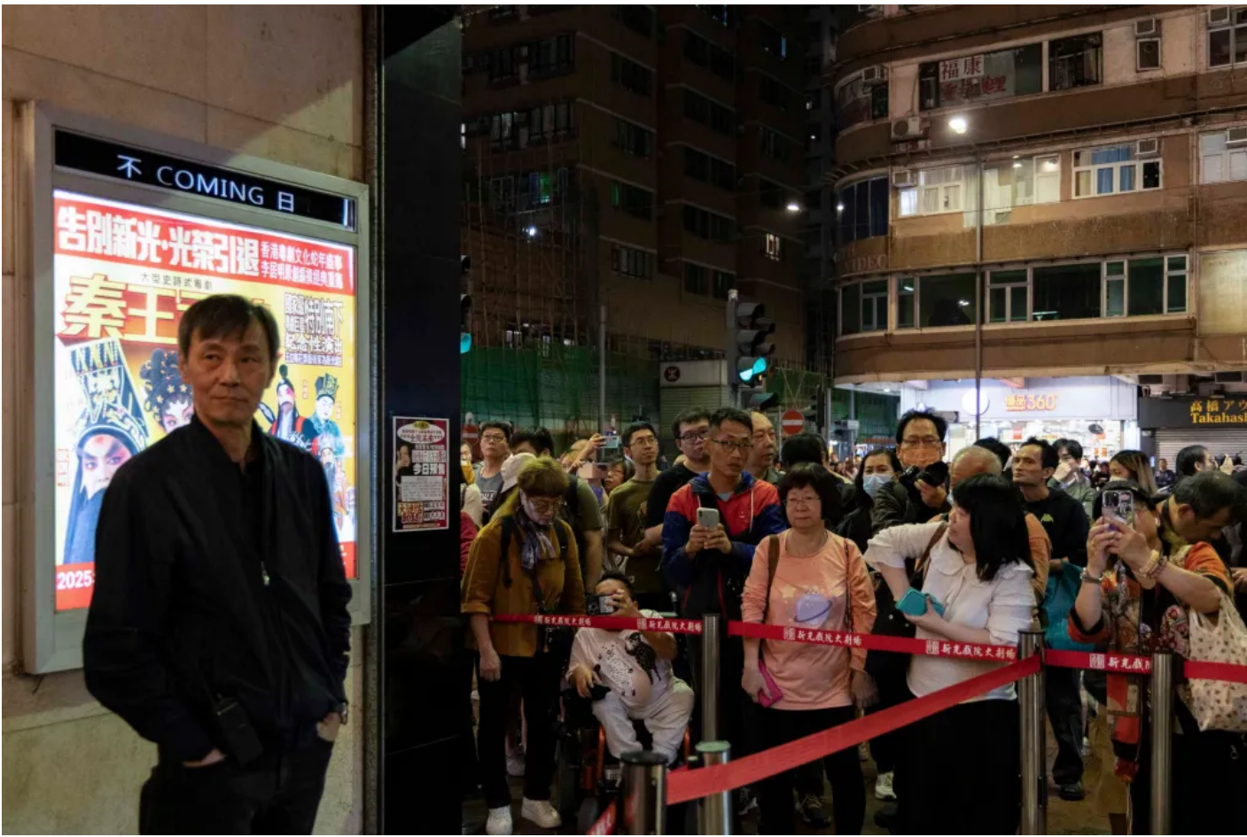
| 2025 3 3 /