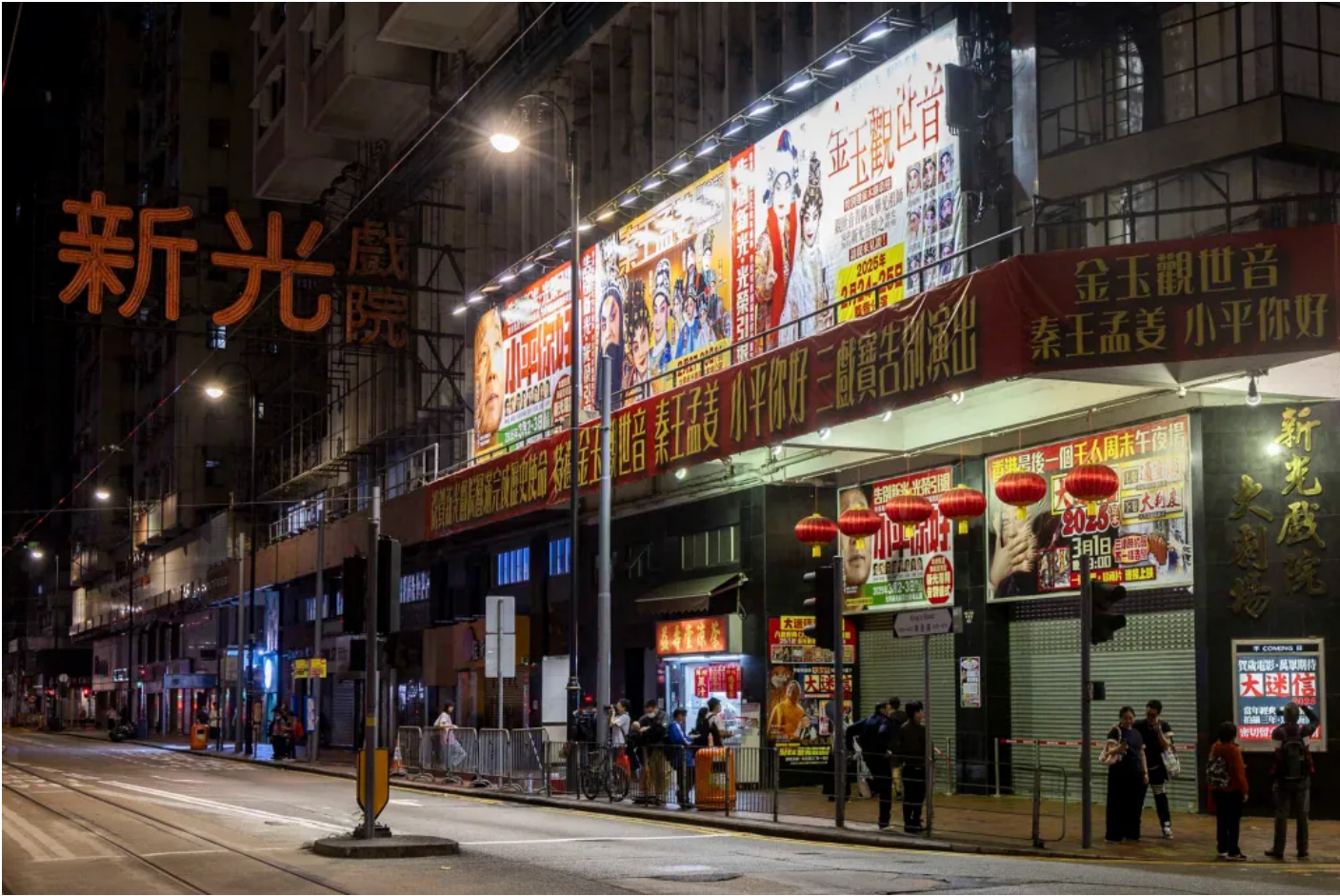
| 2025 3 4 /