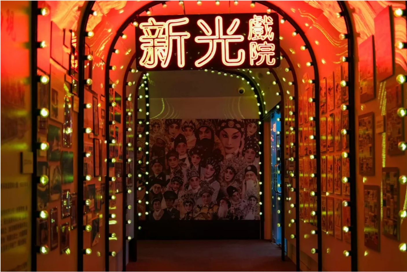
| 2025 3 4 /