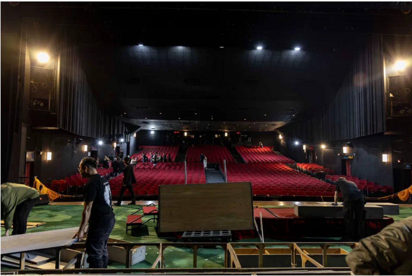
| 2025 3 4 /