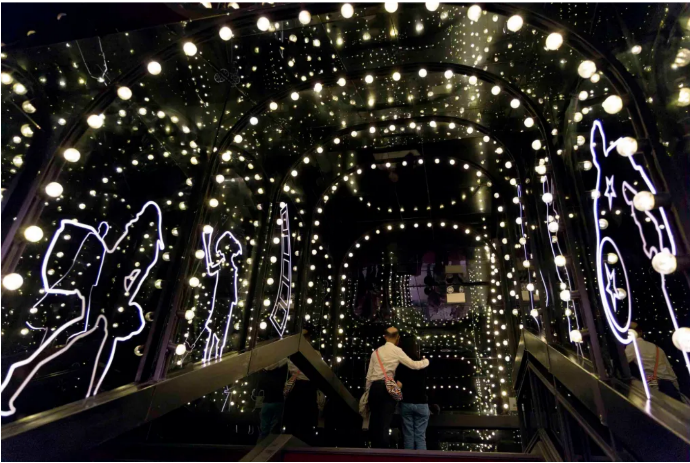
| 2025 3 3 /