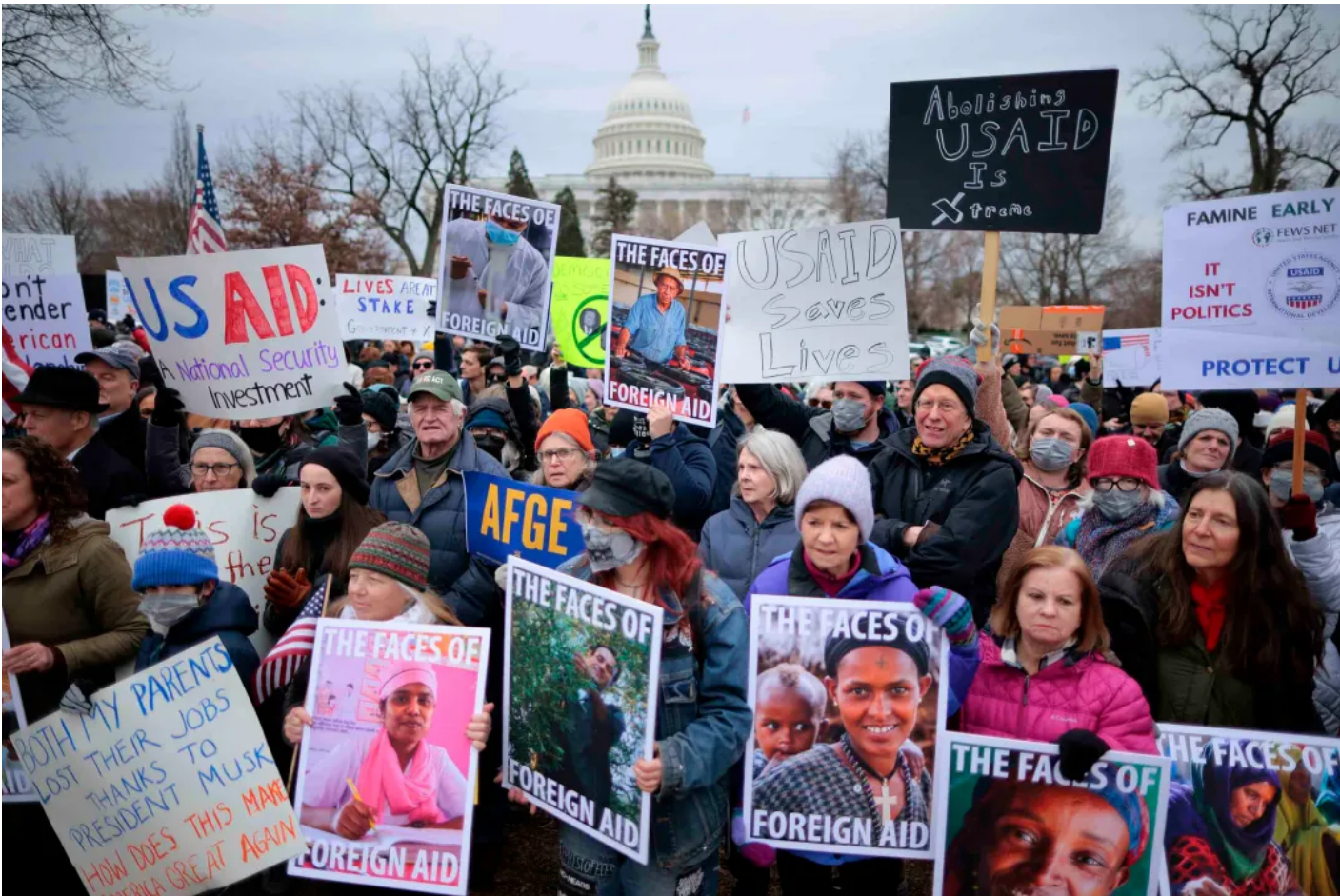
2025 2 5 (USAID)

特朗普的行政令加馬斯克不斷攻擊，導致USAID停擺，這或許意味著美國長達多年的戰略布局發生重大轉向。