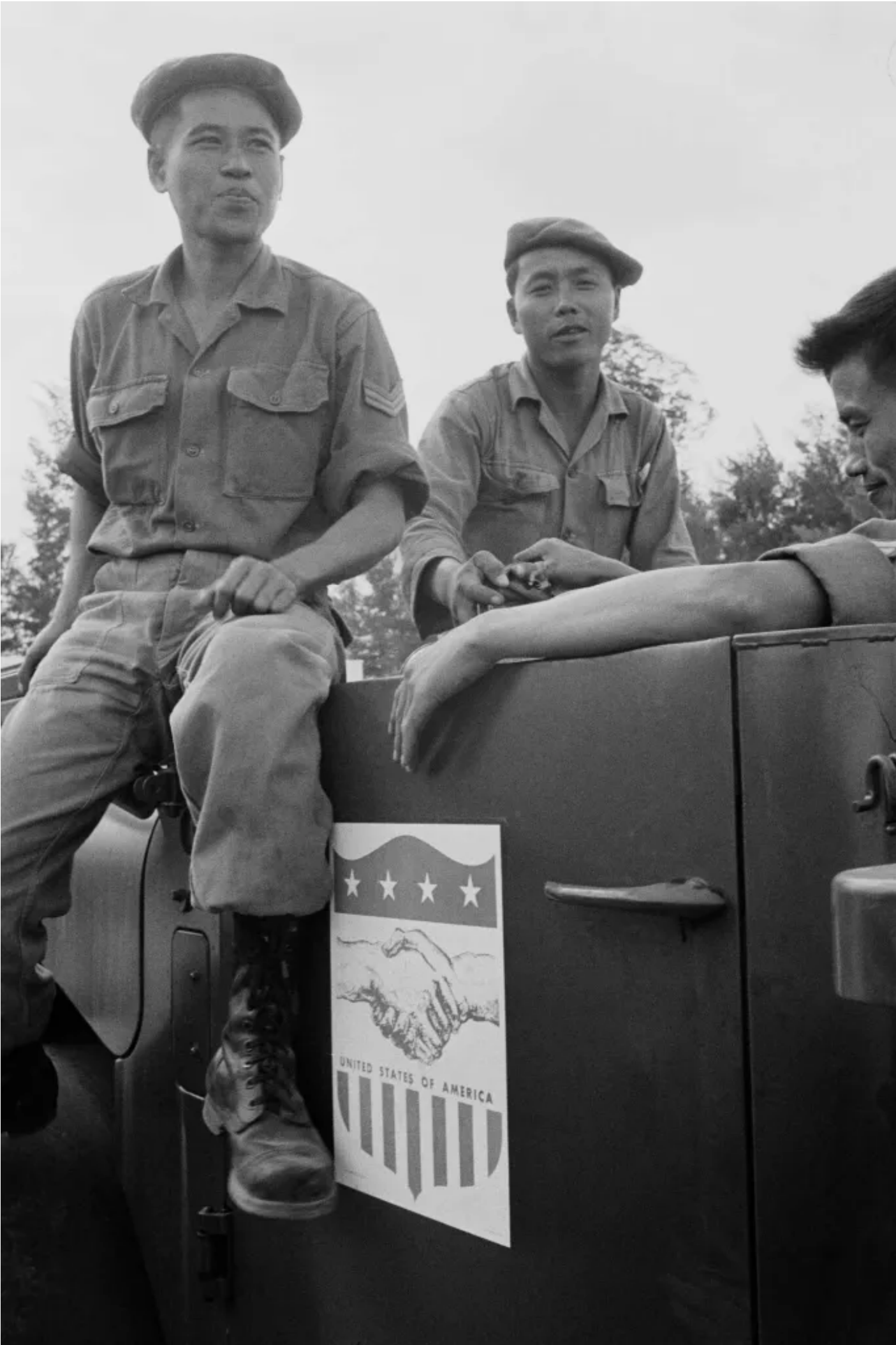
1962 3 USAID

不過，冷戰期間，圍繞著USAID的質疑與批評亦不間斷，包括其多次基於「國家利益」支持拉美地區的專制政權，以及越戰期間和軍方合作推動「平亂」（counterinsurgency）計畫以「打擊越共基礎」但成效不彰等。尼克森（Richard Nixon，尼克遜）時代一度打算藉機廢除該機構，最終在國會介入下轉型，將重心轉向基層發展與人道援助。