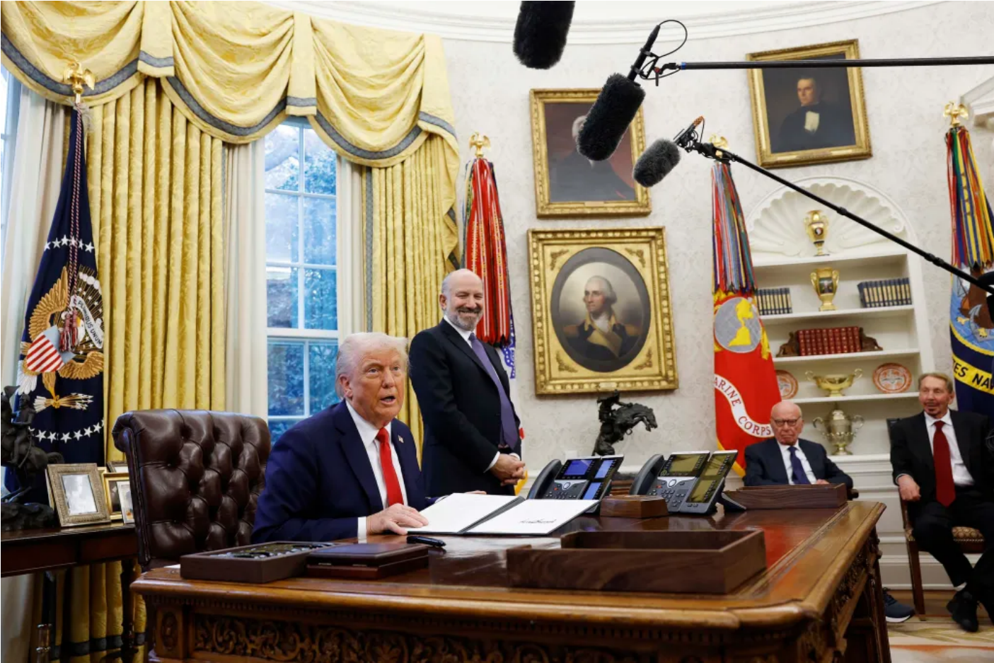
2025 2 3

週一，在墨西哥總統薛恩鮑姆通過電話後，特朗普在社交媒體上寫道：「她（薛恩鮑姆）同意立即在墨西哥和美國的邊境部署1萬名墨西哥士兵，這些士兵將專門負責阻止芬太尼和非法移民流入我們的國家。」在與加拿大總統杜魯多通話後，特朗普寫道：「加拿大將實施13億美元的邊界計劃」，並「任命一位芬太尼沙皇（Fentanyl Czar）」。