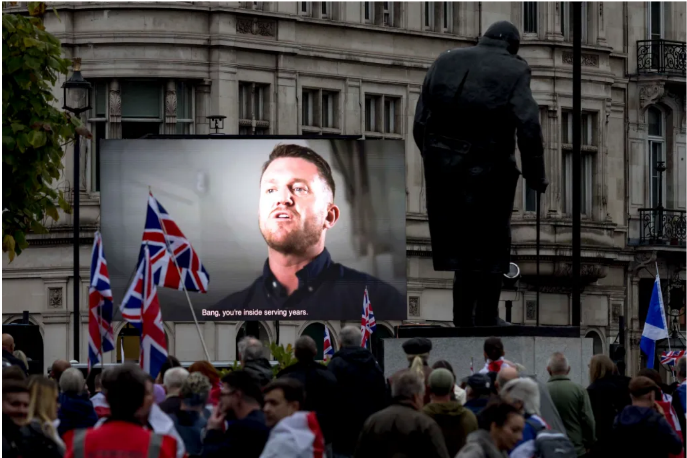
2024 10 26 Tommy Robinson

該案涉及一位敘利亞裔的學童於2018年在校園內被同學毆打，影片在社群媒體上廣為流傳。當時，Tommy Robinson立即在臉書上錯誤宣稱該名被毆打的學童不值得同情，因為他平時會「暴力攻擊年輕的英格蘭女孩」、「把女孩打得青一塊紫一塊」。這樣的言論導致該名學童和家人收到多起死亡威脅，法院發現Tommy Robinson七項繪聲繪影的主張都純屬空想編造，判決其敗訴，並命令其不得再複述相關說法。但他主張自己也擁有「新聞自由」，遂無視法院命令持續傳播相關言論，因而才又被判藐視法庭。