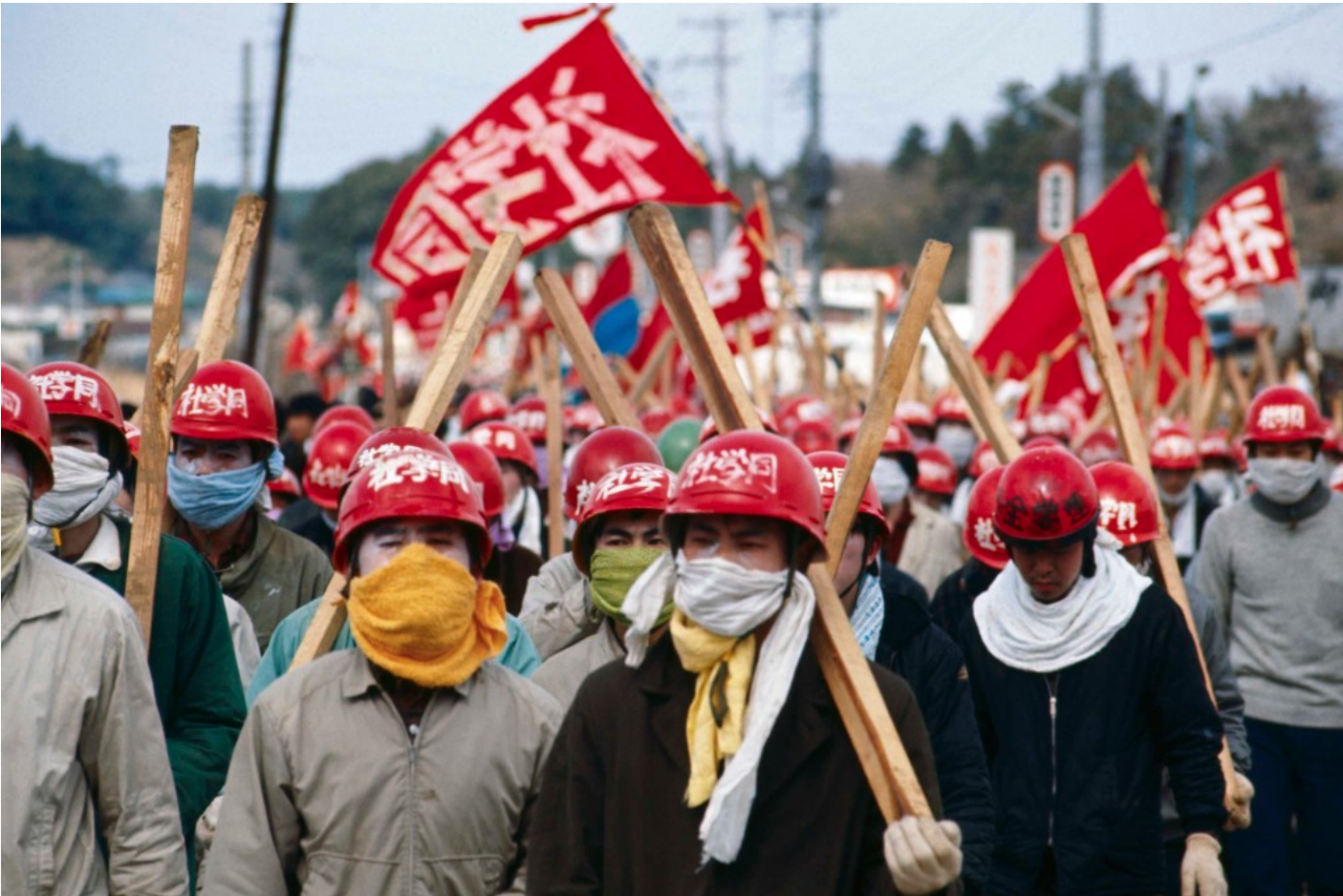
1967 5,000 1,000

「好感動呀！太了不起了。可是我內心一片空虛，什麼都沒有。這樣我就不能參與鬥爭了嗎？」