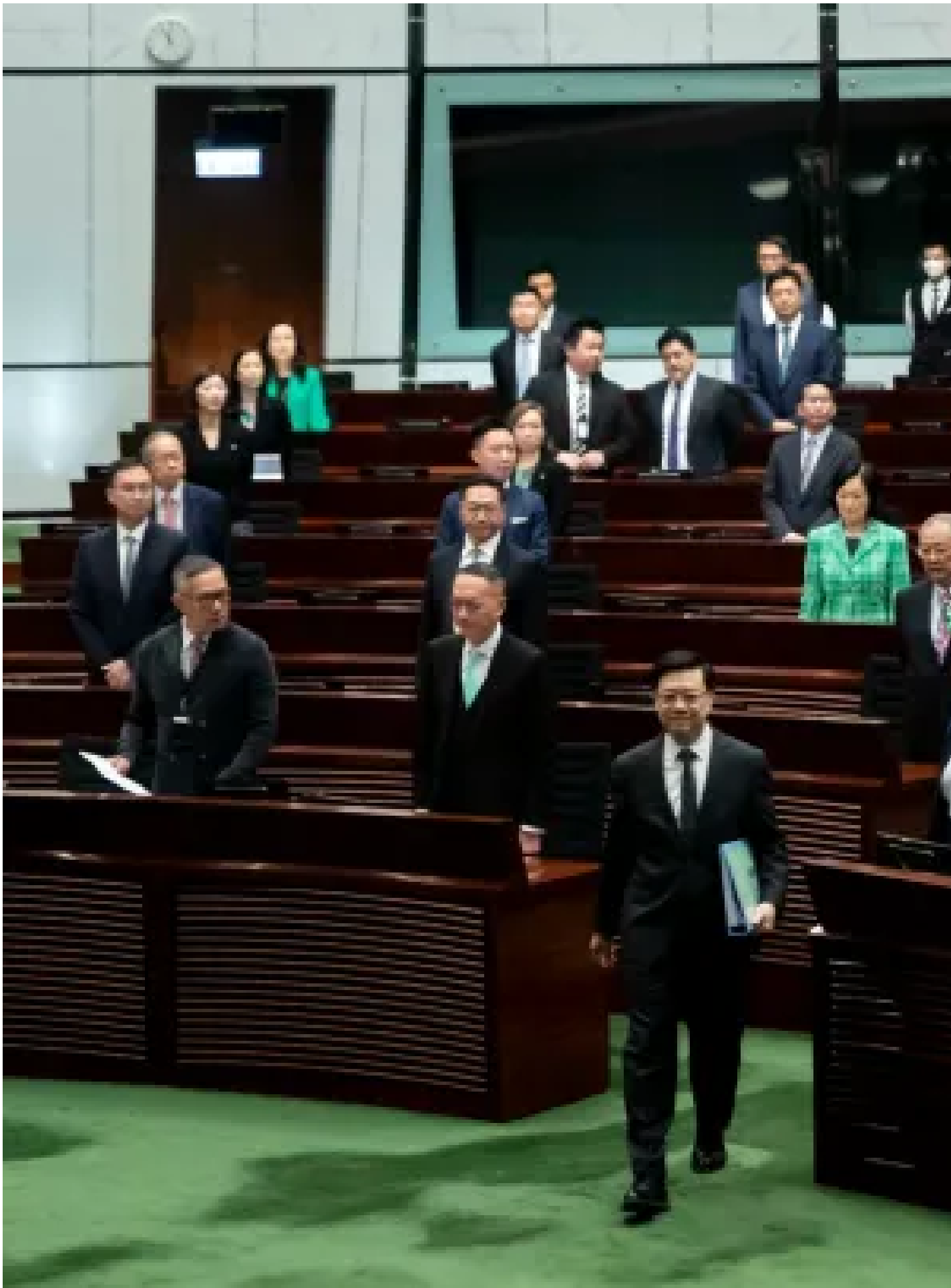
2024年10月16日，特首李家超到立法會發表《行政長官2024年施政報告》。

李家超表示，「世界百年未有的大變局」持續加速演進、複雜的地緣政治、中美關係的不確定性、香港面對外部政治力量的衝擊都帶來挑戰，但香港有安全和穩定的投資環境、位處亞洲心臟、集中國優勢和國際優勢於一身，令香港的機遇大於挑戰。 他還重申，香港有背靠祖國，聯通世界的獨特優勢，國家是香港的最堅強後盾，無論是國家機遇、中央支持和惠港措施都使香港得天獨厚。他認為「必須抓緊機遇，自強不息，憑香港人的智慧和經驗，善拼敢贏的精神，必能遇強愈強，再創高峰」。 本刊載內容版權為端傳媒或相關單位所有，未經 端傳媒編輯部 授權，請勿轉載或複製，否則即為侵權。