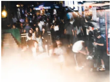
「戰場」的暴烈與哀愁：酒吧Boy的黑夜時光

另外，施政報告提出大幅 調低烈酒稅 ——即日起，進口價200港元以上的烈酒（酒精濃度高於30%），200元以上部分的稅率由100%減至10%，200元以下部分的稅率則維持不變，而進口價在200元以下烈酒的稅率也維持不變。報告提到，參考過往取消紅酒稅帶動相關貿易的經驗，認為減稅可以促進烈酒貿易，帶動物流和儲庫、旅遊和高端餐飲消費等，因此決定實施減烈酒稅措施。