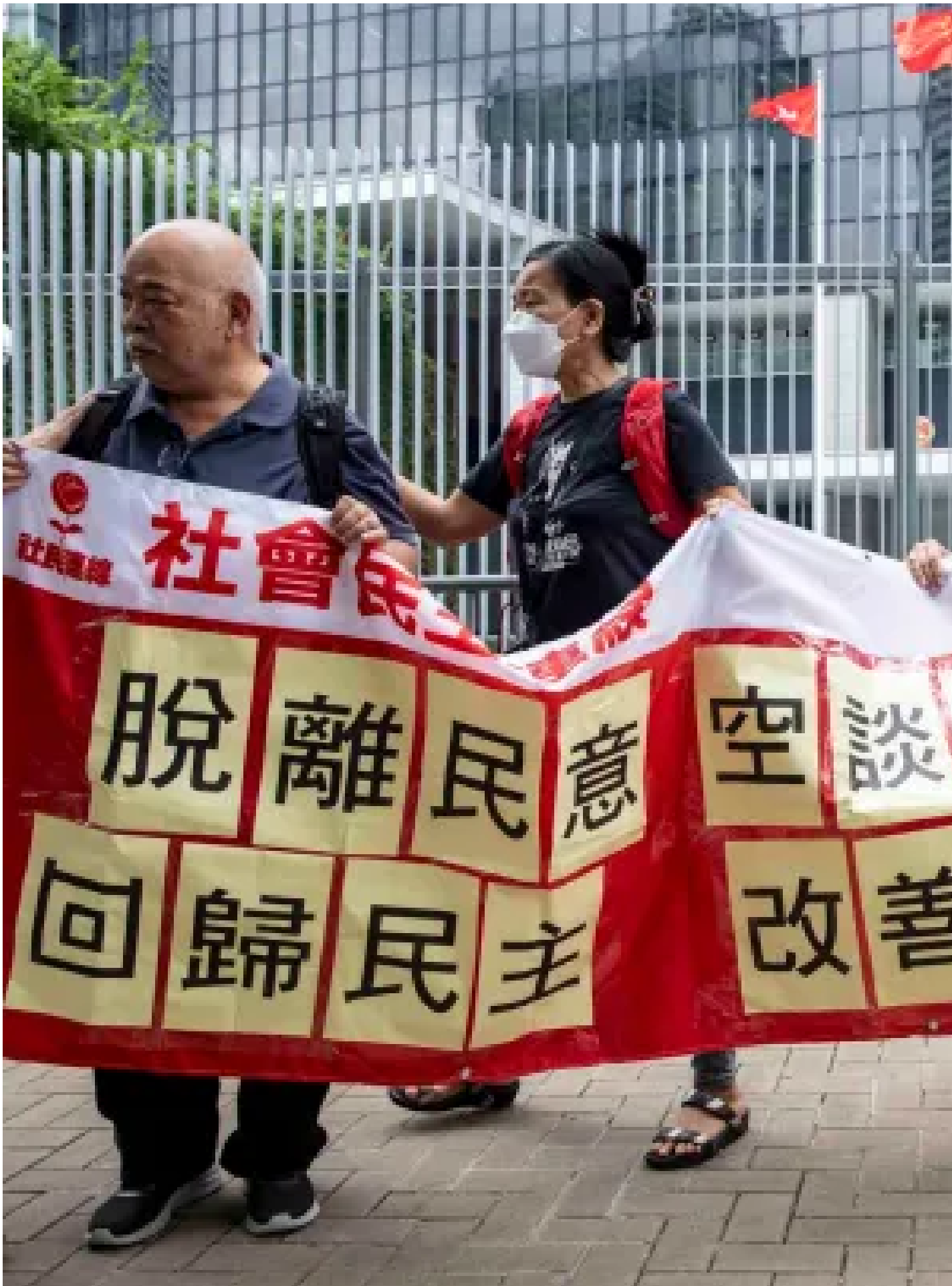
2024年10月16日，社民連到政府總部公民廣場門外請願，要求立即實行普選。