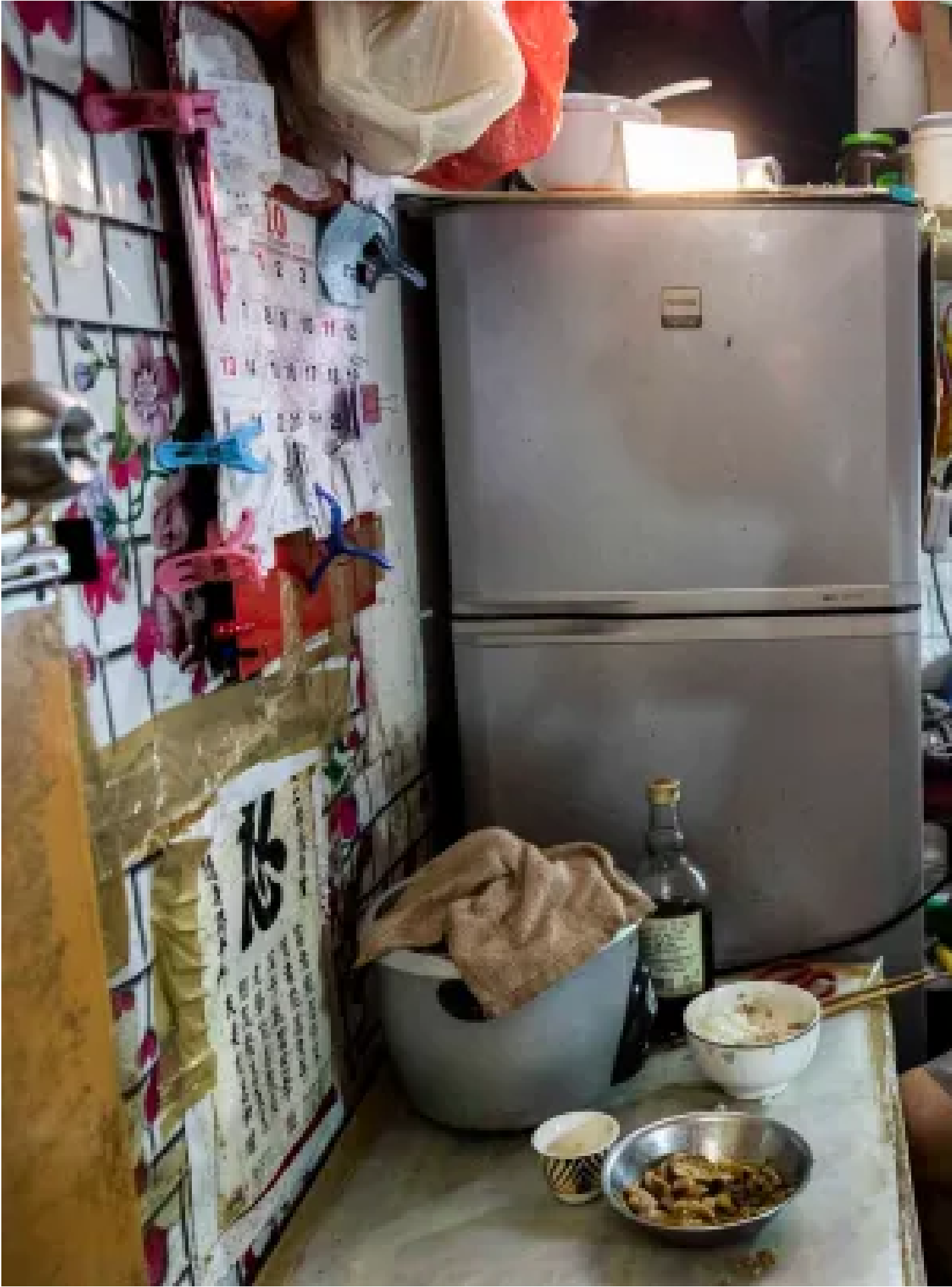
2024年10月16日，黃伯伯居住在一個無窗的50呎劏房，月租3200元。

施政報告提出就劏房改建簡樸房設立登記制度，業主必須在法例寬限期內將不合標準的劏房改建成合標準的簡樸房；在寬限期過後，假如業主繼續出租不合標準的劏房單位就要負上刑事責任，但住客不必負上法律責任。至於新進入市場的分間單位，必須符合簡樸房的認證標準才可出租。報告指出，在相關措施之下，不合標準的劏房單位會有序被取締，直至清零。