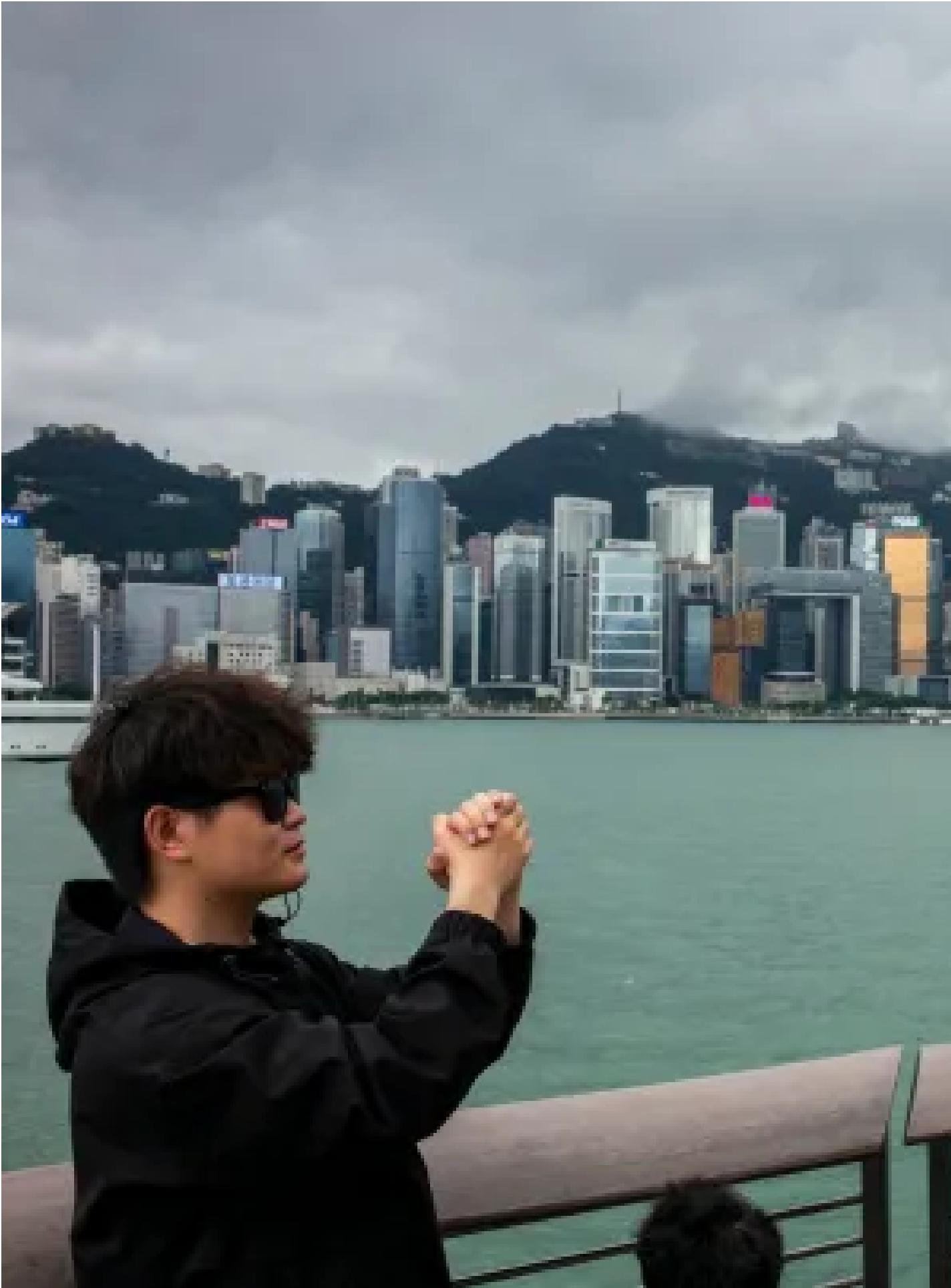
2024年5月4日，內地遊客在尖沙咀拍照。