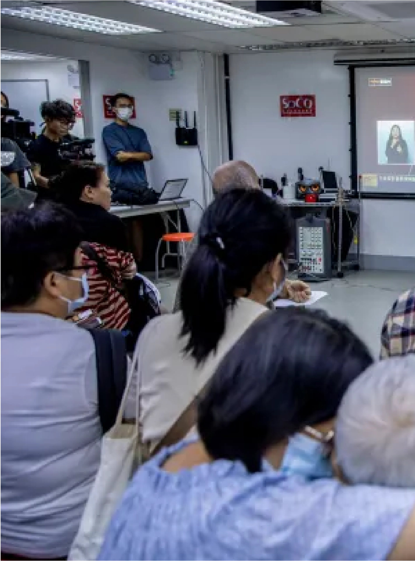
2024年10月16日，香港社區組織協會集合基層觀看行政長官宣讀施政報告。

就支援中小企業，施政報告提出再推「還息不還本」，即容許「中小企融資擔保計劃」的借款企業申請最多12個月「還息不還本」，並且將八成和九成信貸擔保產品的最長貸款擔保期分別延長至十年和八年，同時向兩種擔保產品下新造貸款提供「部分本金還款」選項。