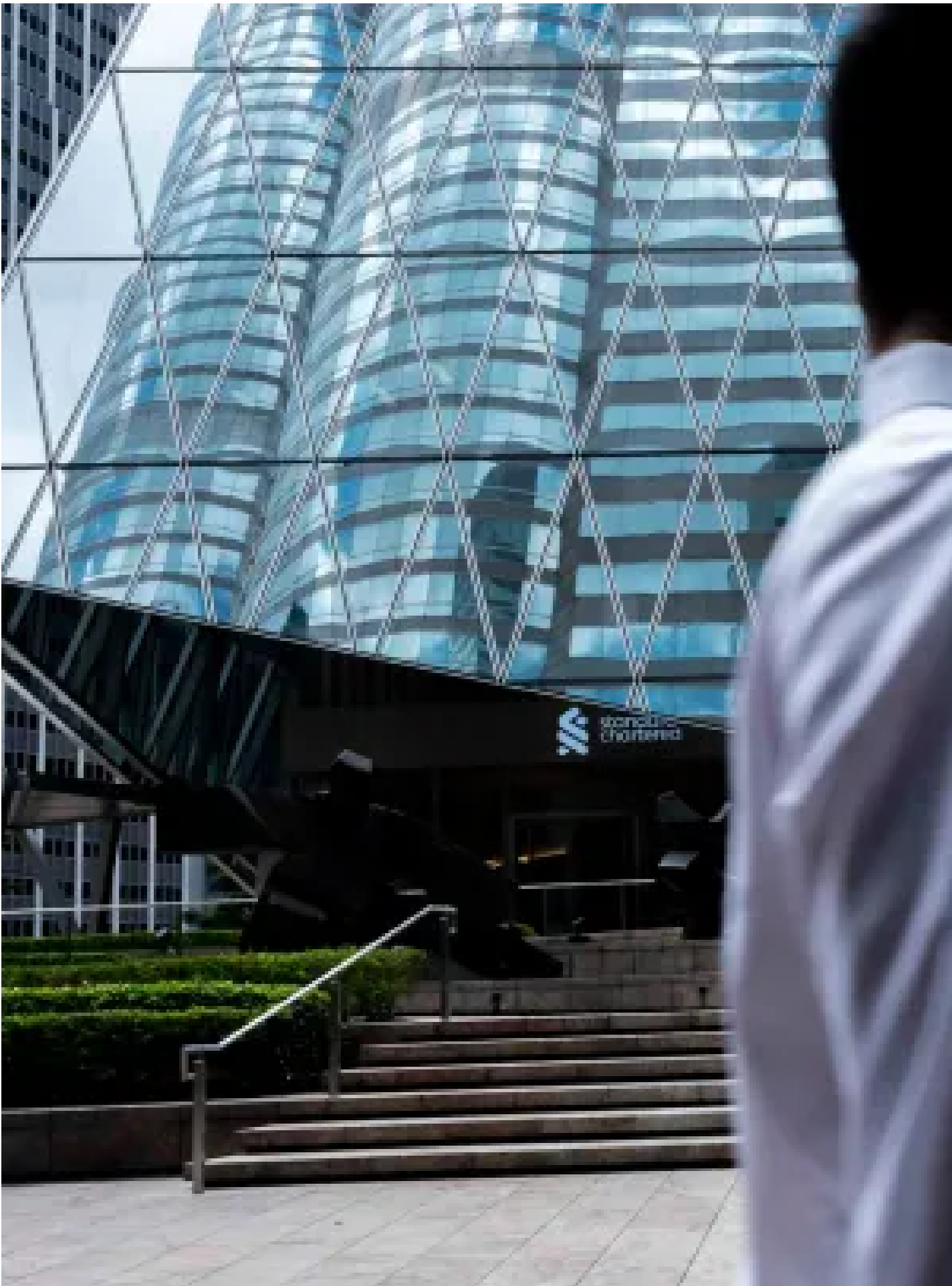
2024年8月1日，中環上班人士在商業區行走。