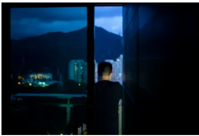
一屋割八房，香港豪宅裏的劏房人生