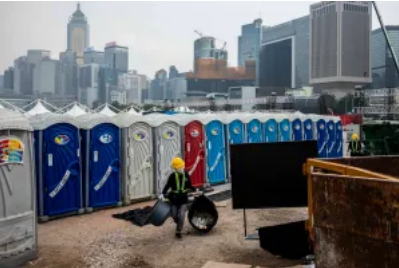
香港市民，感受到經濟「由治及興」了嗎？」端聞 Podcast

就鞏固和提升香港的國際金融中心地位，施政報告提出 深化「互聯互通」機制 ，強化香港的全球最大離岸人民幣業務樞紐地位，幫助人民幣國際化，增加離岸人民幣的流動性。其中，施政報告建議提供更多以人民幣計價的投資產品，包括由港交所鼓勵更多上市公司增設人民幣股票交易櫃台、擴大人民幣債券發行、爭取國家財政部增加在港發行國債的規模和頻率等。