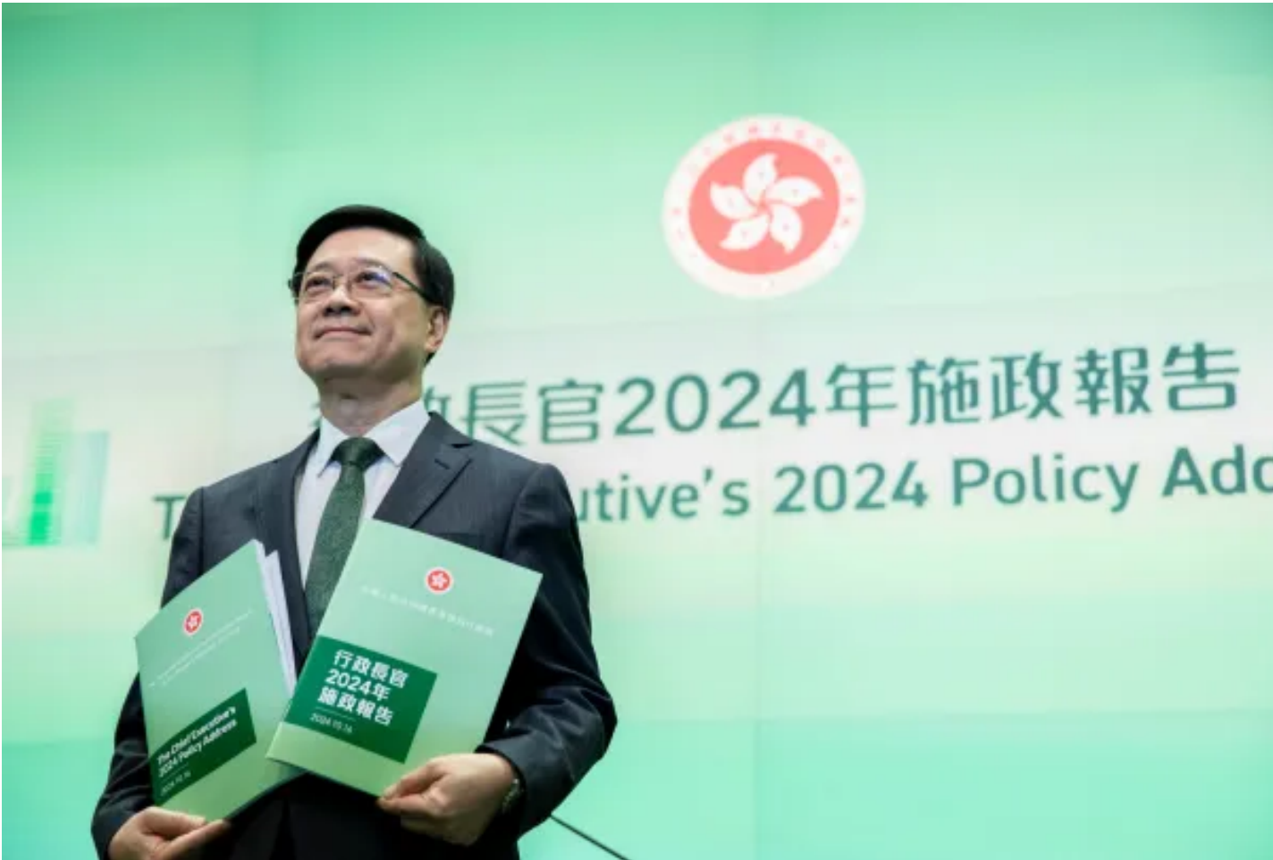
2024年10月16日，《行政長官2024年施政報告》記者會，特首李家超手持報告拍照。

離開真相，談何看見彼此和追求正義？我們的日報、速遞Whatsnew、端聞Podcast能夠保持免費，離不開每一位會員的支持。 暢讀會員首月5折 ， 尊享會員全年85折 ，幫助我們做出更好的即時報導和深度內容。