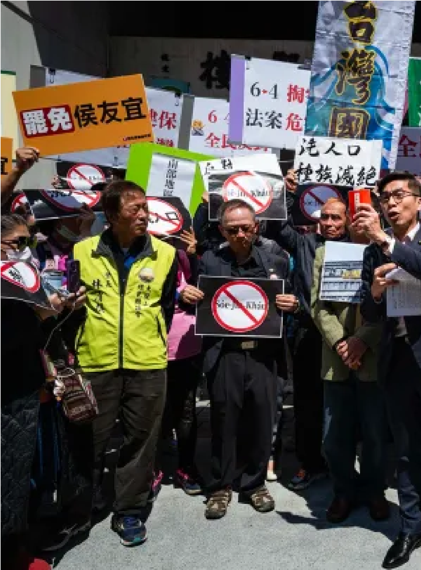
2024年3月12日，台派社團在立法院群賢樓前發起「反對洗人口修法——中國配偶入籍條件應比照其他國家人士辦理」記者會。

端傳媒嘗試採訪提案人許宇甄，以及參與提案連署的國民黨與無黨籍立委的說法，但皆未獲得回應。