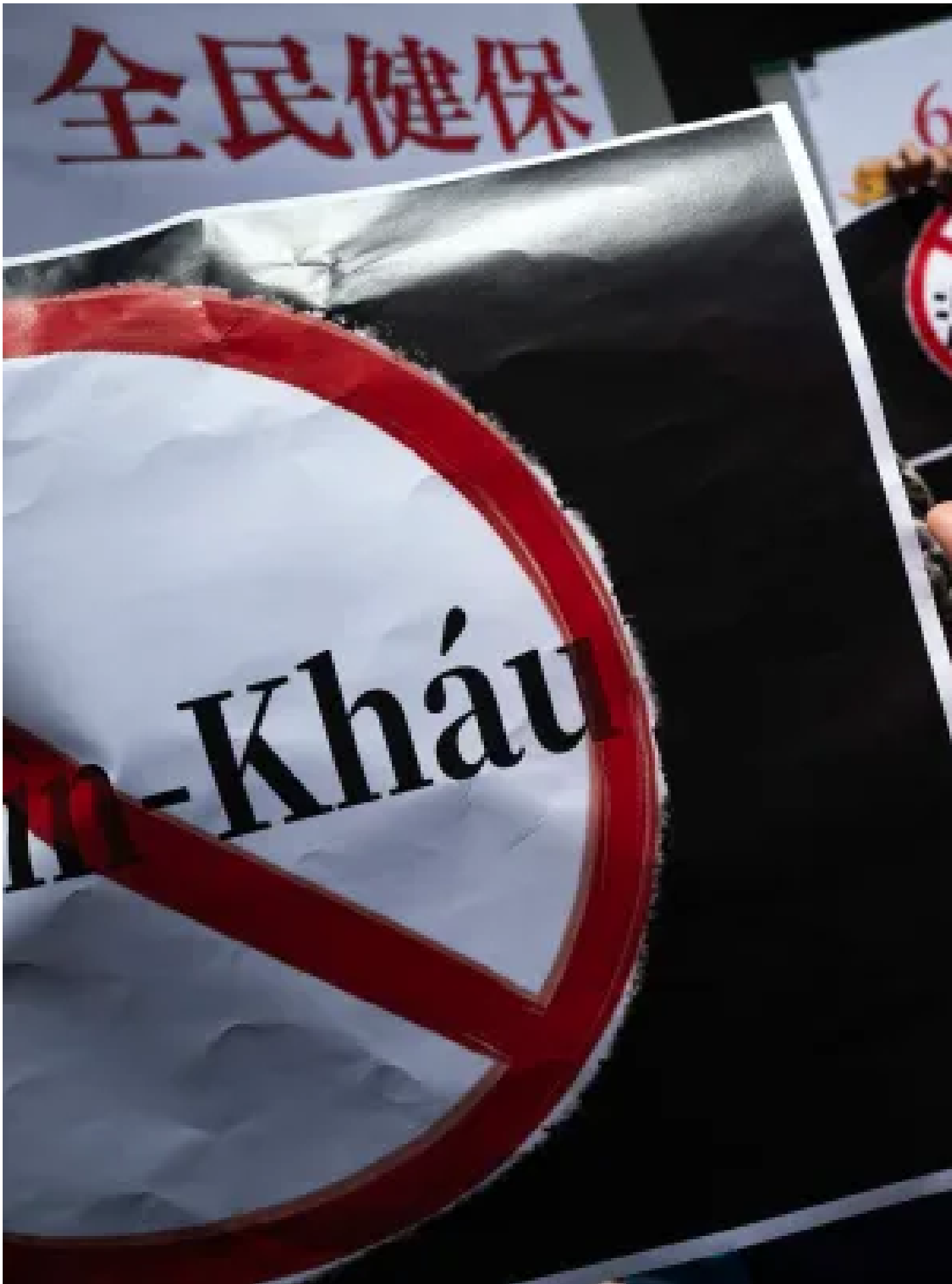
2024年3月12日，台派社團在立法院群賢樓前發起「反對洗人口修法——中國配偶入籍條件應比照其他國家人士辦理」記者會。