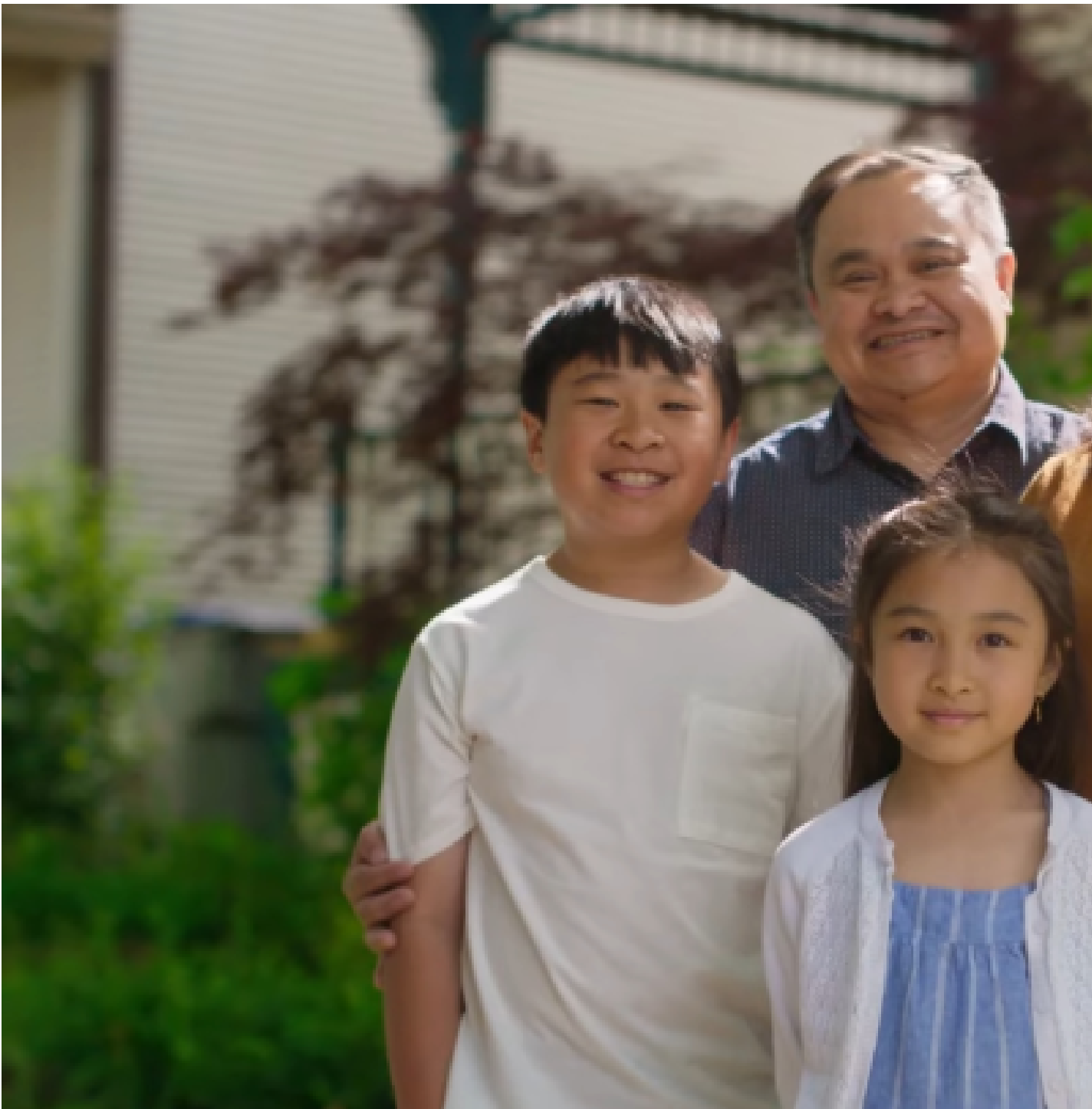
賀錦麗團隊推出了廣告《我的母親》。

9月，賀錦麗團隊推出了廣告《 我的母親 》，再現了她在民主黨全國代表大會主旨演講中向自己的印度裔母親致敬的片段，稱正是母親傳遞給她的價值觀支撐着她的公共服務生涯。此外，在亞裔佔比最高的搖擺州內華達州，賀錦麗團隊 據報 近期加強了針對該州少數族裔，尤其是佔比最高的菲律賓裔媒體的廣告攻勢。