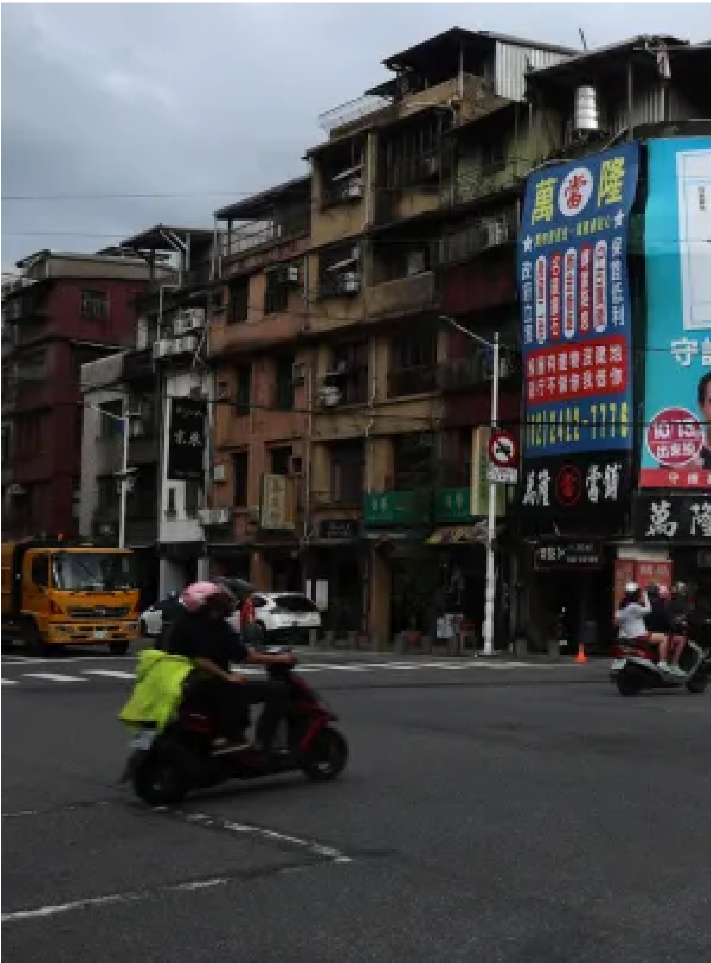
2024年10月12日，基隆，反對罷免的海報。