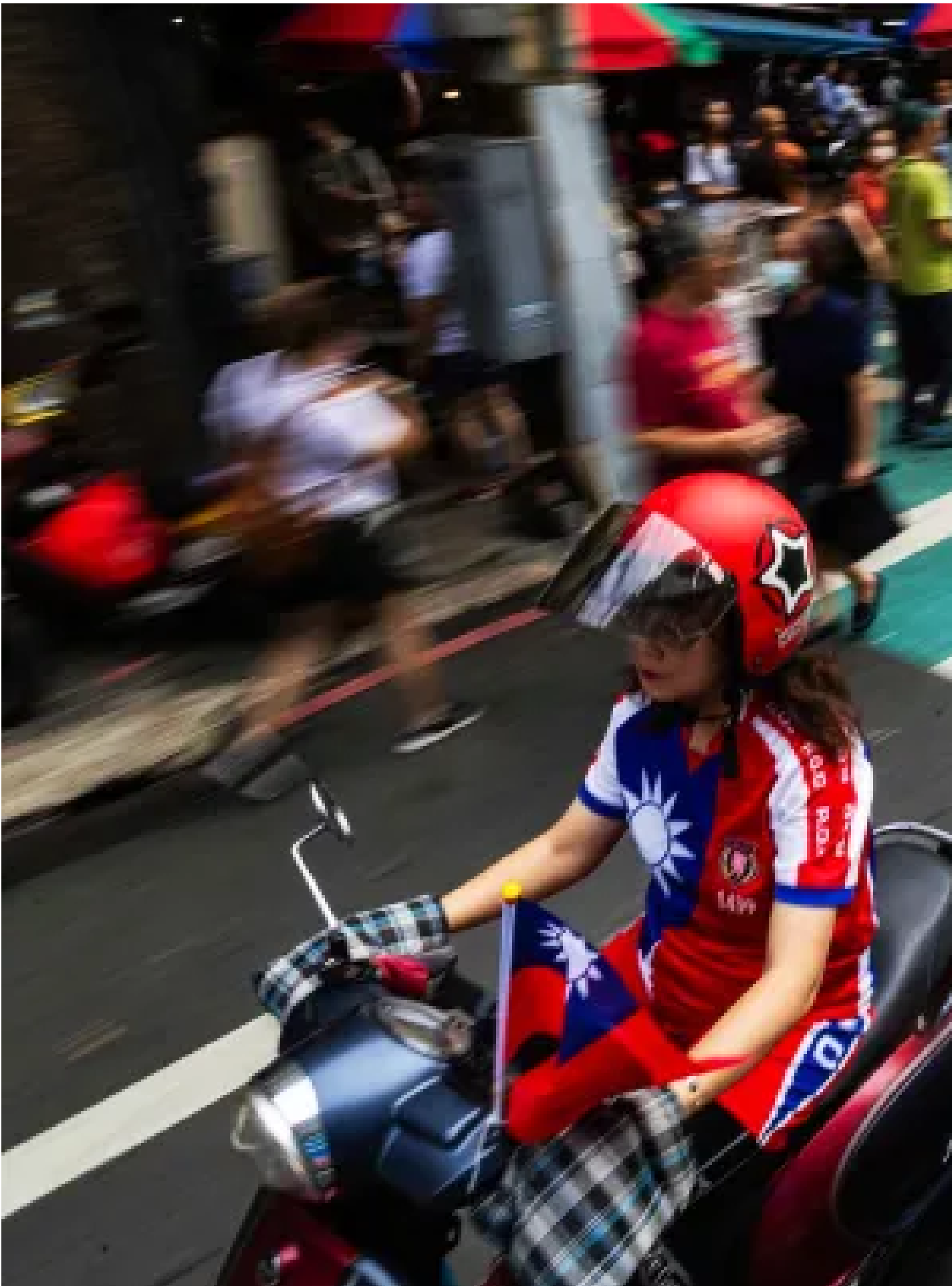
2024年10月12日，基隆，市長謝國樑和韓國瑜掃街拜票，國民黨支持者緊隨其後。

2017年，以時代力量黨籍勝選的立委黃國昌也同遭逢罷免投票，最終並未通過。黃國昌在選前受訪提及，謝國樑的施政表現他沒有意見，但如果對民進黨覺得憤怒，就出來投票，告訴賴清德台灣人民的憤怒。黃國昌還說，罷樑團體批評謝國樑不願溝通、違法亂紀、政策挑票，更像是在說民進黨。