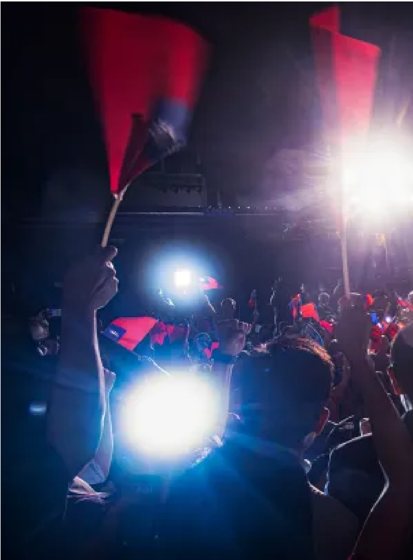
2024年10月13日，基隆，市長謝國樑發表選舉結果感言。

本刊載內容版權為端傳媒或相關單位所有，未經 端傳媒編輯部 授權，請勿轉載或複製，否則即為侵權。