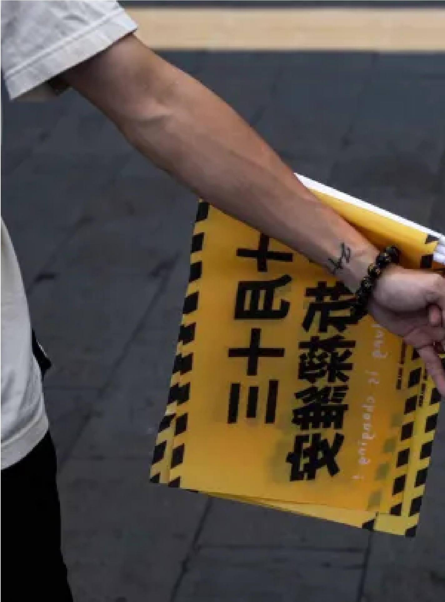
2024年10月12日，基隆，支持罷免的「山海公民拆樑行動」於海傍集會。

另一名91歲的陳姓老者則主動向記者攀談，他對記者發表自己的見解指，國民黨集中所有的力量來支持謝國樑，「昨晚全部人都來啊，你要怎麼跟他對打？」