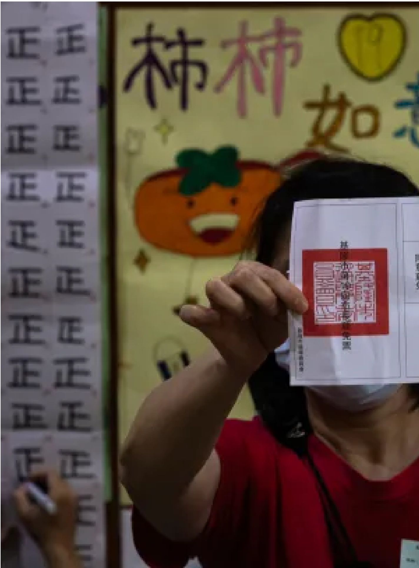
2024年10月13日，基隆，工作人員在投票所內點票。