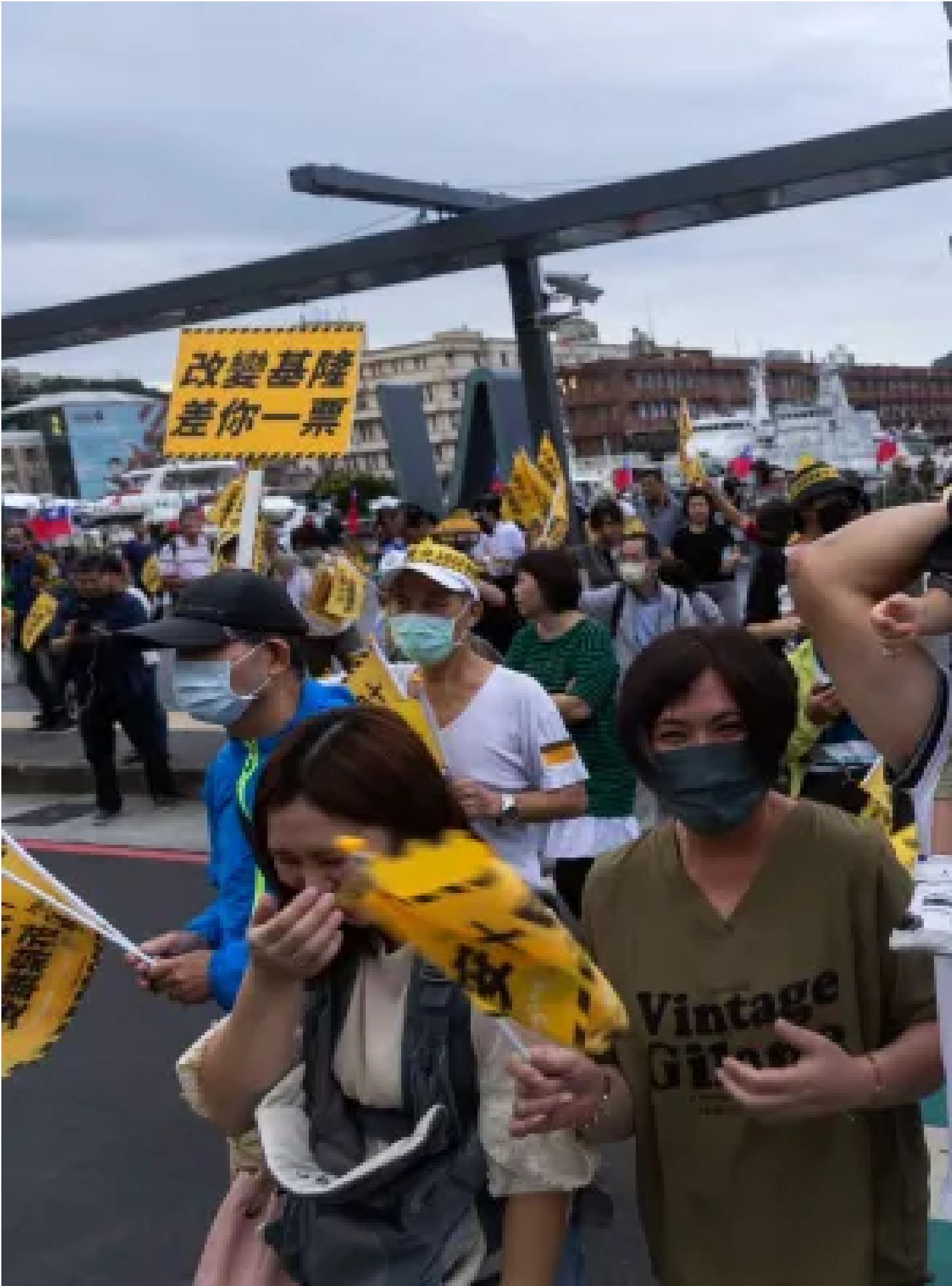
2024年10月12日，基隆，支持罷免的「山海公民拆樑行動」於海傍集會。

僅以補助不特定電動機車四萬元給做公益的青年，從「免費送 Gogoro」到補助四萬元，受到大量輿論批評。