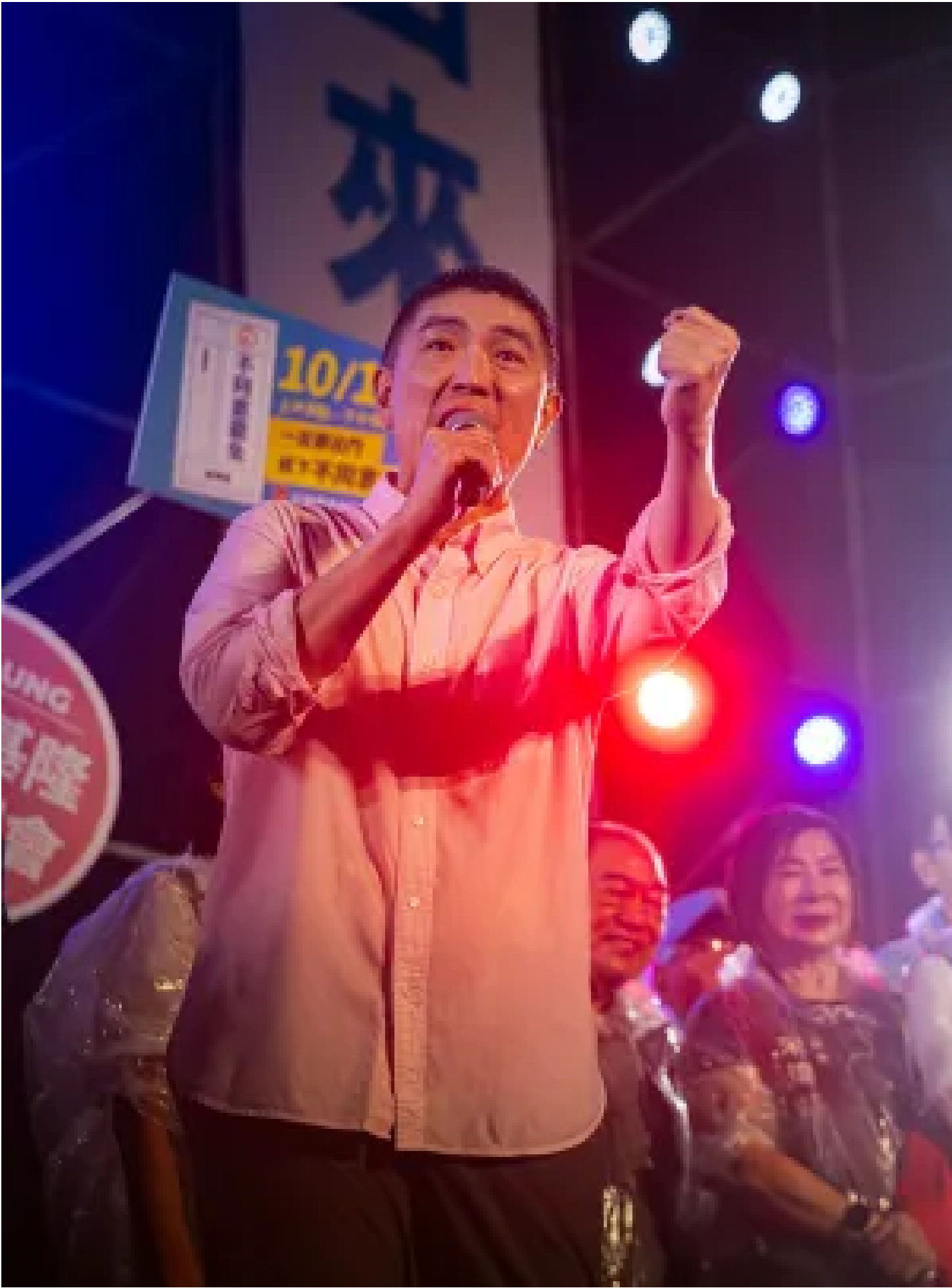
2024年10月12日，基隆，反對罷免的國民黨支持者於晚上集會，市長謝國樑在台上演說。

2004年，在隔年的第七次修憲將立委席次從225席減半為113席前，親民黨立委劉文雄轉任不分區立委，並提拔謝國樑參選立委。在宋楚瑜及劉文雄的光環加持下，謝國樑不僅在基隆獲得第一高票，並以29歲之姿成為全台最年輕立委，備受矚目。