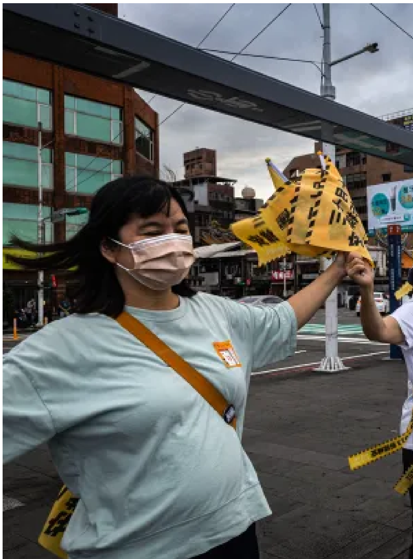
2024年10月12日，基隆，支持罷免的「山海公民拆樑行動」於海傍集會。