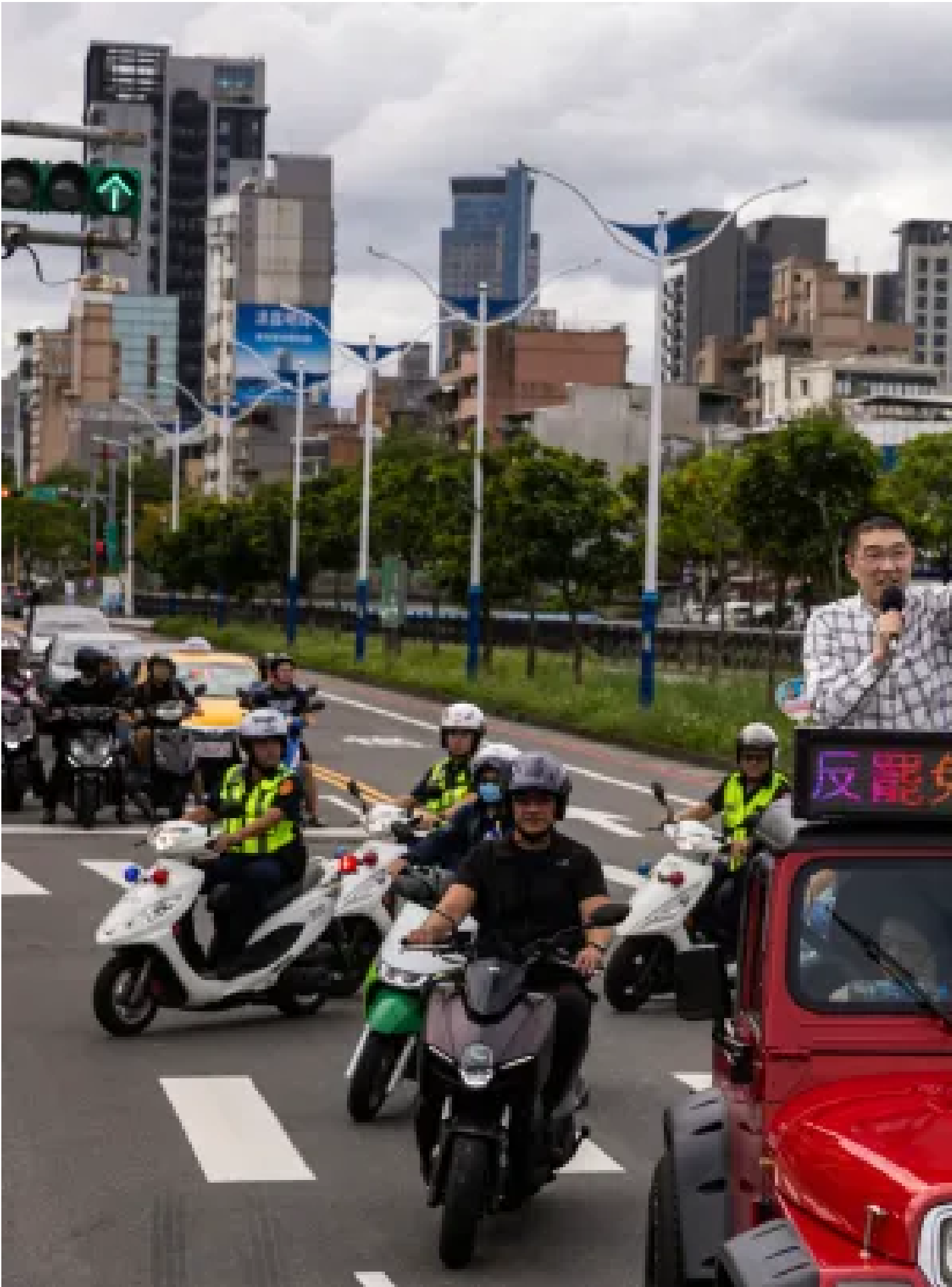
2024年10月12日，基隆，市長謝國樑和韓國瑜掃街拜票。

在罷免投票前一日，立法院院長韓國瑜作為被罷免的「過來人」也陪同謝國樑在市區掃街，韓國瑜更以一席「他去選總統了嗎？」（指2020年韓國瑜因選上高雄市長不久便投入總統大選而遭罷免）炒熱現場氣氛；晚間的「不同意罷免」造勢晚會，包含台北市長蔣萬安、新北市長侯友宜、國民黨主席朱立倫以及國民黨團立法院總召傅崐其與多名立委皆站台向選民喊話投下反對票，