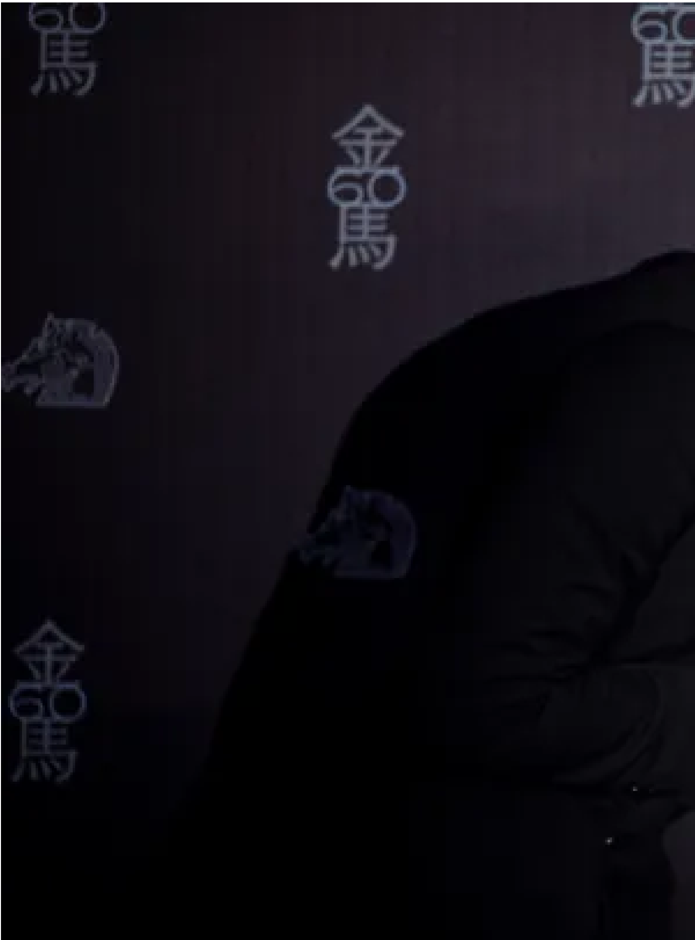
2023年11月25日，第60屆金馬獎頒獎典禮，《富都青年》的吳慷仁獲得最佳男主角。

而另外一點，是吳慷仁這幾年在許多香港觀眾心目中有著特別位置，除了經常開玩笑說他會講半鹹半淡的廣東話，拉近了跟香港影迷的距離，其實最主要是因為他一直沒有北上大陸發展，當不少香港藝人都變成「大灣區哥哥」和「大灣妹」，台灣天王天后都不介意「中國台灣」這個標籤的時候，吳慷仁過去一直獨善其身，像股清流，在這幾年的後社運時代多少是有一些時勢使然的光環。俱往矣，或者演技好，形象太好，讓他的壞變得更不可饒恕。當清流不再，光環應聲粉碎。