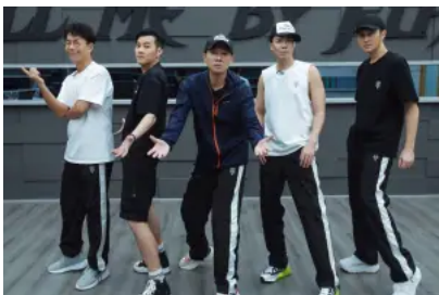
偶像坍塌後怎麼辦？與大灣區哥哥姐姐價值觀漸遠的昔日粉絲們

北上發展也可以有好多程度，可以做劉德華全力投入，也可以做梁朝偉或張學友，賣藝不賣身。與大陸簽約不代表就要逢迎那套想賺錢就要認祖宗的「行規」。