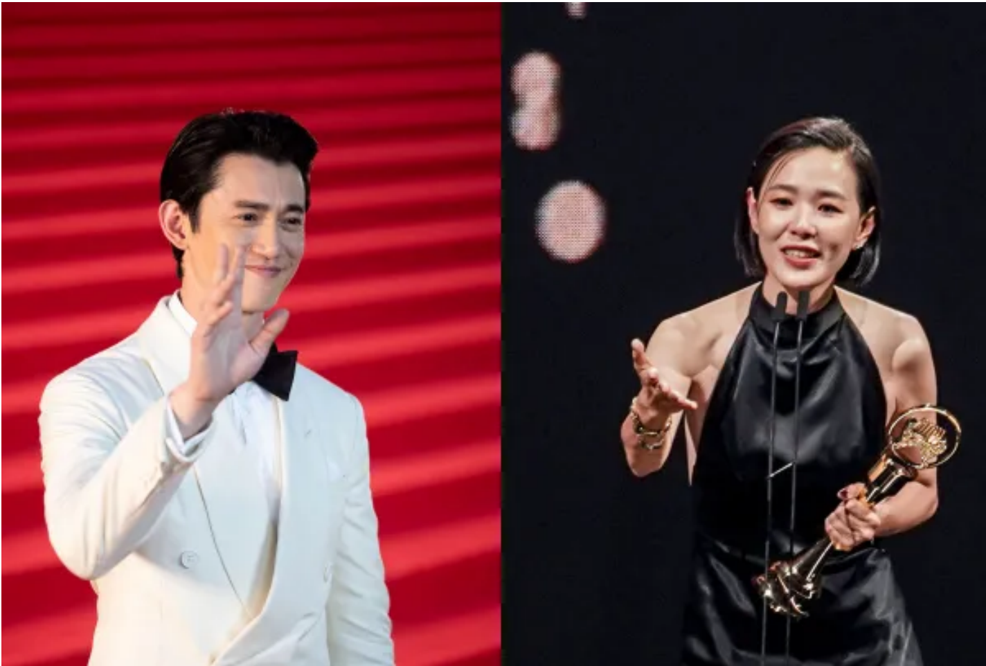
台灣演員吳慷仁與歌手安溥。

安溥一夜洗底，吳慷仁卻剛好相反，被翻舊帳。若吳慷仁令人想起五年前的彭于晏，安溥令我們想起誰？