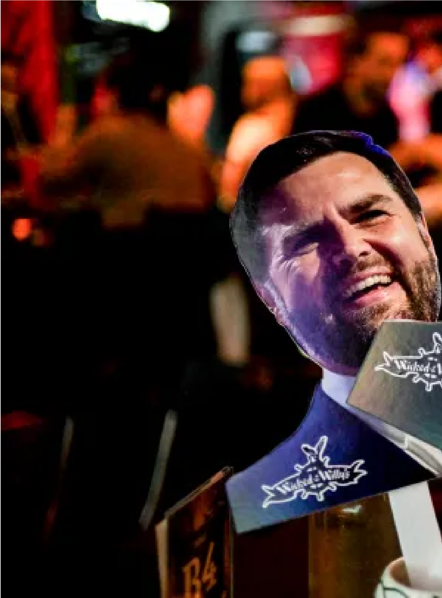
2024年10月1日，共和黨副總統候選人凡斯和民主黨副總統候選人沃爾茲在第一場副總統辯論，有酒吧觀看辯論的觀眾帶同二人的肖像紙牌觀戰。

這一口誤被特朗普捕捉到，並在他的社交媒體TruthSocial上大肆傳播。據統計，辯論當晚特朗普共發布推文48條，其中五條都是嘲諷沃爾茲的口誤。