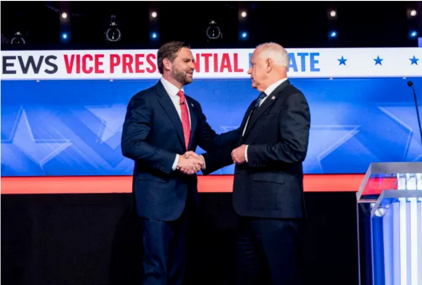
2024年10月1日，共和黨副總統候選人凡斯和民主黨副總統候選人沃爾茲在第一場副總統辯論中握手。

離開真相，談何看見彼此和追求正義？我們的日報、速遞Whatsnew、端聞Podcast能夠保持免費，離不開每一位會員的支持。 暢讀會員首月5折 ， 尊享會員全年85折 ，幫助我們做出更好的即時報導和深度內容。