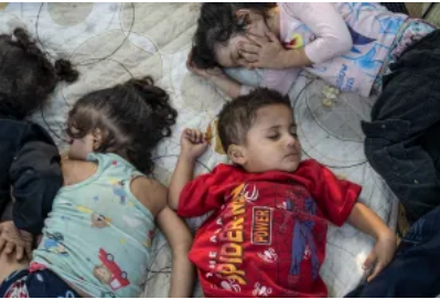
以色列為何升級黎巴嫩戰事？伊朗會如何反應？中東距全面戰爭多遠？

國際關係危機的討論也在大選中升溫。10月1日，以色列地面入侵黎巴嫩，伊朗隨後用導彈襲擊以色列，以報復以色列打擊黎巴嫩真主黨。特朗普當日在威斯康辛州的一場集會中猛烈抨擊現任副總統賀錦麗和總統拜登的外交政策，並斥責他們「正在把我們帶到第三次世界大戰的邊緣」。