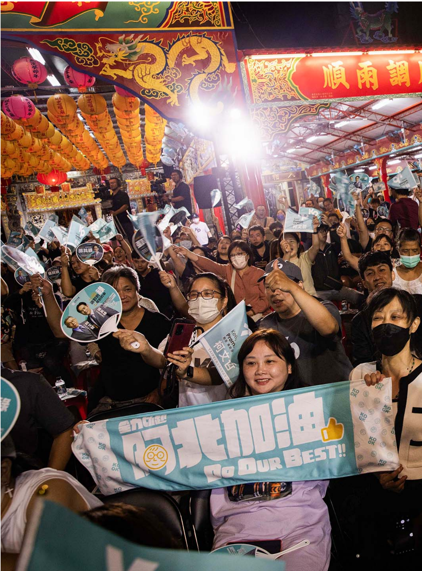
2023年10月16日，台北，柯文哲的支持者出席民众党的活动。