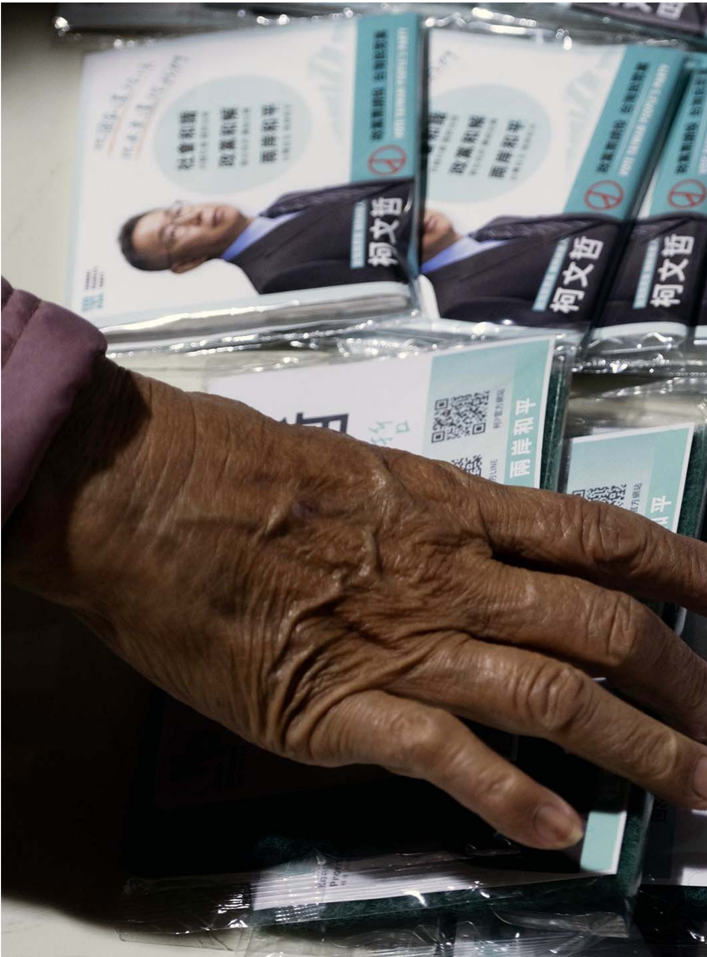
2023年11月18日，柯文哲竞选活动上的宣传品。

有趣的问题来了：这些真小草并不是民众党的支持者，而是柯文哲的信徒。如果柯文哲跌落神坛，那他们是否会继续去支持民众党？我想除非民众党可以马上请出一个类似柯文哲的共主，坐好神坛的宝座，否则这些小草非常可能会放弃民众党，直接在其他场域找到自己可以依赖的对象。 民众党内的政治人物其实明白这个问题，这也是为什么民众党在面对弊案的操作上，一切都以“保护柯文哲”为最高指导原则。毕竟一旦真小草脱离了民众党，那么民众党就必须花费更多的心力来重组自己的群众基础。这是一个劳民伤财且要花费许多精力的工作，除非下一个共主可以自带流量，否则民众党内部仍要继续稳住柯文哲，来留下这些真小草支持者。 当政治变成信仰的时候，很多是是非非的界线都会变得模糊。而民众党与柯文哲这次的政治献金弊案，就如同一面照妖镜，把民众党政治人物的问题，以及民众党支持者的想法，通通都摊在阳光下，让其他人一探究竟。或许也算一桩好事。 # 政治献金丑闻 # 台湾民众党 # 民众党 # 柯文哲 本刊载内容版权为端传媒或相关单位所有，未经 端传媒编辑部 授权，请勿转载或复制，否则即为侵权。