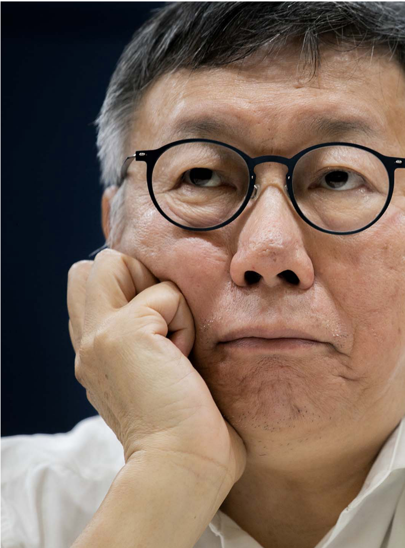
2024年8月12日，台北，民众党主席柯文哲举行记者会说明政治献金申报不实争议。