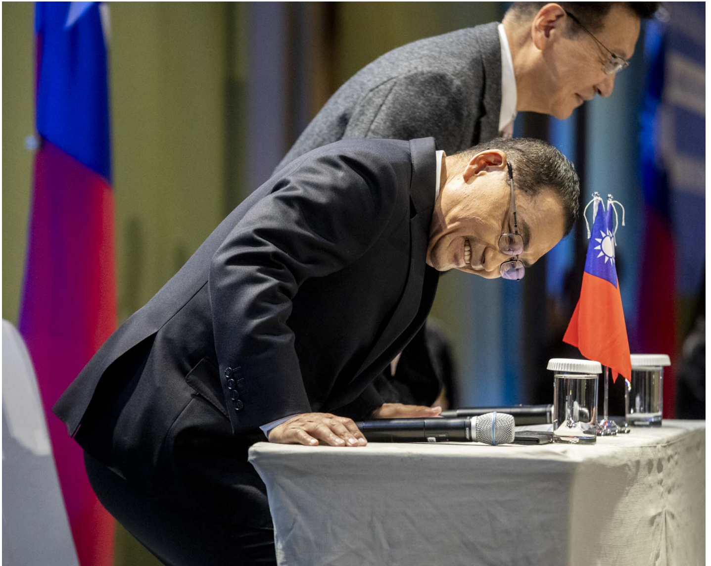
2024年1月11日，国民党正、副总统候选人侯友宜、赵少康召开国际记者会。

既是经贸的，亦是政治的，ECFA冲突背后，是台湾独特而复杂的“中间产品”出口体系。