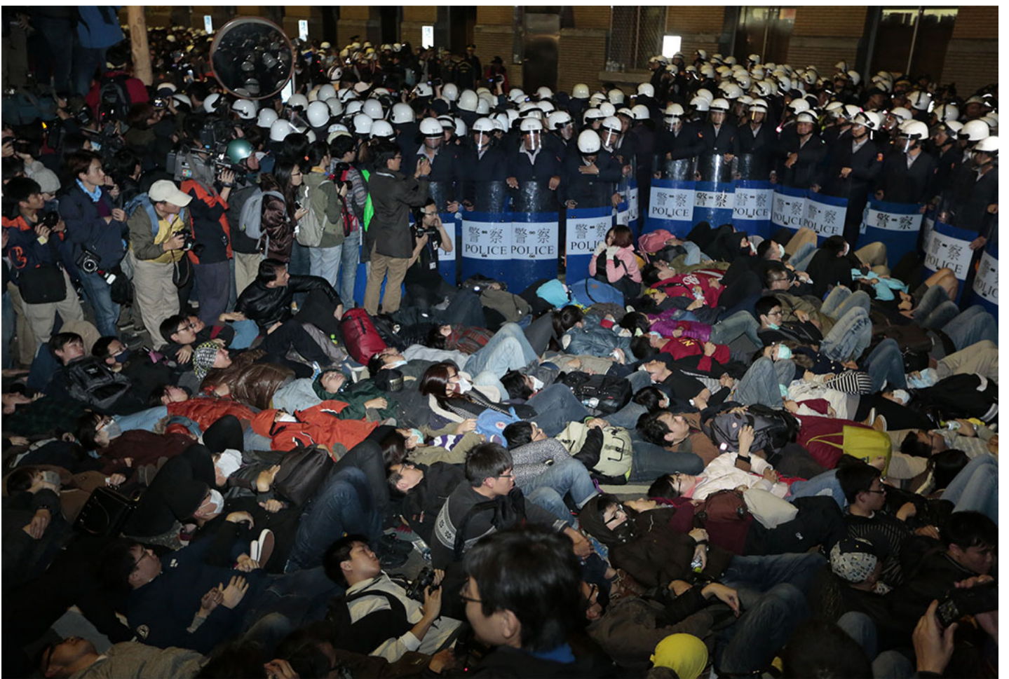
2014年3月24日凌晨，台湾“323攻占行政院行动”，警察在行政院外准备清场。