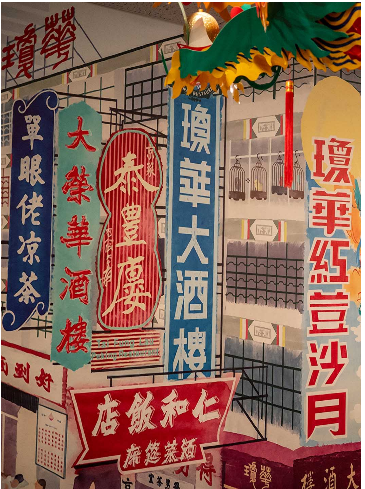
温哥华一家港式糖水店的墙身画上各式香港酒楼、餐厅及小食店的招牌，天花上挂有一条纸龙。