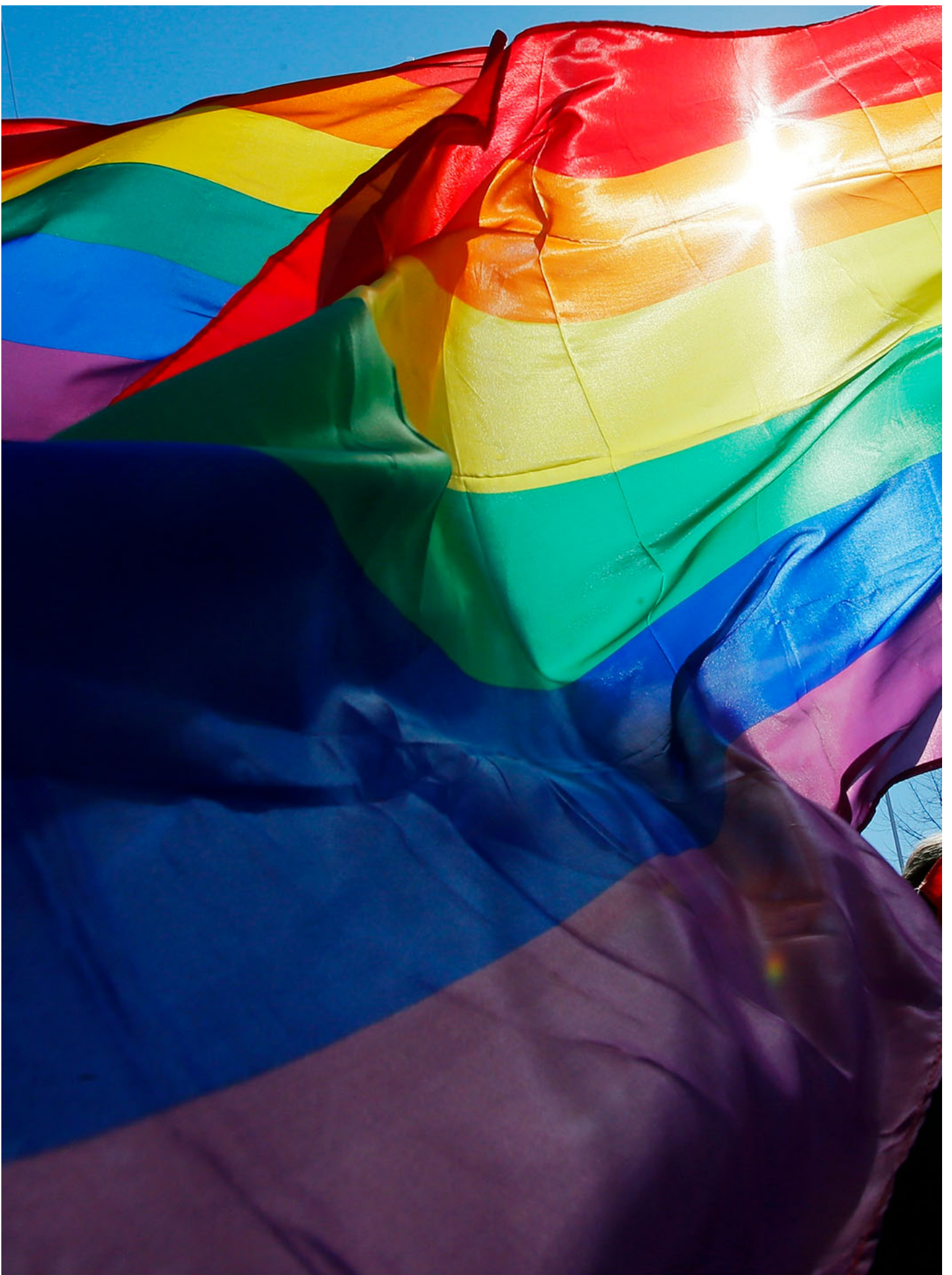
2013年5月1日，俄罗斯圣彼得堡，示威者在举著彩虹旗游行。

而在文化界，此前标记“18+”后即可销售、播放、展出的涉 LGBT 内容的文化产品被完全禁止。仅2023年前10个月，俄罗斯最主要的在线流媒体音乐平台 Yandex 音乐就下架了四千多首涉及“宣传 LGBT”“抹黑俄军”“不尊重总统”等内容作品，俄罗斯各家流媒体视频网站因“展示 LGBT 内容”被立案47次，罚款近3000万卢布（30万美元）。噤若寒蝉的电视台甚至开始把完全没有政治意味的彩虹画面涂成灰色。而俄罗斯的高等学府则开始将“性别研究引论”课程改名为“男人和女人研究引论”。（延伸阅读：《从“亲近西方”到“丧失理智”，普京与俄罗斯政治的二十年浮沉》）