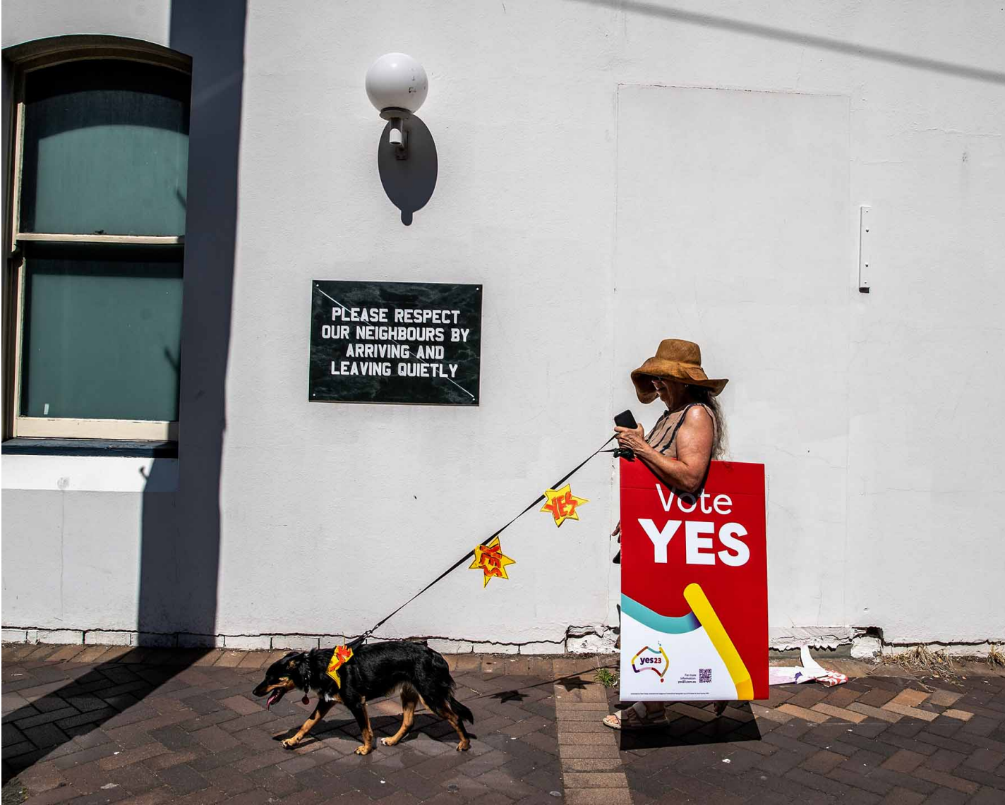
2023年9月17日，澳大利亚纽卡斯尔举行的“Walk for YES”活动中，一名妇女举著标语牌，带著她的狗走向公园。

有原住民活动家悲观认为，澳大利亚要再过两个世代，才能真正直面自己的殖民主义根基，承认原住民，并与原住民对话。