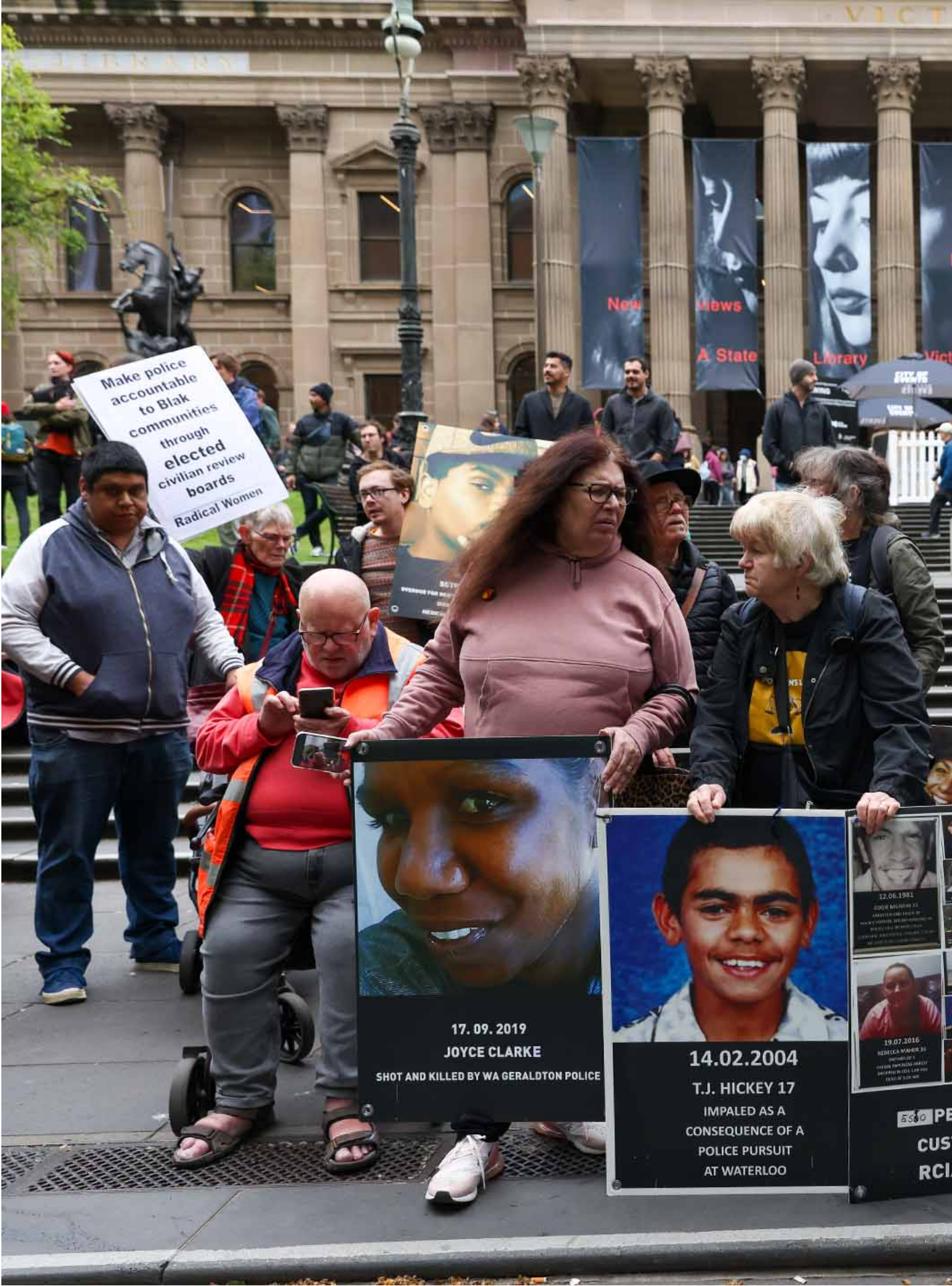
2023年10月7日，澳大利亚墨尔本，抗议者举着在羁押期间死亡的原住民照片。

此次公投失败，或者根因在此：尽管大部分的澳大利亚民众的祖先得益于殖民体系，但在今天，身为殖民者后代的他们仍认为，原住民事务是一个与他们无关的议题。