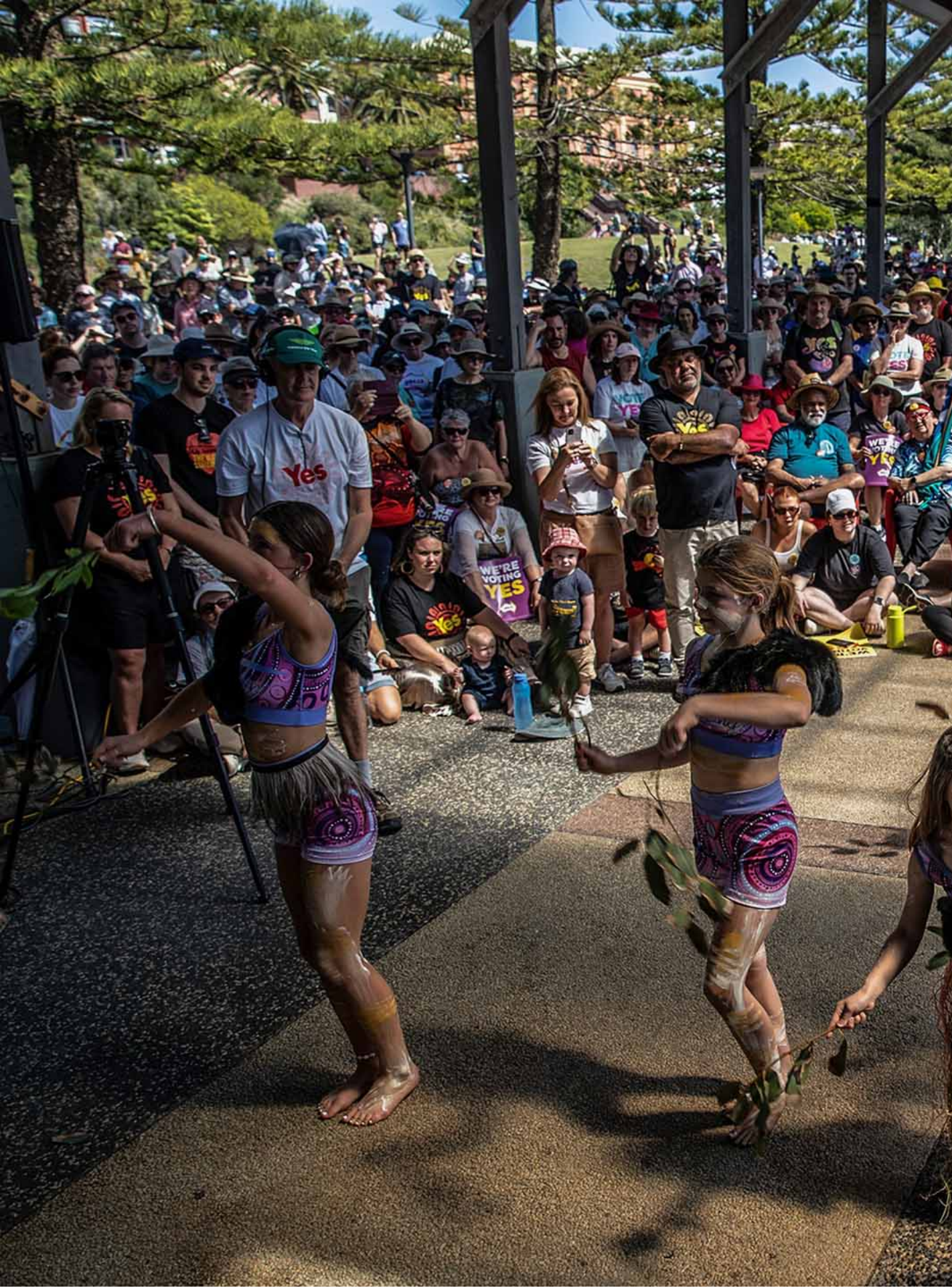
2023年9月17日，澳大利亚纽卡斯尔，当地原住民舞蹈团于活动中表演传统舞蹈。

然而，从结果来看，华人与其他多元文化社区并非是“反对”阵营的主要票源。独立公投分析员 Ben Raue 在 其博客表示 ，尽管有更多多元文化背景选民的选区大多投了“反对”，但从反对与赞成的幅度来看，这一差距远低于以白人为主的偏远地区；换言之，多元文化背景选民实际上是更倾向于赞成修宪。