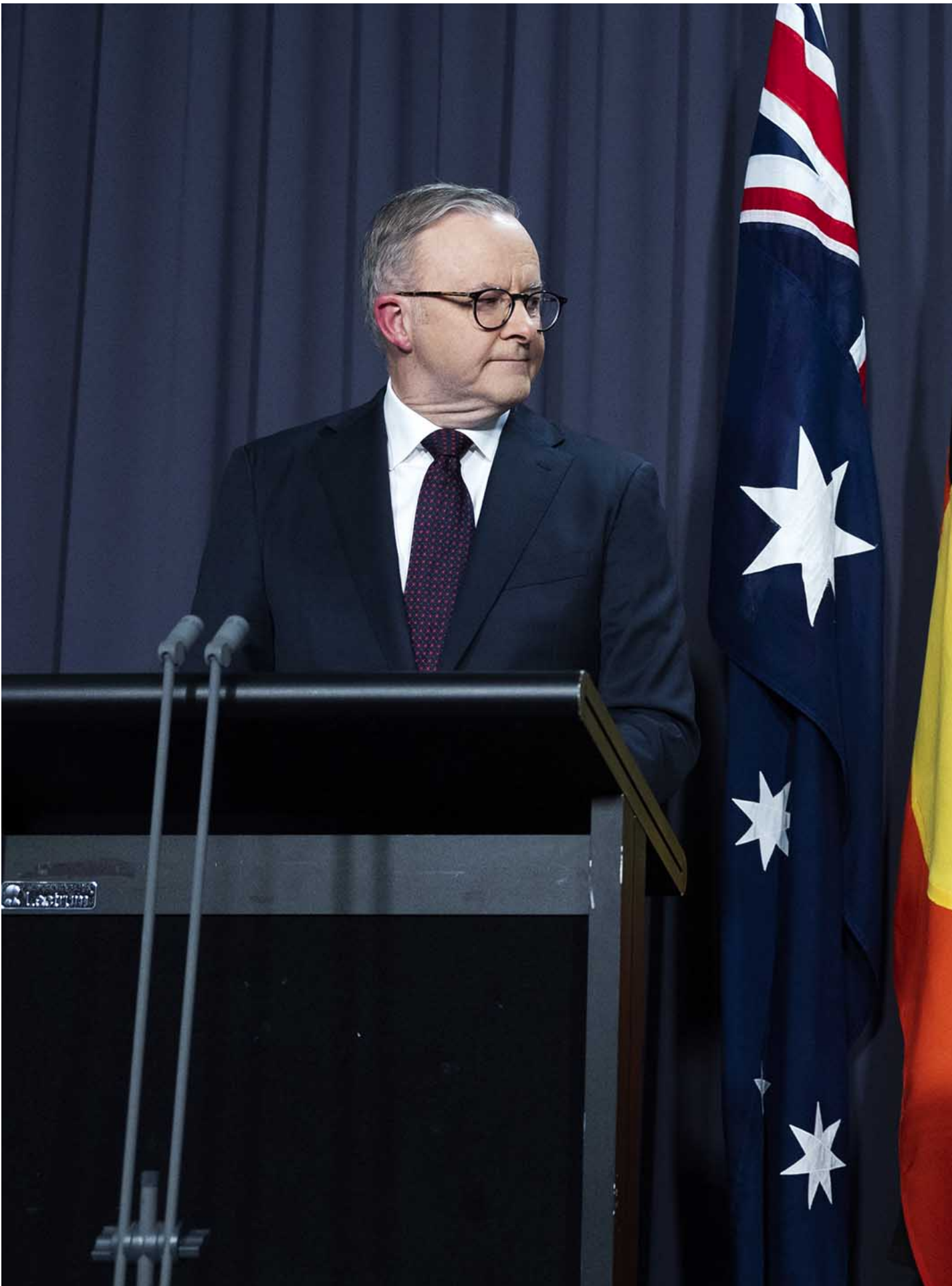
2023年10月14日，澳大利亚总理安东尼·阿尔巴尼斯与原住民事务部长琳达·伯尼在坎培拉议会大厦举行的公投记者会上。