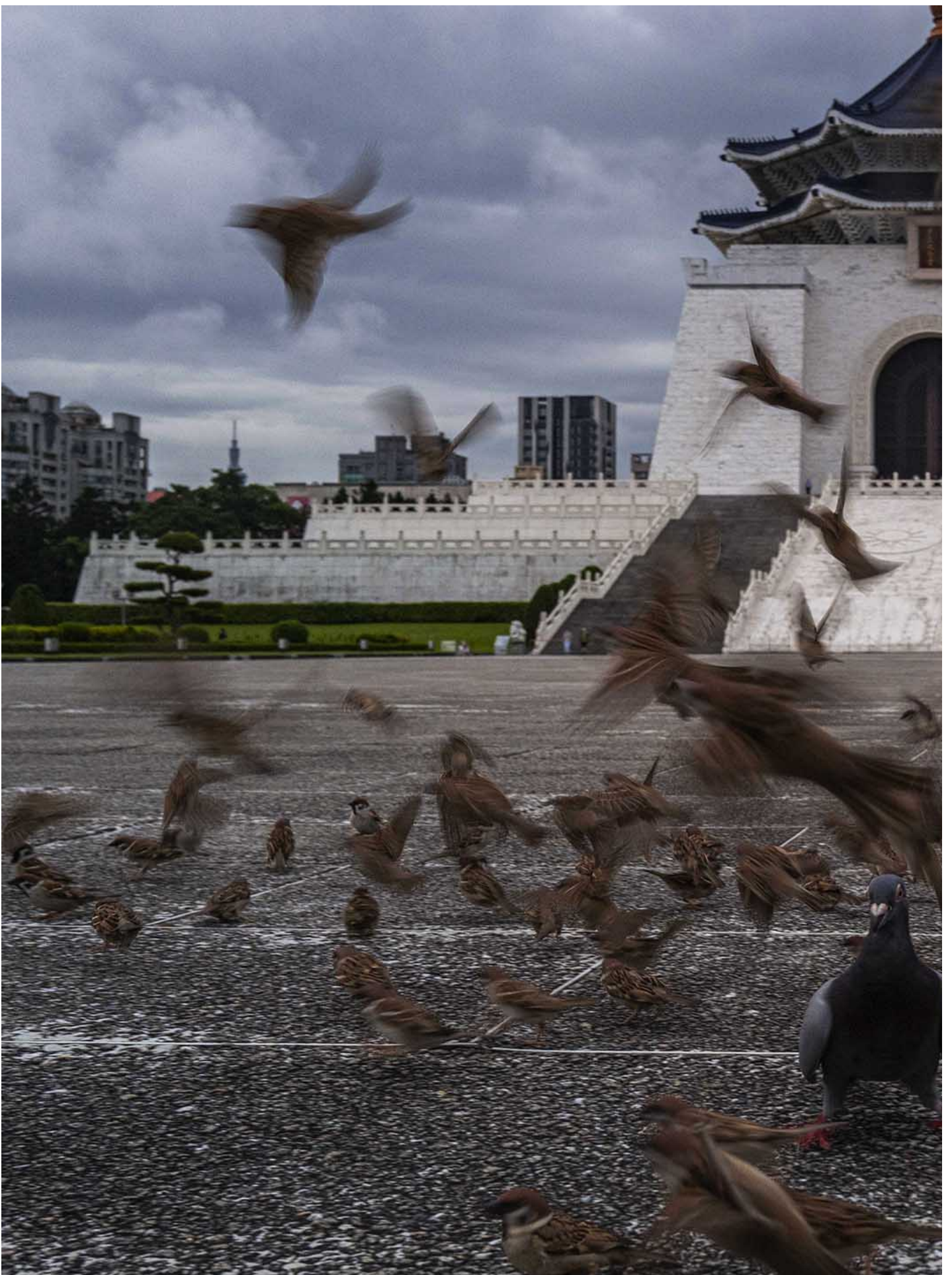
2022年5月23日，台北中正紀念堂。