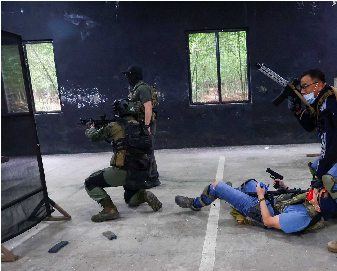
2022年5月22日，新北市，極光訓練的射擊場，學員們在氣槍訓練課內進行人質營救任務。

台灣民眾抵抗意志的高低，一直是台灣、中國、美國間互相角力、互相投入與抵銷的過程。