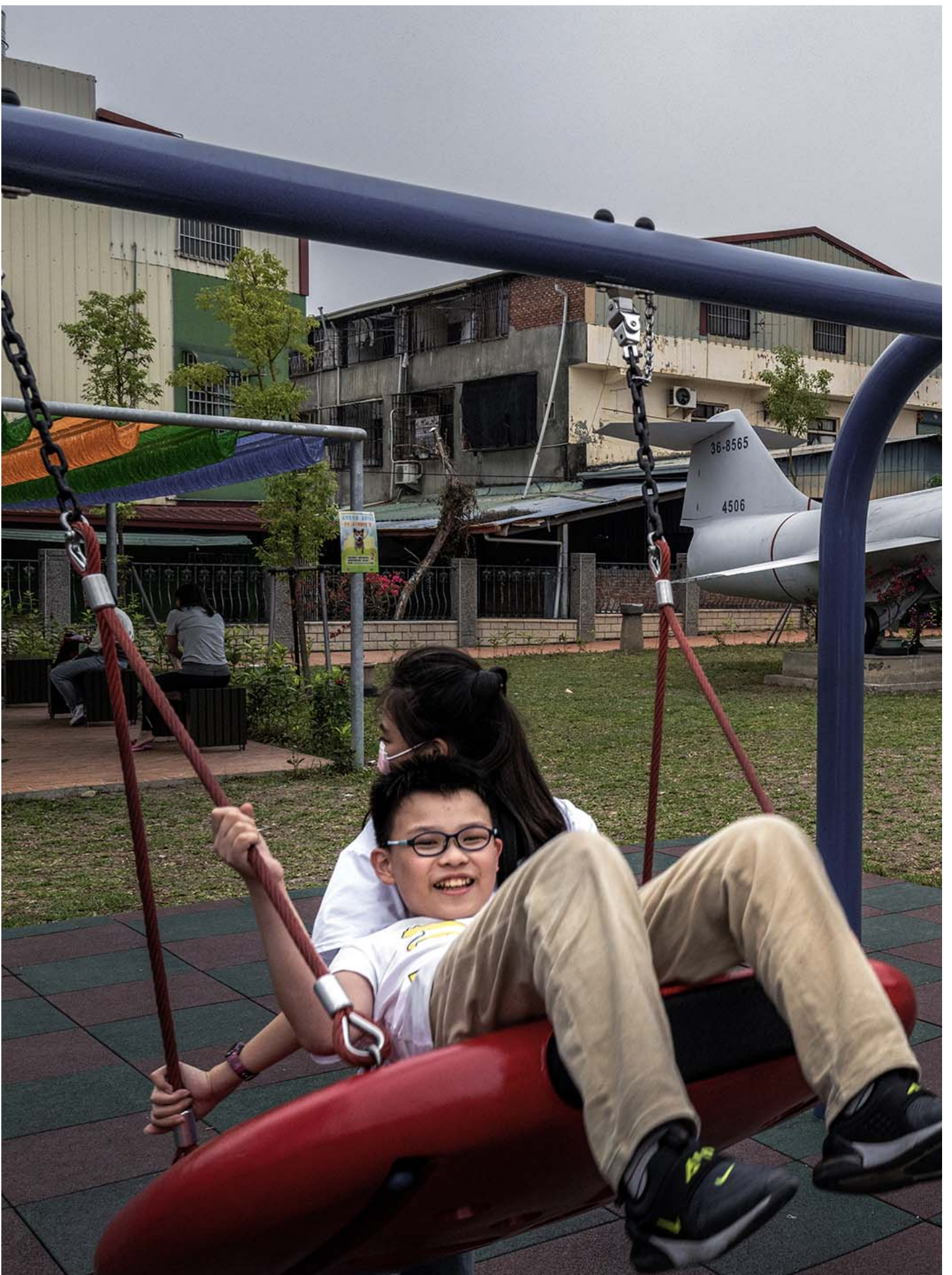
2023年4月5日，集集軍史公園。