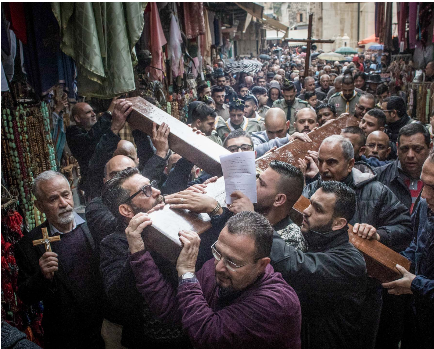
2018年3月30日，以色列耶路撒冷，基督徒抬著木制十字架来到圣墓教堂入口。