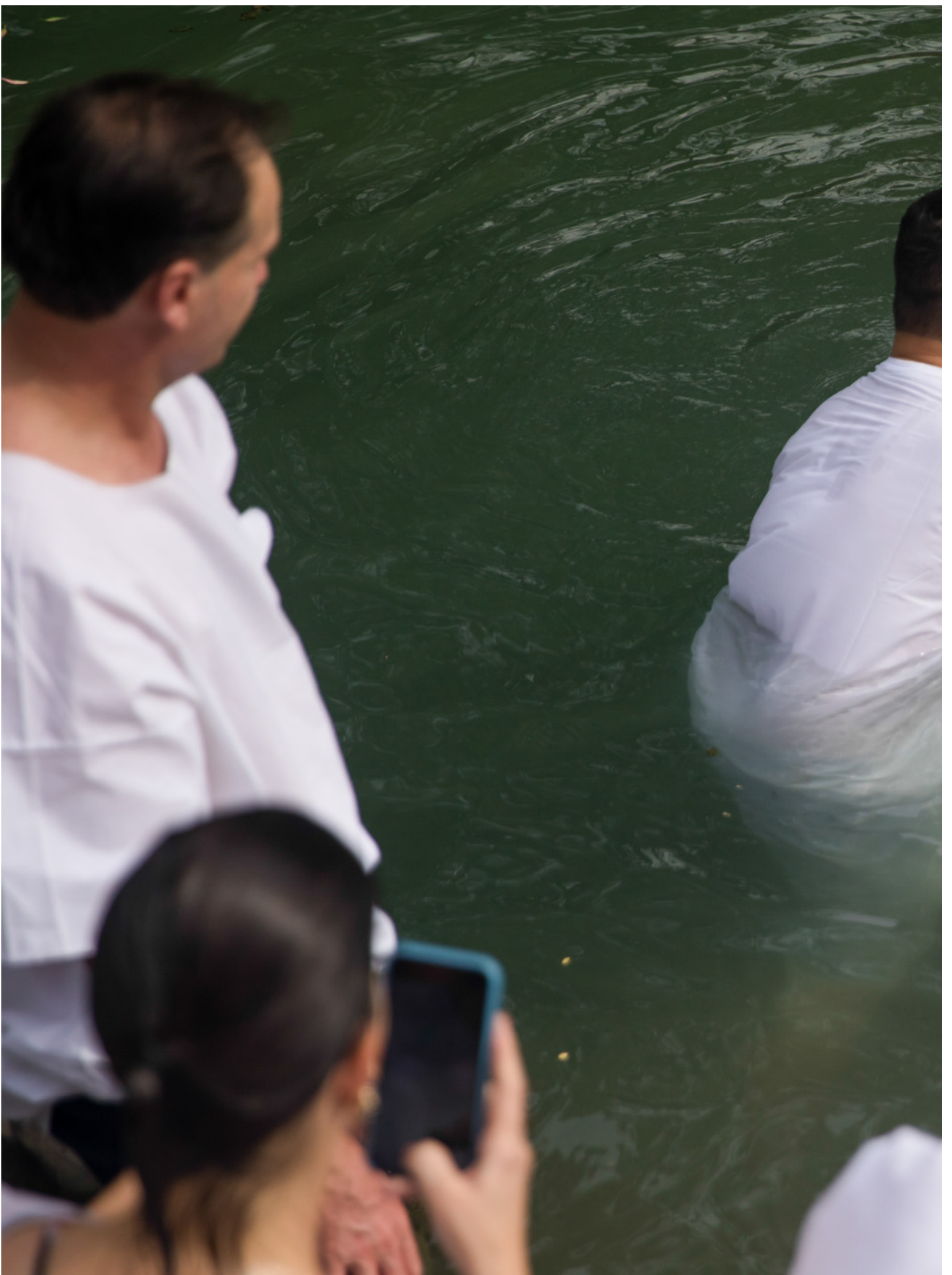
2023年6月13日，以色列，基督徒在约旦河受浸。

千禧年（Millennium）正是基督教终末论的一个重要概念，它出自《启示录》，其中提到在末日世界会陷入战乱灾祸之中，以色列及基督教会都会受到压迫，并且有魔鬼的使者当道，但最后上帝会战胜代表撒旦的大红龙和兽，那些坚持信仰的殉道者随之便会复活，和耶稣基督做王一千年，因为这一千年由耶稣掌管，世界将焕然一新。千禧年与耶稣再来紧密挂钩，但至于如何诠释千禧年和耶稣再来之间的关系，不同流派就带出了不同解读。