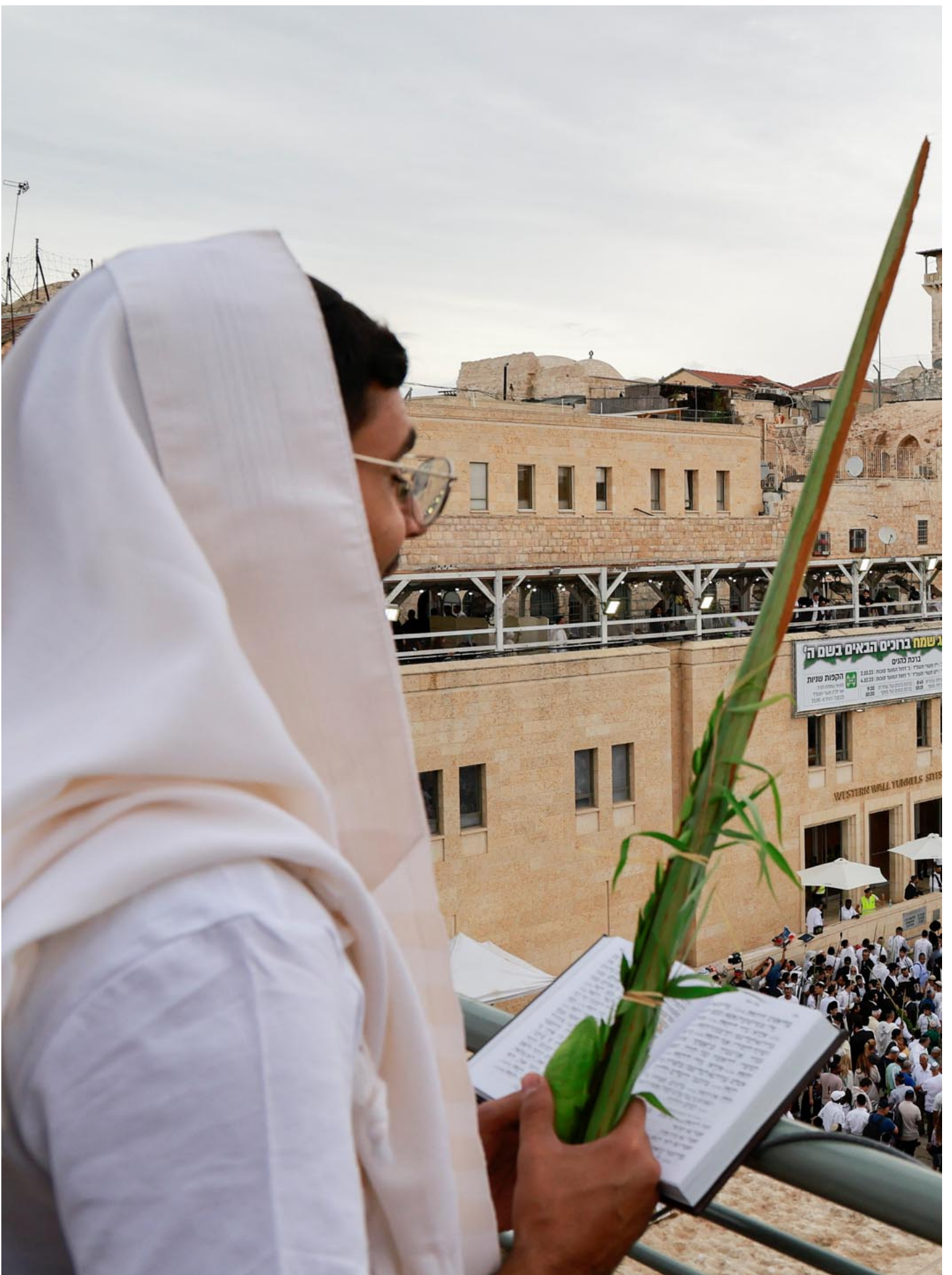
2023年10月2日，耶路撒冷旧城西墙的祈祷地点。

也许有人觉得，华人教会不自觉的时代论者们，也不过就是做做键盘战士，他们无论多么支持以色列，也不可能对局面造成任何影响。但时代论者可恶之处，本来就不是他们支持以色列那么简单，而是这种支持背后所反映的意识形态。以巴问题或许是一面照妖镜，让这种意识形态现出原型，但它早已经潜移默化影响着信徒的生活。