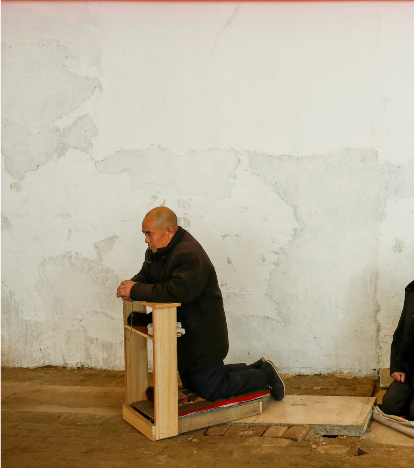
2016年12月11日，中国，男子在铁皮屋顶教堂参加周日礼拜。

另一方面，在冷战时期，“基督教锡安主义”成为借由支持以色列，来对抗得到苏联支持的泛阿拉伯民族主义的重要策略，该论述受到美国右翼人士的不断鼓吹和推广。比如一九六〇年上映的电影《出埃及记》（Exodus）就讲述一群集中营的幸存者在以色列民族英雄的带领下，前往耶路撒冷并最终成功发动民族解放战争并成立以色列国的故事，在电影中，集中营幸存者的身份已经确立了以色列人是受害者的形象，更将之与旧约中以色列人逃离埃及暴政进入神所应许的迦南美地挂钩，显然暗示以色列国的建立乃上帝应许的实现，更是该地的合法持有者。一九九五年开始出版的系列小说《末世迷踪》（Left Behind）更是时代论的巅峰，它严谨地按照时代论对圣经预言的理解，用十六本书精彩描写了末世大灾难的情况和群像，之后更被改编成系列电影。无论“时代论”还是“基督教锡安主义”都不仅在教会内流行，更透过流行文化和政客的论述，形塑了一代人对以巴冲突的想像，加深了对穆斯林及阿拉伯世界的刻板印象和偏见。