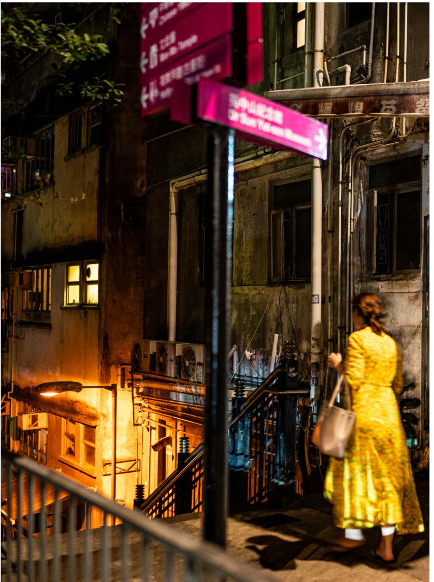
2023年8月27日，“辉煌快餐店”门外已换上新的壁画。

店主对香港本地媒体表示称政府部门可能认为安全帽和2019年的反修例运动有联系，估计警方看后可能觉得不舒服。她猜测政府因此决定遮盖涂鸦。