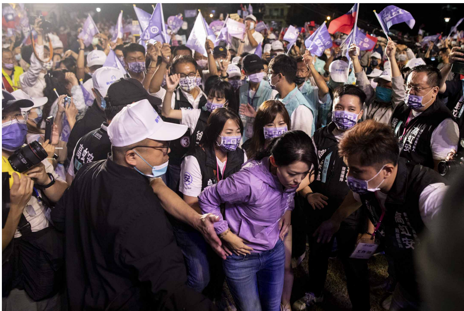
2022年11月19日，参选新竹市长选举的民众党高虹安于晚间举行造势晚会。

在台湾，诈领助理费有多起前例可循。自2019年起算，全台至少20位议员因此被检调约谈、起诉，甚至判刑。