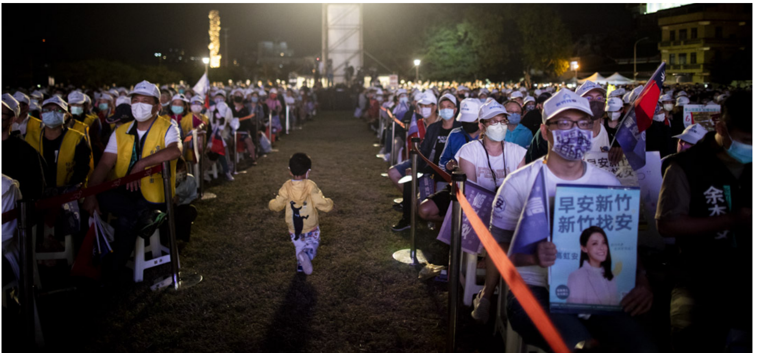
2022年11月19日，高虹安的新竹市长选举造势晚会，现场支持的市民。

然而，同年12月，高虹安尚未正式宣誓就职新竹市长，检方便对高虹安的国会办公室展开搜索行动，并谕令新台币60万元交保，此举遭高虹安及民众党支持者痛斥为“ 司法迫害 ”、“ 政治追杀 ”。