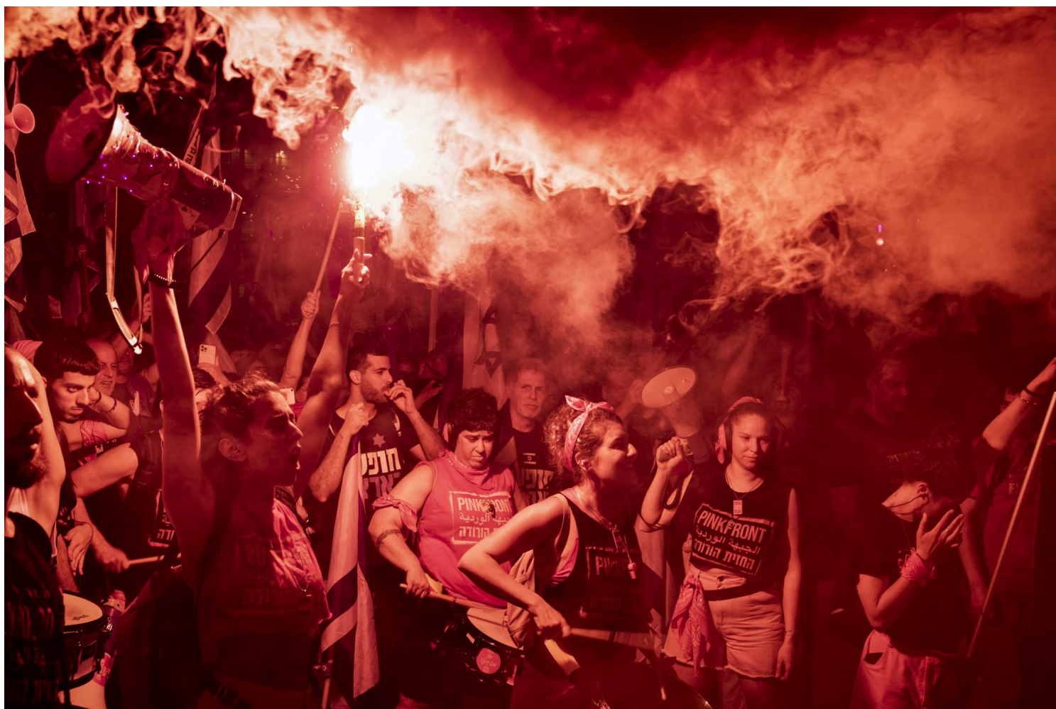
2023年7月22日，以色列特拉维夫，示威者连续29周示威反对司法改革法案。

为何这一改革如此问题重重？这需要追溯到更为深层次的社会分裂。2009年，出身党内右翼的内塔尼亚胡当上总理，并从此成为以色列累计执政时间最长的总理。在他任内，他多次面临贪腐指控，因此屡次依赖对巴强硬与向极端右翼宗教党派示好维持其不被倒阁，因此给予了极右翼势力发展的空间。在他任内，极端正统派犹太人政党的势力大大扩张，再加上其出生率居高不下，由此，以色列政治在过去十余年间成为以色列政坛不可忽视的重要力量。（延伸阅读： 《特拉维夫骄傲月见闻：以色列是中东的同志天堂么？》 ）