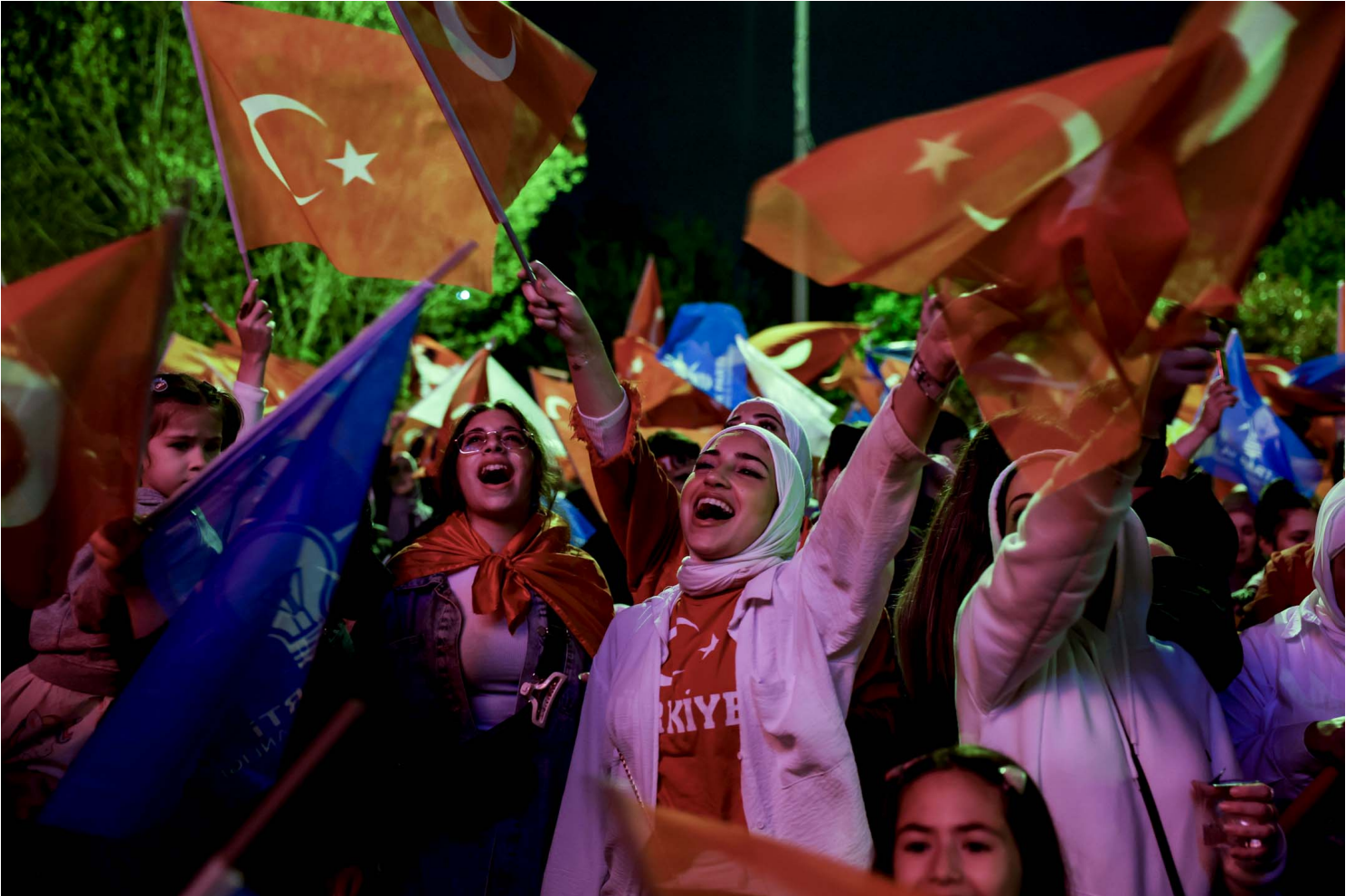
2023年5月28日，土耳其伊斯坦布堡，總統埃爾多安的支持者聚集在正義與發展黨總部前慶祝勝利。

反對黨此次挑戰埃爾多安的一大話題，是土耳其境內數百萬敘利亞難民的去處。在上一個十年的敘利亞戰爭中，土耳其開始時和歐美站在一條戰線上，希望看到長年宿敵阿薩德政府就此倒台。埃爾多安也藉着收容上百萬敘利亞難民，證明自己的政治伊斯蘭路線，即將世界上的穆斯林都當作兄弟姐妹。但土耳其又是歐盟阻擋難民的「前線」，上百萬人就此滯留，引發國內的民族情緒和「人口替換」的嚴重焦慮。