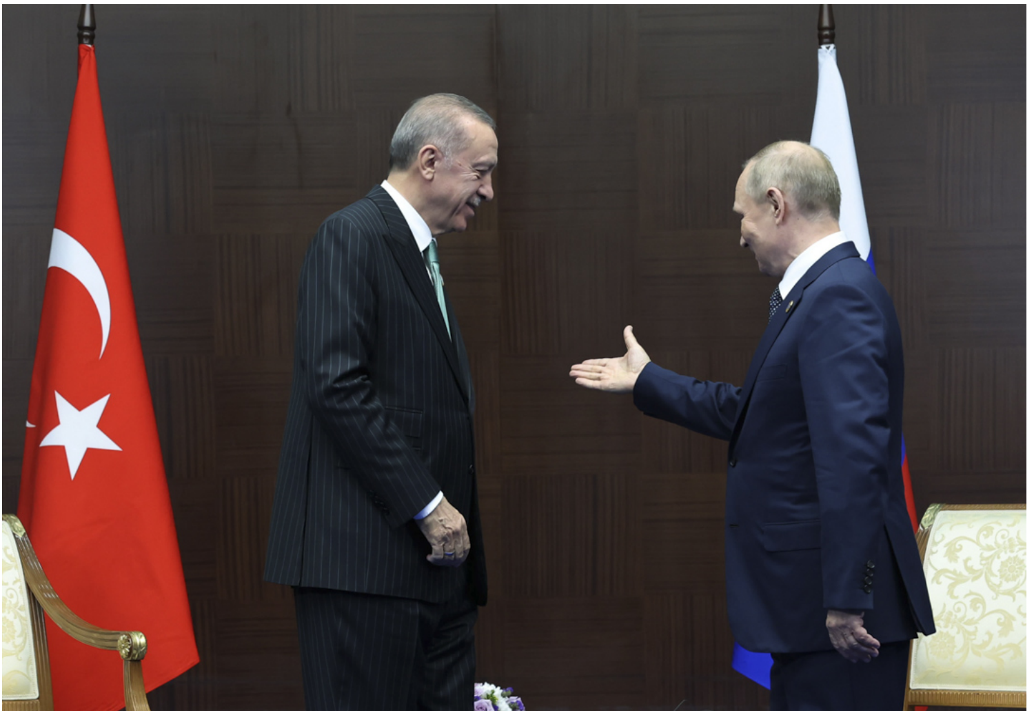
2022年10月13日，哈薩克舉行的亞洲互動與信任措施會議（CICA）期間，土耳其埃爾多安會見俄羅斯總統普京。

這次選舉結果中，最大獲益者首先是土耳其的右翼民族主義者。他們的主要主張是大土耳其主義、泛突厥主義和伊斯蘭身份政治。我們以在第一輪中極為「黑馬」的獨立候選人奧安為例——他有非常強的阿塞拜疆背景。阿塞拜疆語是諸多突厥語系語言中和土耳其語最近的。很多右翼民族主義者視阿塞拜疆人為「同一民族」。奧安曾在莫斯科學習國際關係，他的地區安全概念裏，土耳其需要在阿塞拜疆和亞美尼亞的衝突中支持「同胞」。