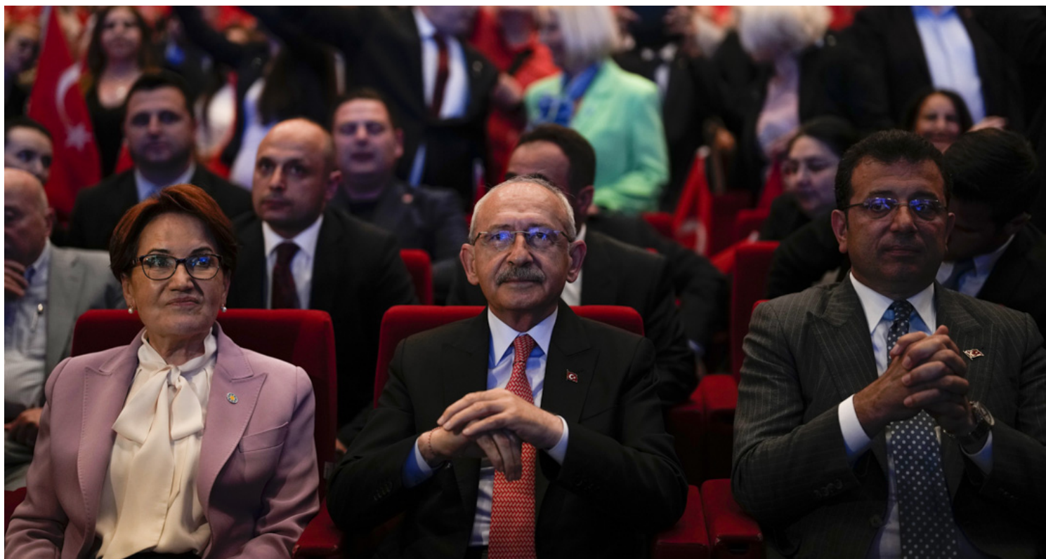
2023年5月26日，土耳其反對黨候選人基里達歐魯（Kemal Kilicdaroglu）出席土耳其伊斯坦堡舉行的競選活動。

除了基里達歐魯，土耳其還有其他民望頗高的反對派官員，例如現任伊斯坦堡市長埃克雷姆·伊馬姆奧盧（Ekrem İmamoğlu）。他曾在2019年的選舉中以80萬票大幅擊敗AKP對手，當選市長，在防疫、伊斯坦堡運河工程等重大政治議題都反對埃爾多安，卻深獲民心，甚至獲不少保守民眾支持。只是他專注地區發展，去年更因涉嫌侮辱政府官員，被法院頒布政治禁令和判處監禁兩年七個月（並未實際執行），暫時難以挑戰埃爾多安的政治地位。而土耳其首都安卡拉的市長曼蘇爾·亞瓦什（Mansur Yavaş），同樣屬於反對派，他因財政和防疫政策民望升高，更在去年獲得61%的支持率，是土耳其目前獲得最高支持率的政治人物，所以曾被視為最有力的總統候選人。但他表明不會參選總統，亦甚少就宗教、庫德族等議題明確表態，難以如基里達歐魯般，在國家層面團結選民，動搖埃爾多安的勢力。若埃爾多安當選，短期內土耳其似乎難再出現有力的反對派，與埃爾多安抗衡。