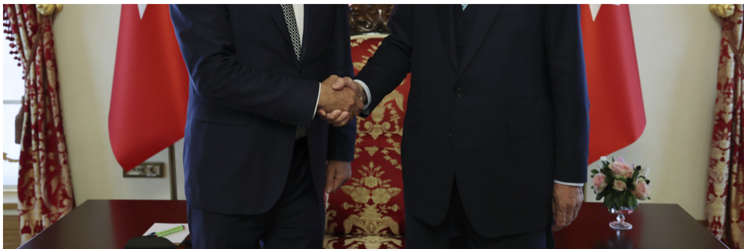
2023年5月19日，土耳其總統埃爾多安（Recep Tayyip Erdoğan）在土耳其伊斯坦堡辦公室會見總統大選第三位候選人錫南·奧甘（Sinan Ogan）。

而在政治和司法層面，埃爾多安曾在2017年更改憲法，讓他第三次競選總統；而在2019年的伊斯坦堡市長選舉中，土耳其選舉委員會因共和人民黨候選人僅以0.2%差距勝出重辦選舉。再加上根據土耳其憲法，法院須得到議會三分之二議席同意，才能對總統進行起訴，現時土耳其的法官基本上都由埃爾多安任命，由於缺乏司法系統制衡，所以他能更容易再次為個人權利更改憲法，或以票數差距太少為由推翻選舉結果。