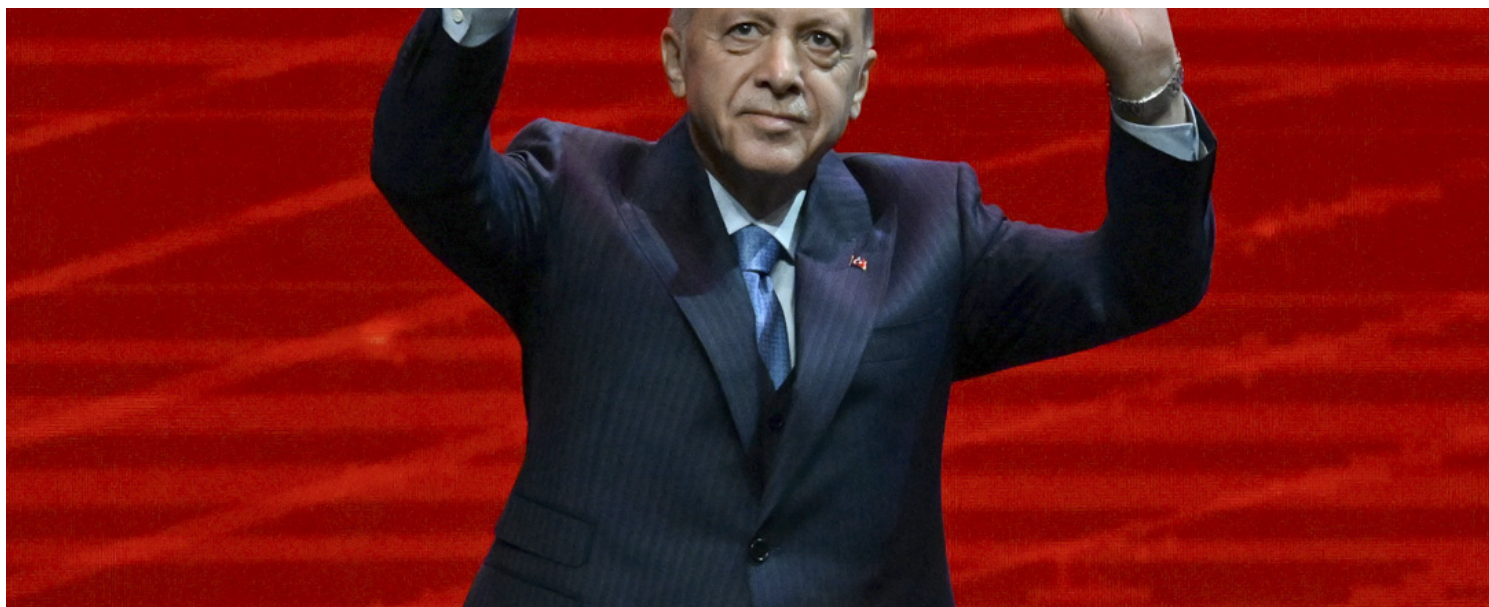
2023年5月22日，土耳其總統埃爾多安（Recep Tayyip Erdoğan）出席土耳其伊斯坦堡的選舉活動。