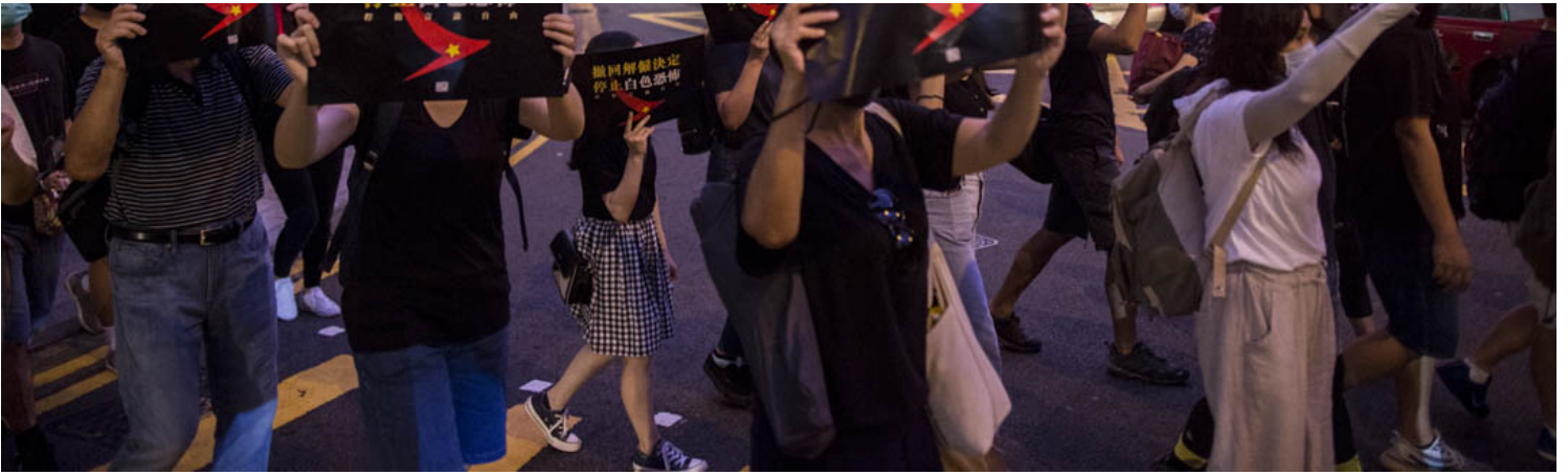
2019年8月28日，中環愛丁堡廣場舉行的國泰員工集會。