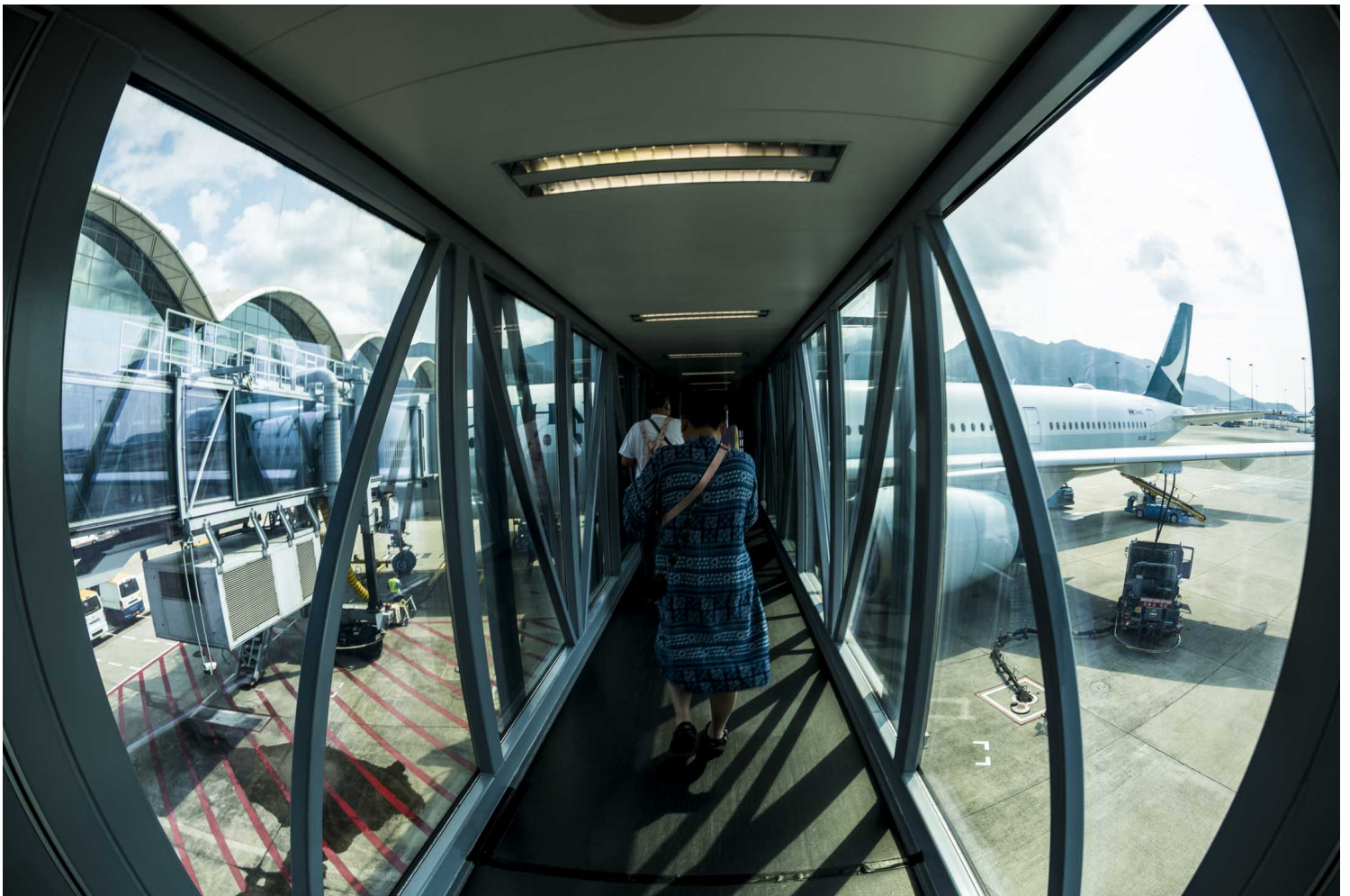
2023年2月13日，乘客在香港香港國際機場登上國泰航空的航班。

投訴者還強調，「很多人會覺得我多管閒事，激化矛盾，且這樣的投訴不會有任何作用。但我覺得做人應為正義發聲，哪怕我的行為能夠對歧視者產生一點點震懾，讓Ta們覺得歧視是有後果的，那就夠了。且對事不對人，哪裡都有好人與壞人。」