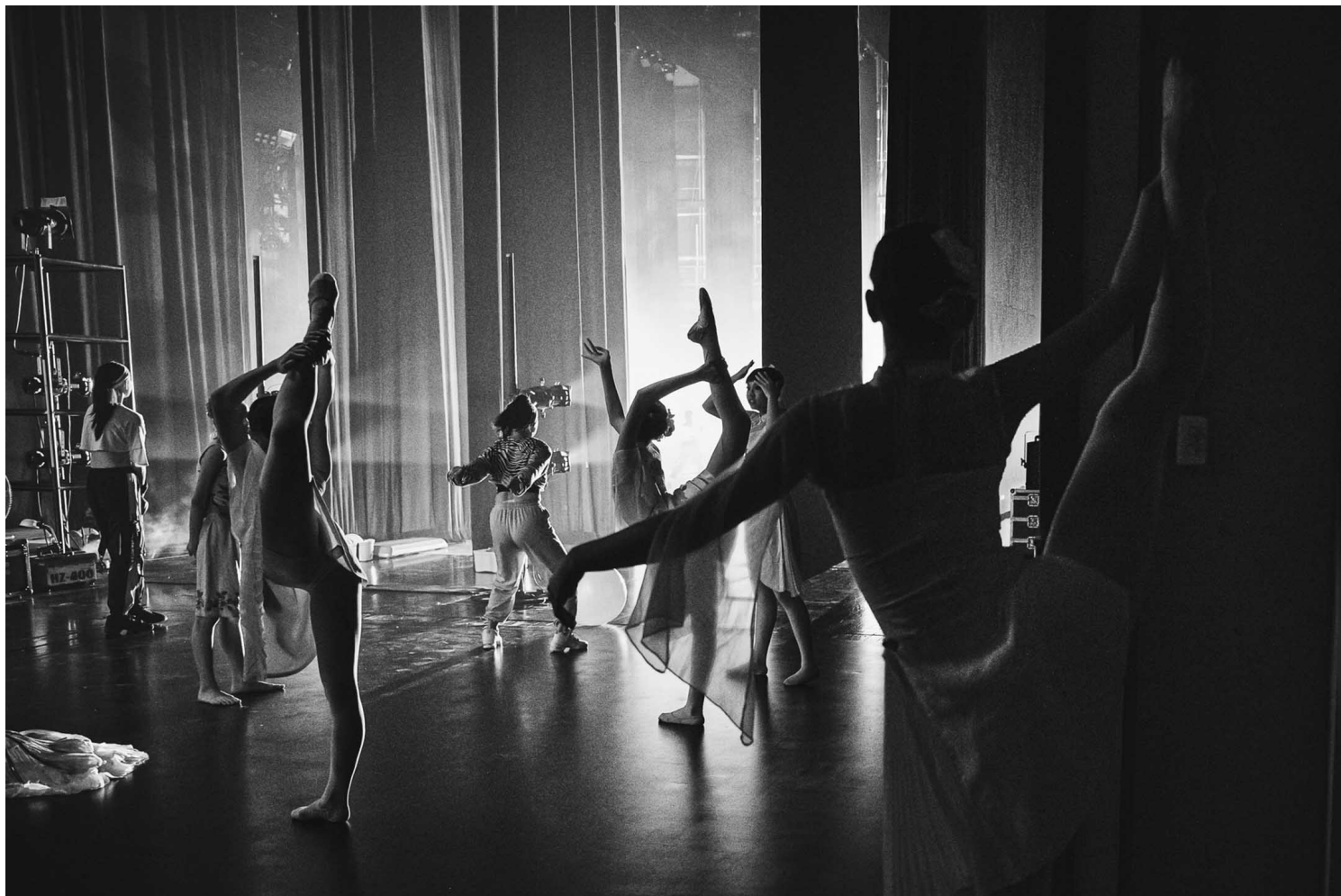
藝術與娛樂新聞優選。民族舞蹈的舞者們在上台演出前，於側台進行暖身，為正式演出做好準備。