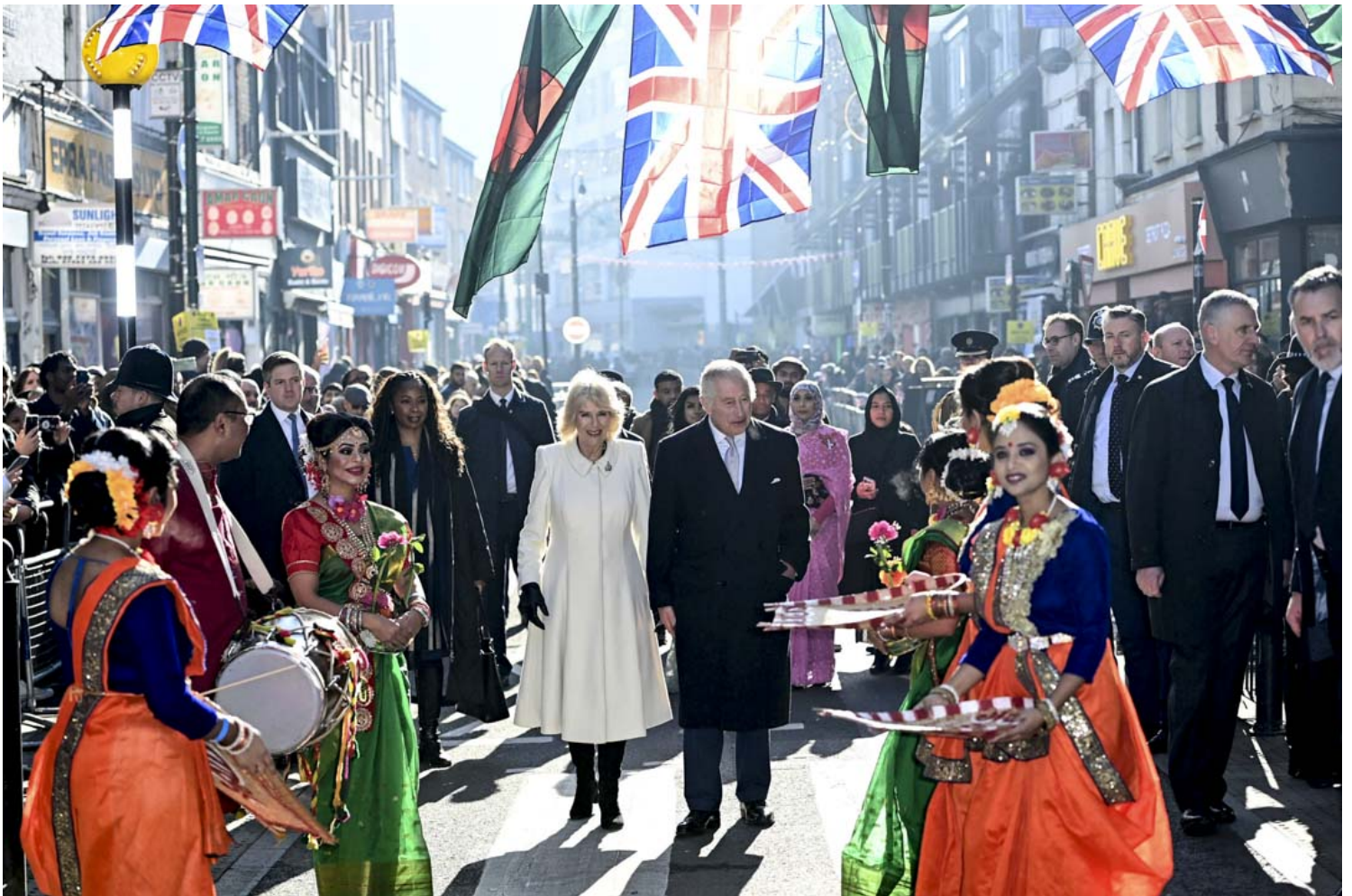
2023年2月8日，英國國王查理斯三世和皇后卡米拉訪問倫敦東部的布里克巷，與慈善機構和企業會面。

有一個光頭的中年男士在場下大聲問道：「甚麼時候？」在其後排的另一位中年男士馬上對光頭男士說：「我也想問這個。」對此，格雷姆沒有給予回應。場下詢問者立即搖了搖頭，似乎認為格雷姆有點盲目自信。