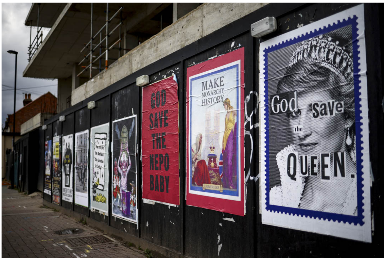
2023年4月24日，英國倫敦南部牆上的海報展示反君主制街頭藝術。

除了古老法律的束縛，對君主制或在任君主不滿的英國人也會因觸犯其他法律條文而面臨警方的抓捕。在過去的八個月裏，有兩個相關案件在英國社會造成爭議：其一發生在牛津，其二發生在約克。