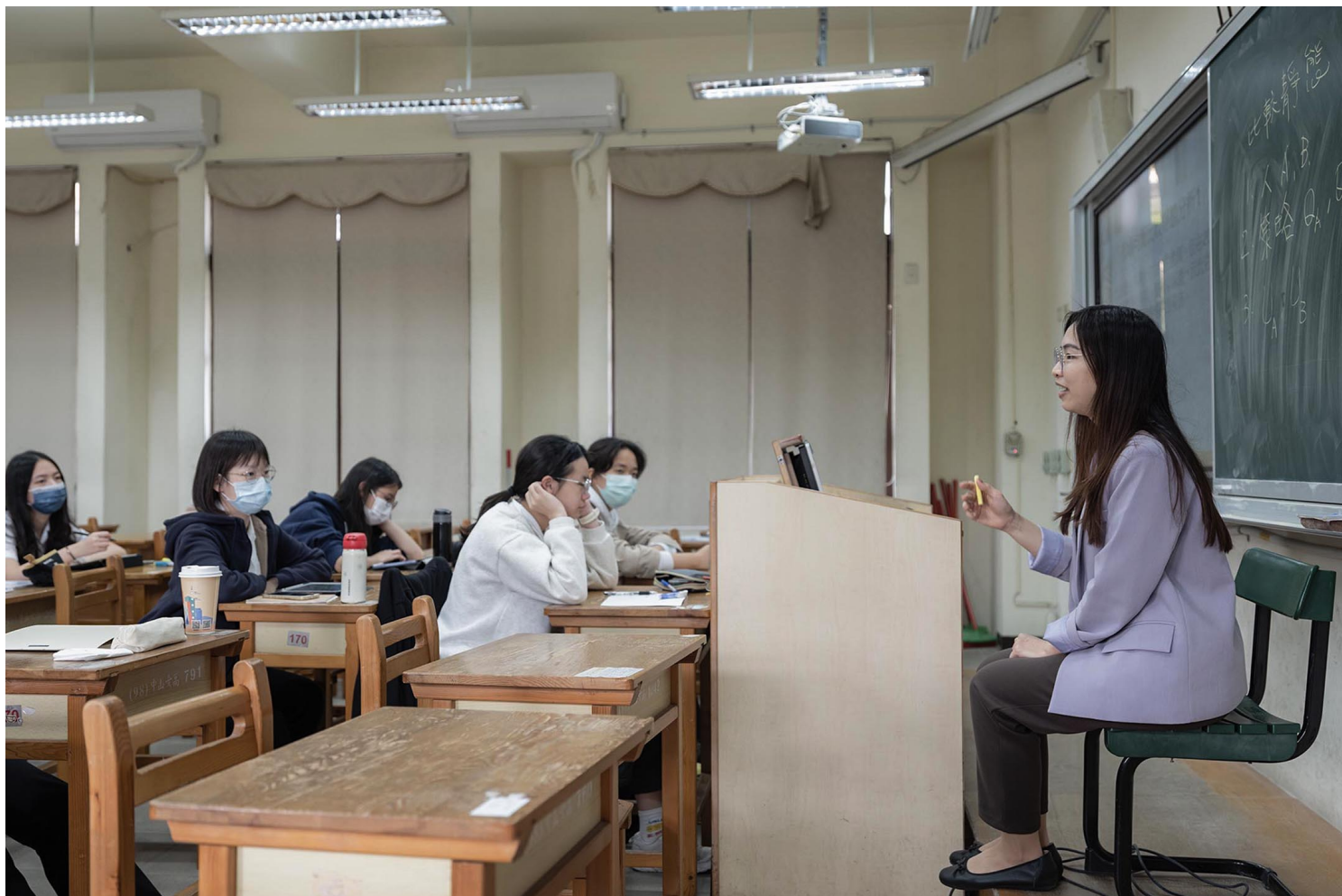
中山女高內的「人社班」。

除了學程和多元選修課程，108課綱之「社會科探究與實作」也提供學生進行田野調查、質性訪談和小論文寫作的機會。