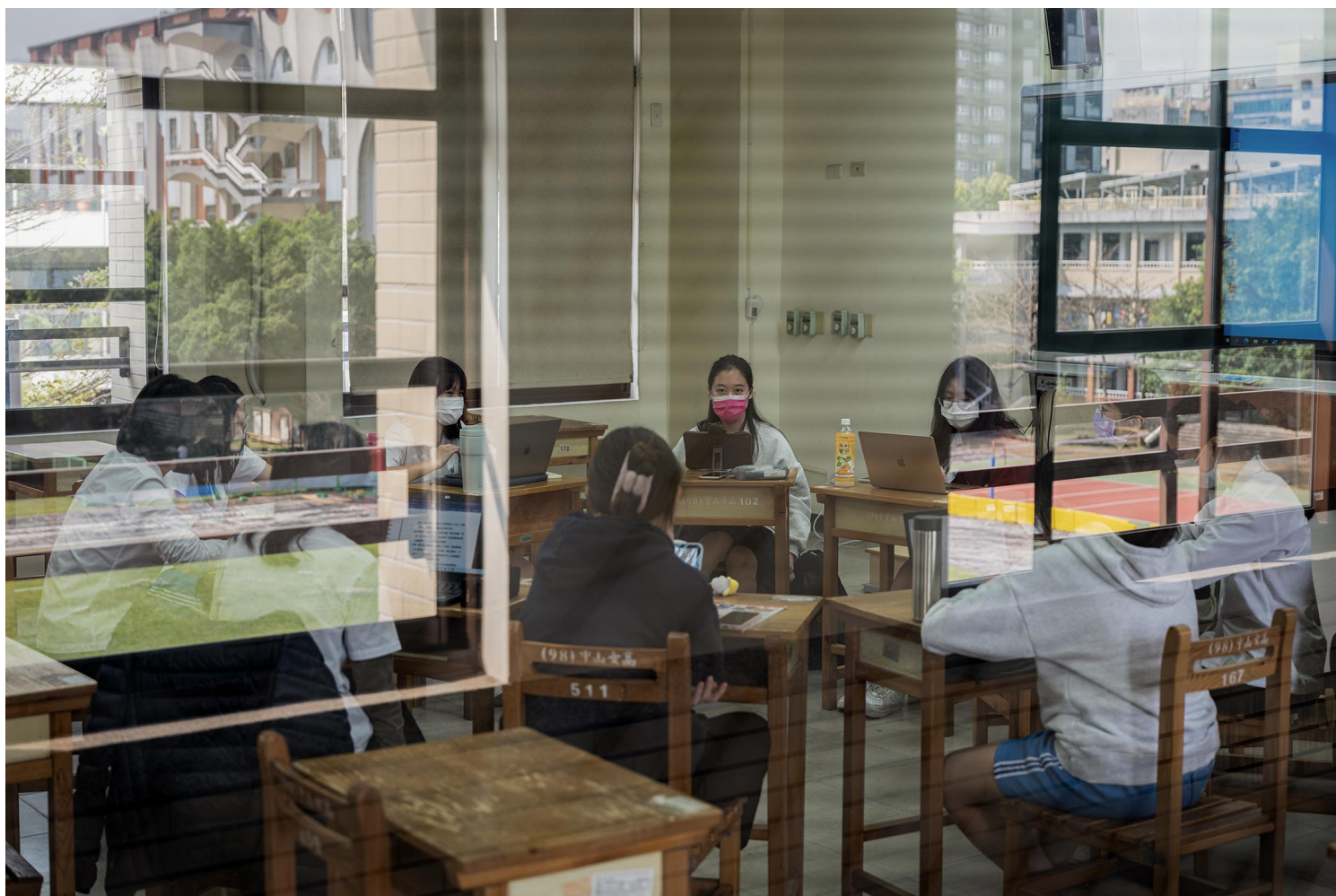
中山女高內的「人社班」。

「人社班是培養人文及社會科學人才的途徑之一，並非唯一途徑。即使沒有人社班，一樣可以給學生得到很好的學習。」