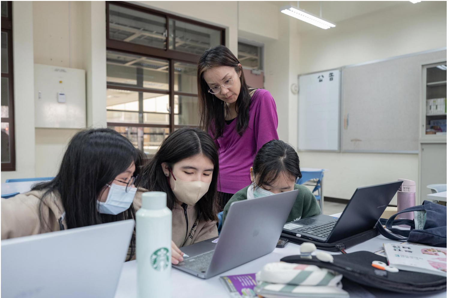
中山女高內的「人社班」。

興趣的基礎研究人才。為了讓更多人「正確地認識人文社會科學的學科」，人社班計畫將人文社會科學教育在高中紮根，培育人文社會科學基礎學術研究人才。與此同時，「計畫也希望人社班讓人文社會科學在高中教育形成一個典範，讓同個學校的老師們知道，原來人文社會科學可以這樣教！」