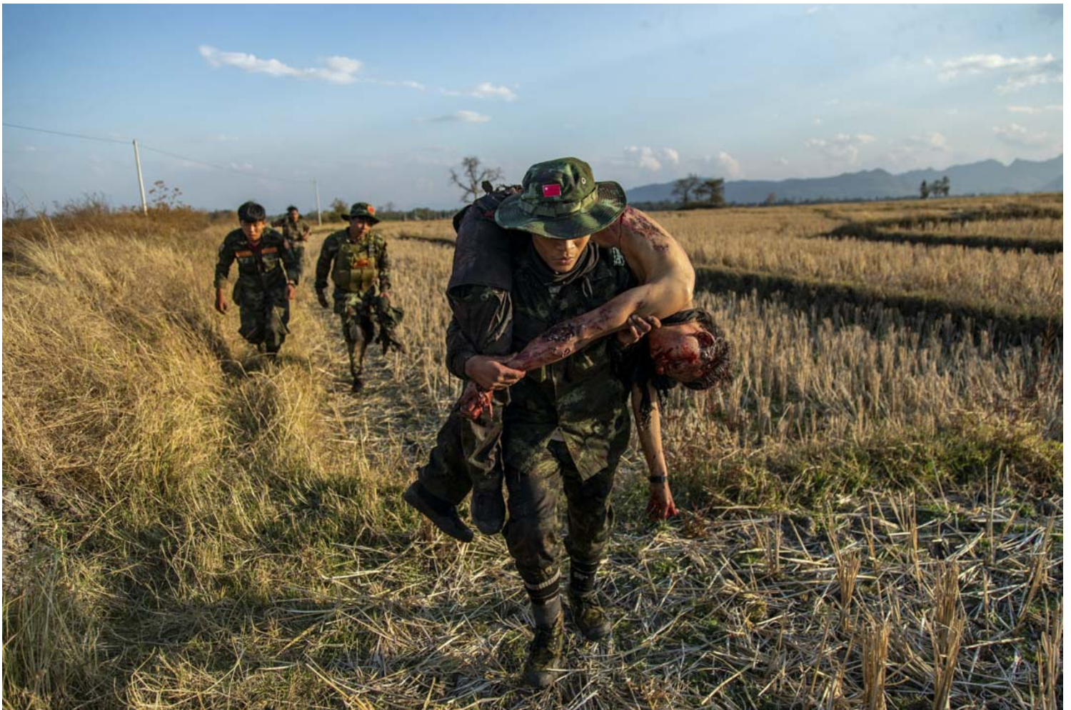
2022年2月21日，緬甸克耶邦，PDF戰士於戰後抬着陣亡的戰友遺體撤離戰場。