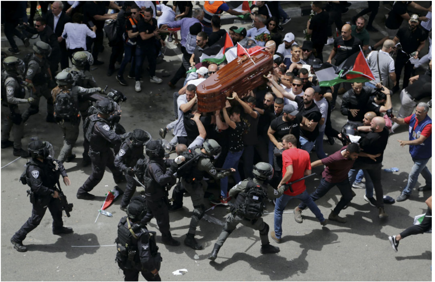
2022年5月13日，民眾在耶路撒冷為阿克利赫舉行葬禮，突然被以色列警察驅趕，現場爆發激烈衝突。

巴勒斯坦裔美籍資深記者阿克利赫（Abu Akleh）在採訪以巴衝突期間身亡，懷疑被以色列的狙擊手槍殺，以色列軍方首先否認，其後改為聲稱無法證實。