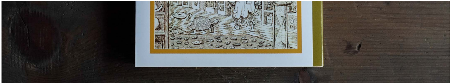
《もも》（默默）。