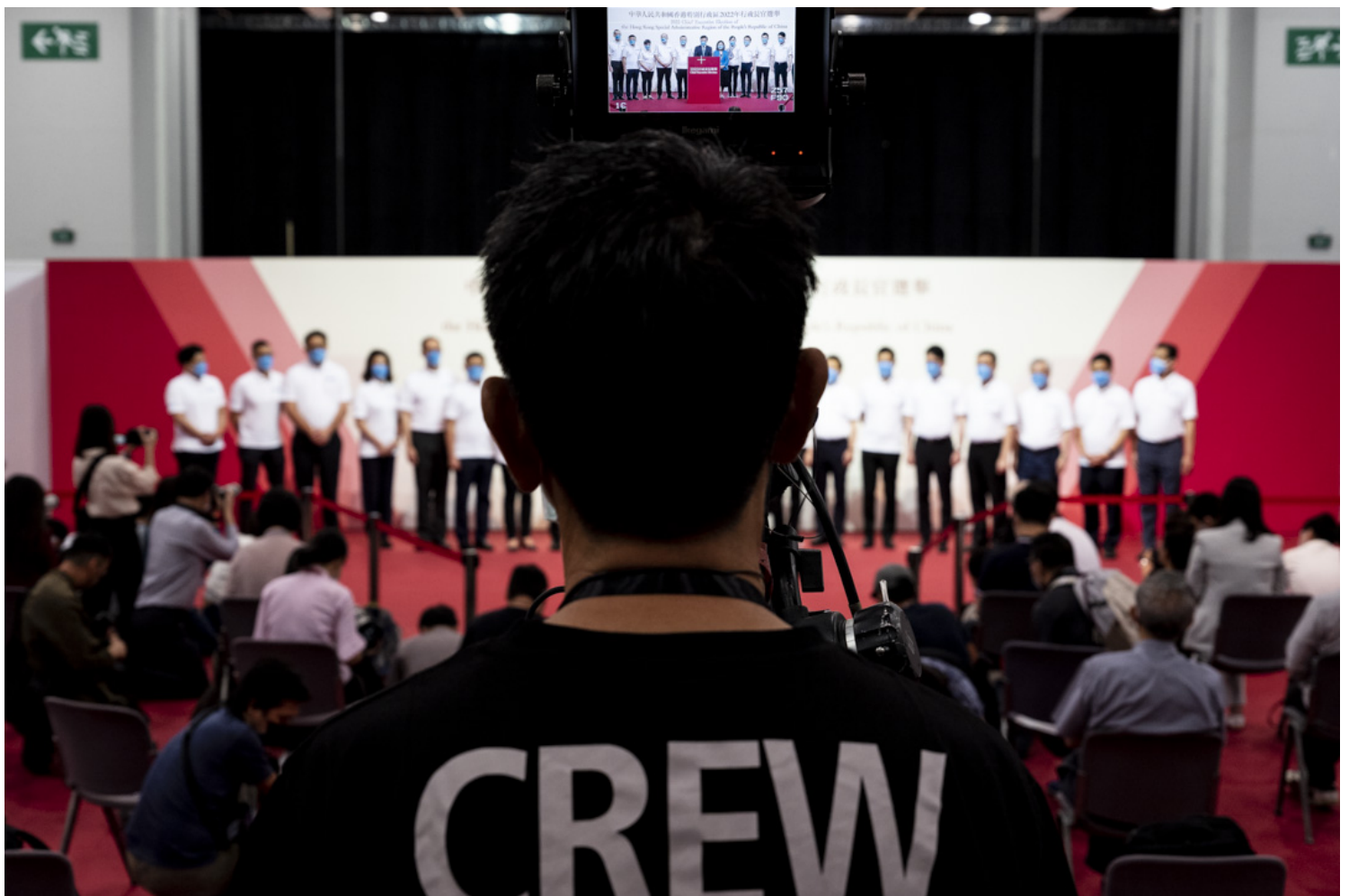
2022年5月8日，第六屆香港特別行政區行政長官選舉今日在灣仔會展舉行，唯一候選人李家超以1416票勝出特首選舉，當選香港下一屆行政長官，得票票數為歷屆最高。

在此脈絡下，香港政府提出規管假新聞、假訊息的立法意念，似乎與國安法下要求政府加強對媒體、網絡的指導、監督和管理，有着密切的關係。