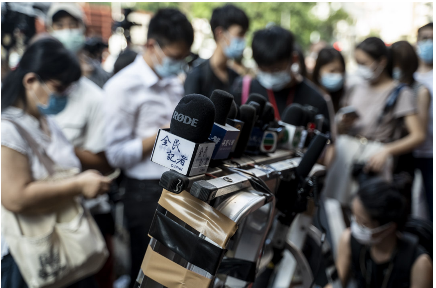
2021年9月25日，香港的記者在一個採訪現場等候。

根據傳媒報導，梁振英曾建議仿效台灣，將誹謗罪刑事化，並取消誹謗案須由陪審團裁決的制度，「容許政府部門例如警務處以及公職人員提訴，打官司費用由政府承擔。」