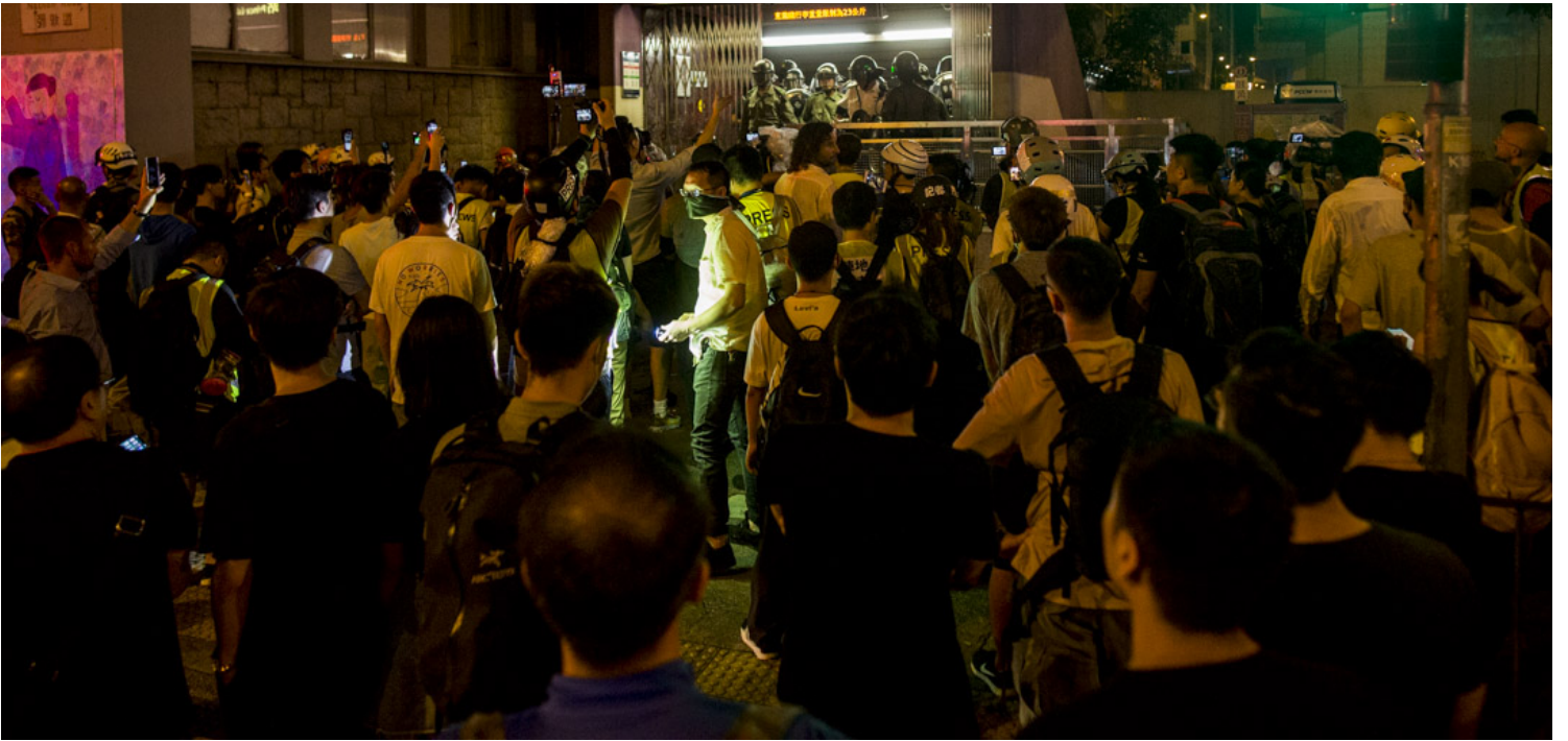
2019年8月31日，港鐵太子站發生防暴警察無差別的毆打乘客後，大量市民不滿並包圍太子站。