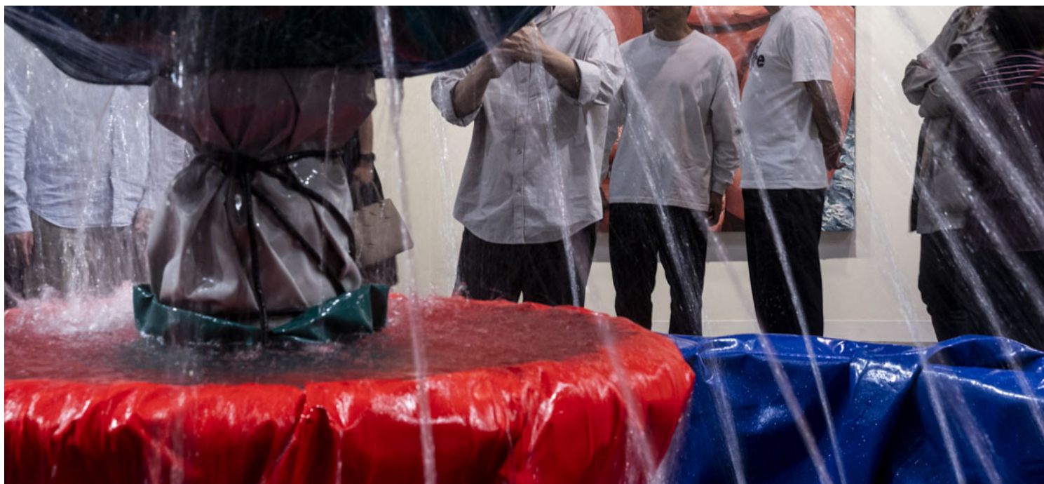
近藤亚树《Planets》。