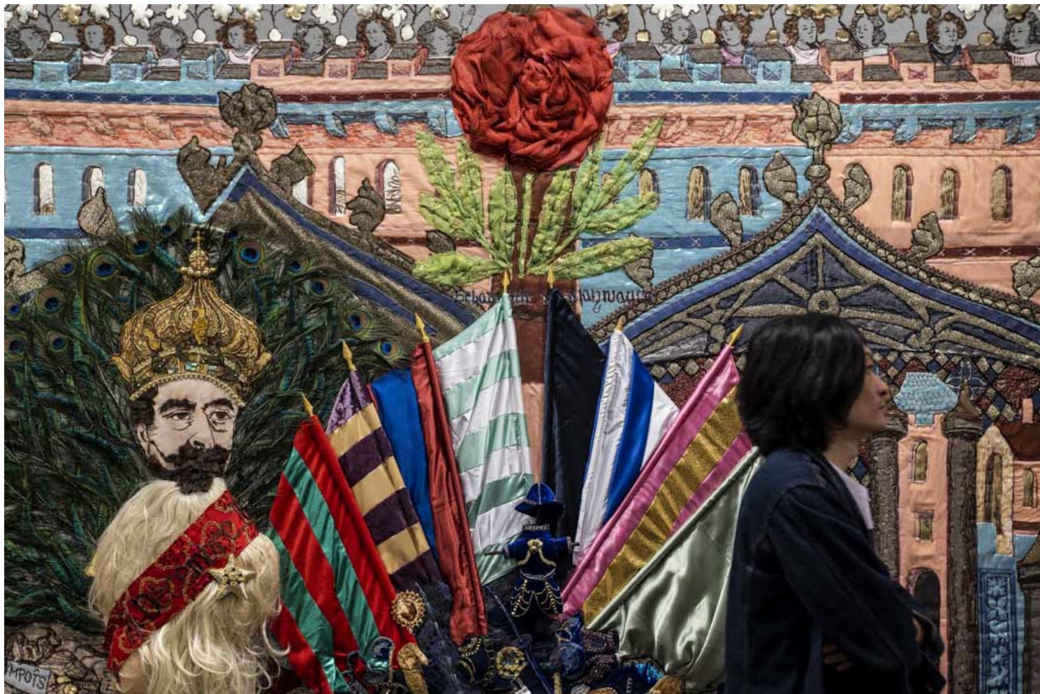
徐震《自我消费》。