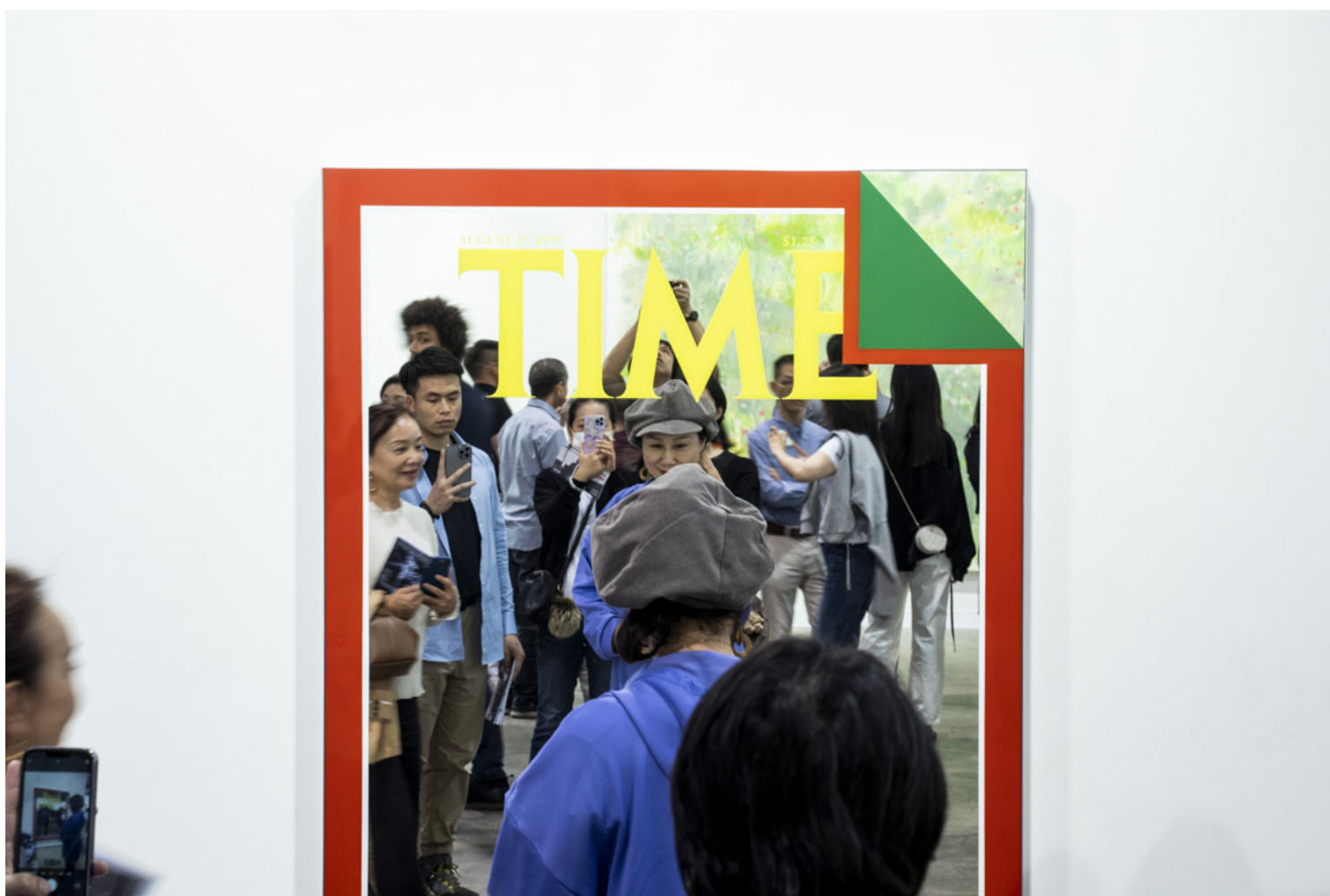
Mungo Thomson 的《Time Mirror》系列。