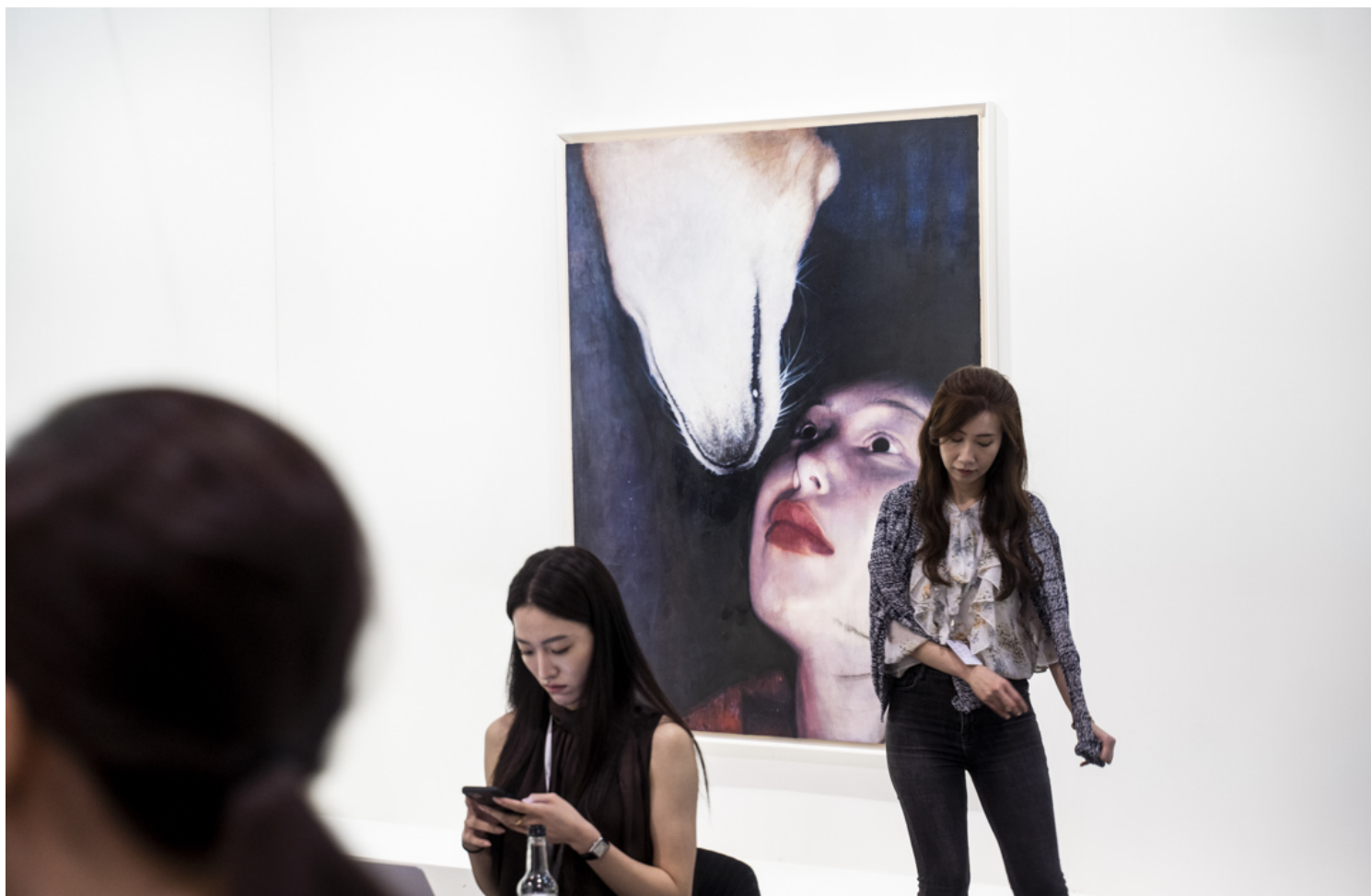
Moka Lee 《Chicken, 2023》。