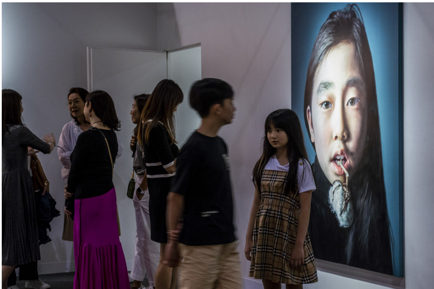
Kang Kang Hoon 《cotton》。摄：林振东/端传媒