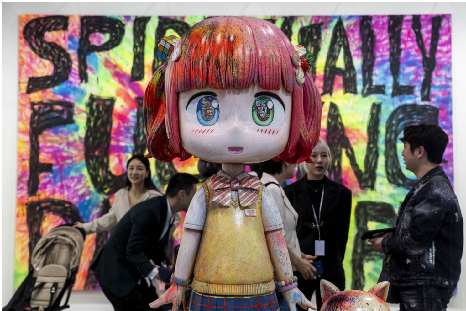
由日本艺术家村上隆执导与策划的东京画廊Kaikai Kiki展出多个雕塑作品，包括艺术家Mr. 的萌少女雕塑。

过去三年，戴著口罩、保持社区距离的参观常态，于今年终于解放。场内不少艺术创作都是以不同形态描写人类五官样貌神态的作品，与熙来攘往的观众互相映衬，再度带来久违的风景。