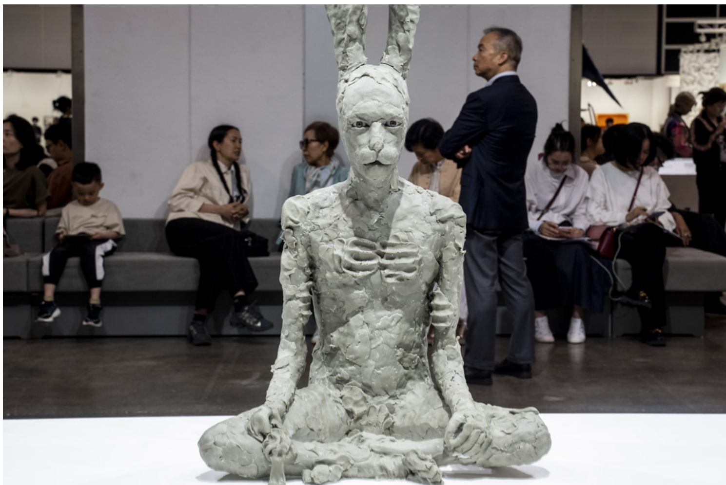
David Altmejd 《向量》。