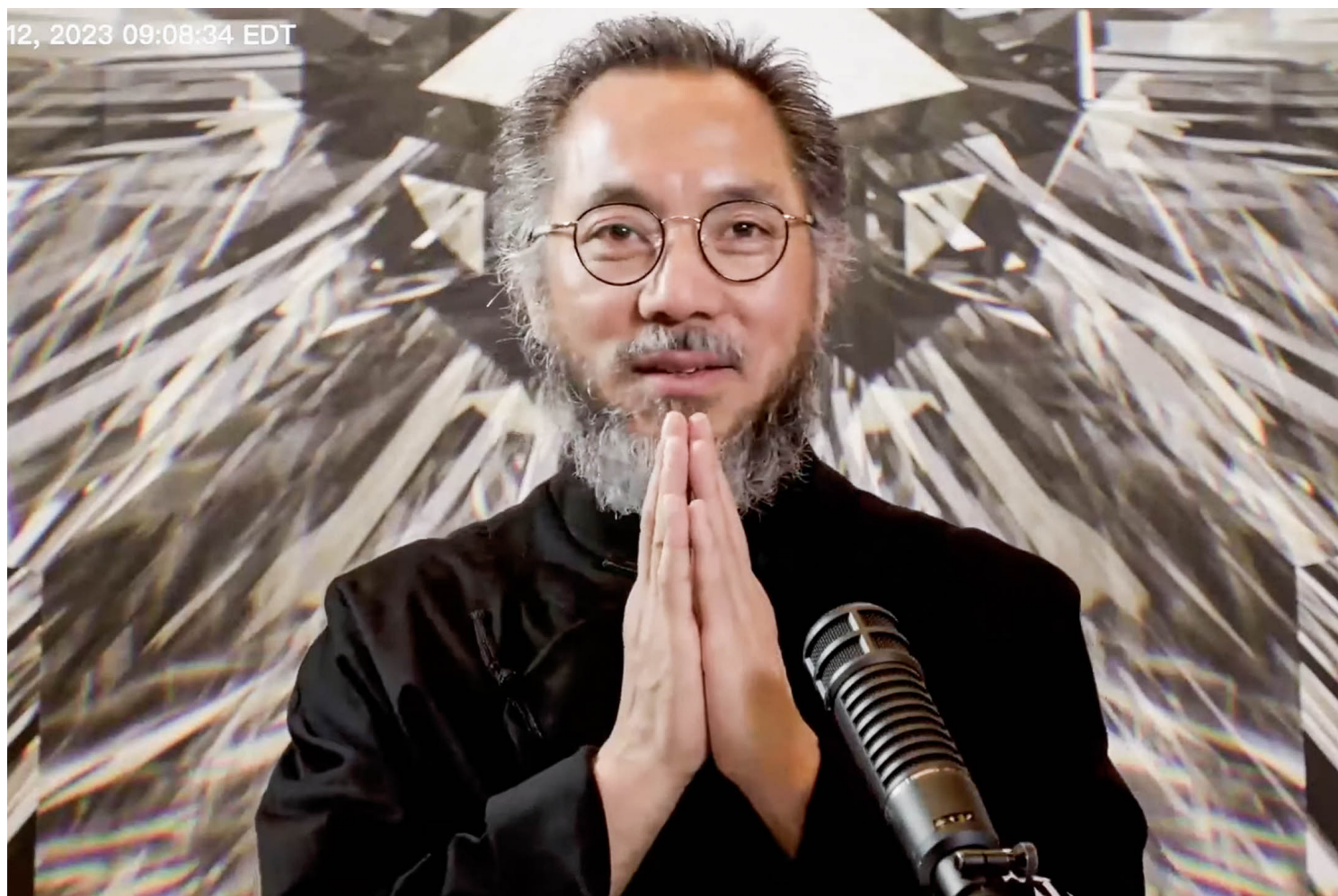
2023年3月12日，郭文贵的直播。图：影片截图

中国商人郭文贵于周三被捕，他被控策划10亿美元欺诈案。他因大爆中国政府腐败行为受关注，后来他与特朗普亲信创办媒体公司。