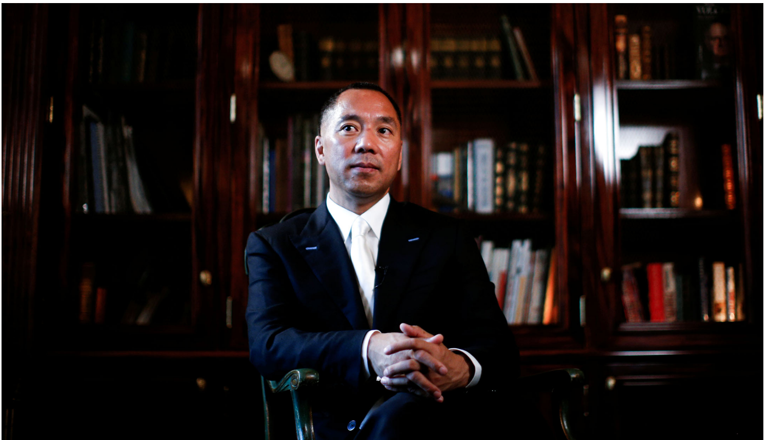
2017年4月30日，纽约，商人郭文贵。

近年来，郭文贵涉足音乐和时尚领域。2020年郭文贵推出名为“ Take Down the CCP ”（推翻共产党）的歌曲，随后发布了一个音乐影片，他在影片中抽著雪茄，开著似乎现在已被没收的兰博基尼。在他的G-fashion 网站 上，毛线帽的价格为715美元，棉质拉链Polo衫的价格为1,265美元。