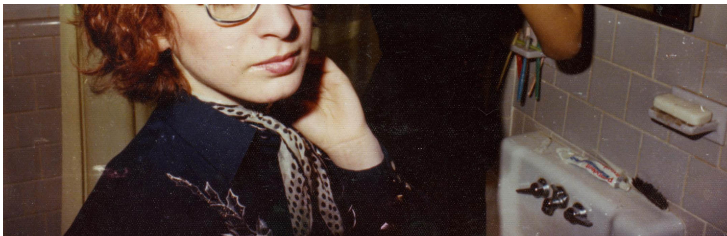
《所有的美丽与血泪》剧照。