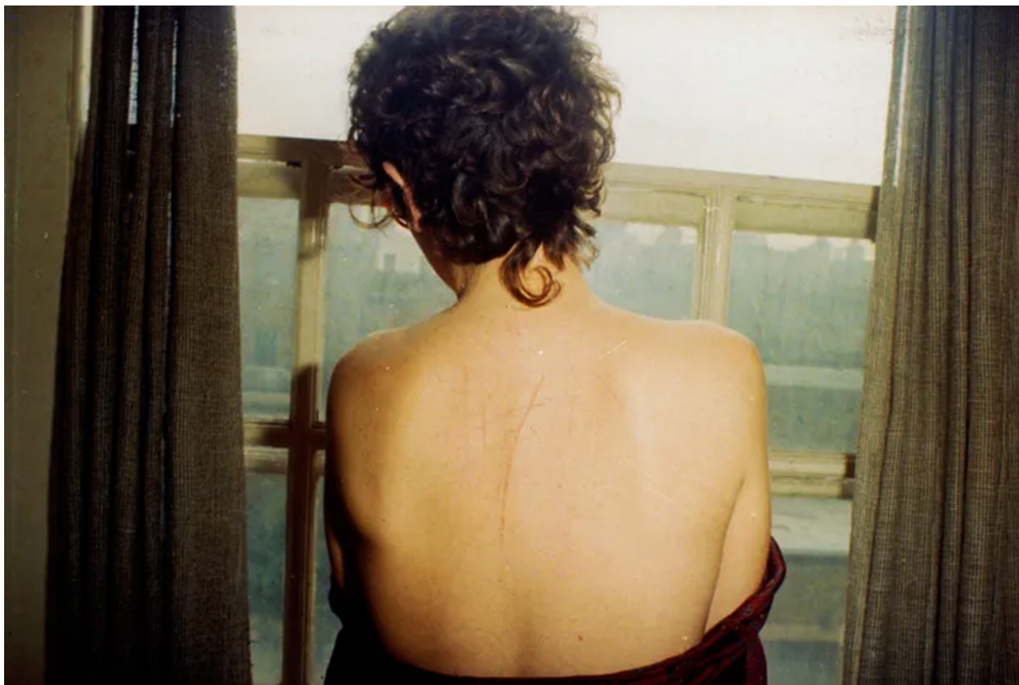
电影《所有的美丽与血泪》。

只看提名名单就看全去年的精彩电影了吗？这一份片单汇集六部各有特点的女性创作者作品，千万别错过。