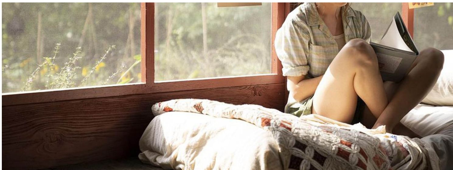
《沼泽谋杀案》剧照。