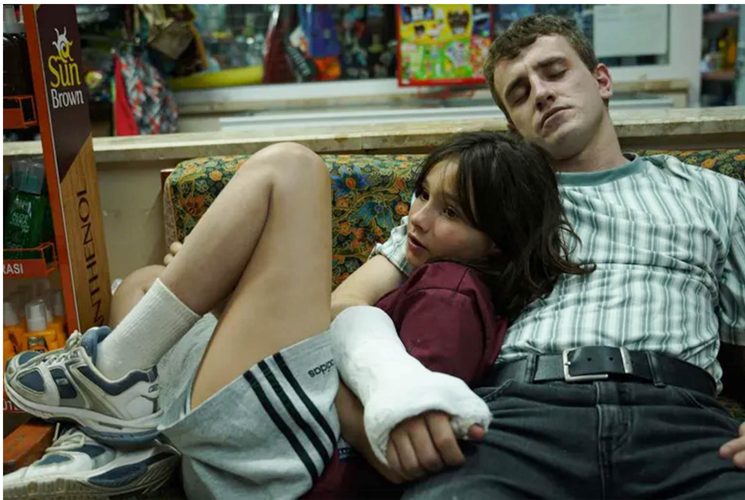
《日丽》剧照。

另外，像《她有话要说》、《沼泽谋杀案》这样的女性导演作品，虽然并未在颁奖季受到瞩目，但上映时也很有话题性。笔者在此将2022里六部各有特点的女性创作者作品，汇整为以下三条轴线：惊艳处女作、女性的抗争、女性与罪案。其中有些，出现在了今年的奥斯卡入围名单中，有些则因议题的重要性或较高的票房，引发了讨论热度。