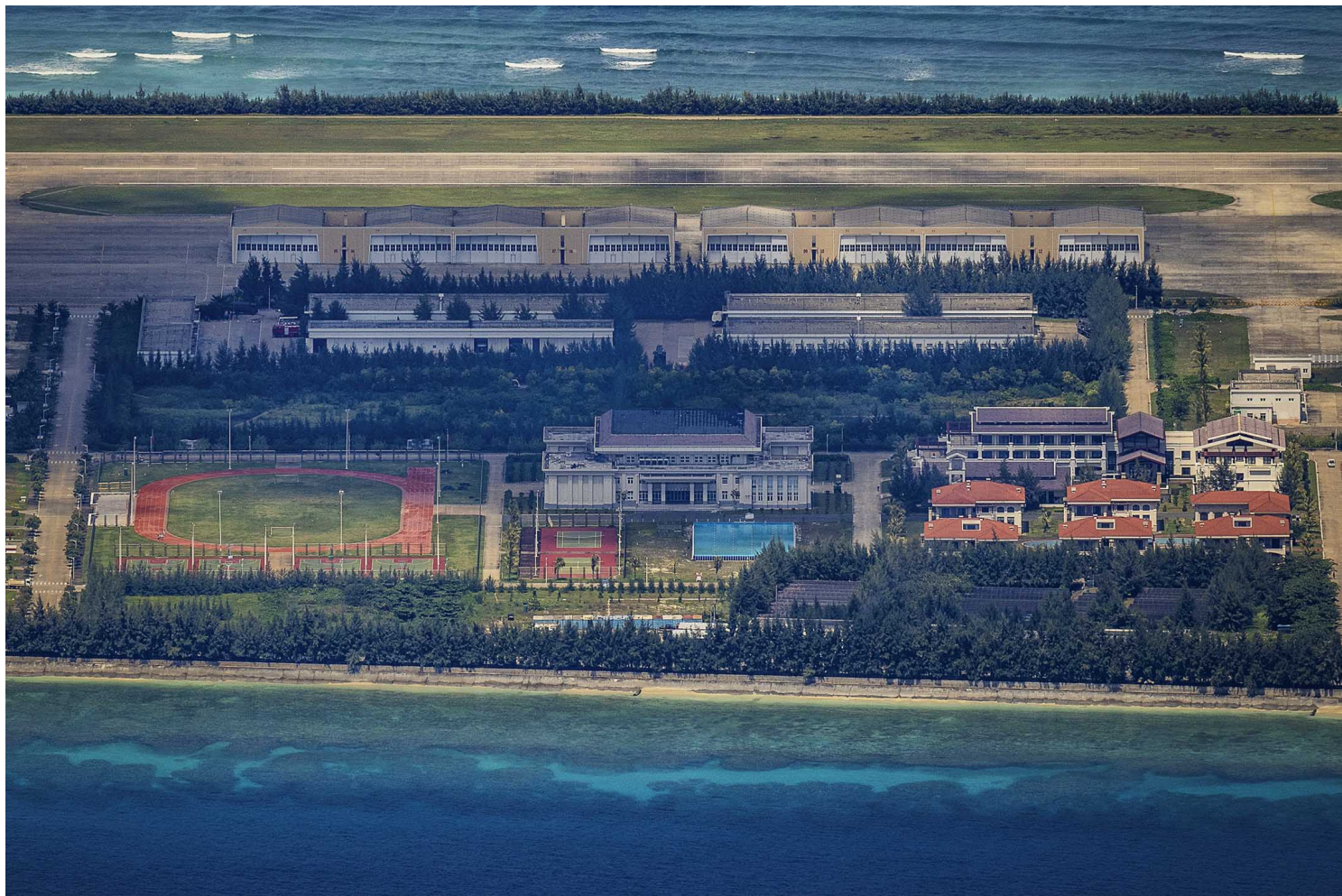
2022年10月25日，中国政府在南沙群岛永暑礁建造的人工岛，岛上可以看到机场、建筑物、娱乐设施等等。

舰，迟早也会率领另一支舰队，穿越巴士海峡，前往菲律宾海与辽宁号会师，组成双航母战斗群。两艘航空母舰才能有效执行在大洋上的作战任务，就算其中一艘出现战损，在空中的舰载机依然能在另一艘上降落，不会全军覆没。在菲律宾海上的中国双航母战斗群，将可牵制美军在这个地区的行动，阻止美国的航空母舰战斗群介入台海冲突。接下来战力更强的福建号航空母舰服役后，这种情势将会更为明显。