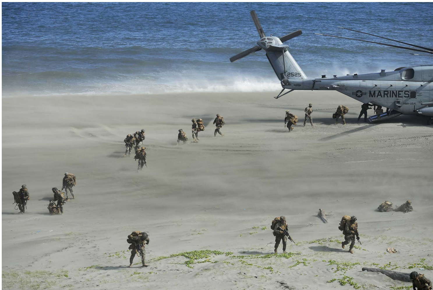
2022年3月31日，菲律宾卡加延省，美国海军陆战队在年度美菲联合战争演习中。

日本与菲律宾的态度将左右美国介入的意愿与能力；台湾有事等于日本有事，几乎已成共识，剩下的变数就是菲律宾。