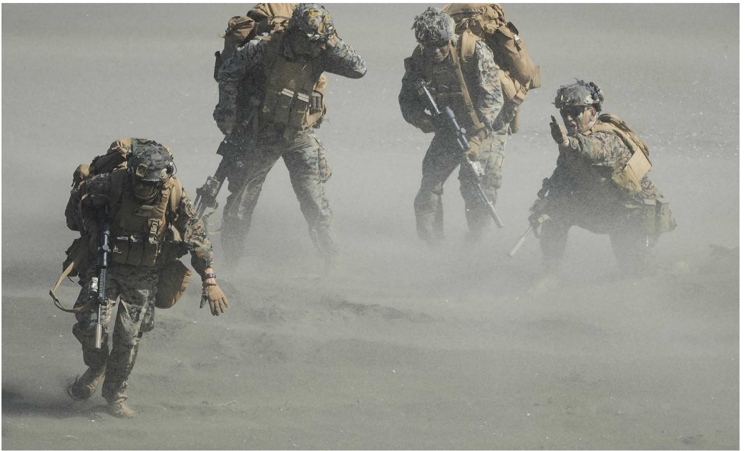
2022年3月31日，菲律宾北部卡加延省，美国海军陆战队在年度美菲联合战争演习中跑到他们的位置。

菲律宾在承平时期，不只能让美军监视巴士海峡与南海，更重要的是可以控制菲律宾海。这片位于日本以南、台湾与菲律宾以东、关岛以西的海域，介于第一岛链与第二岛链之间，以宫古海峡连结东海，巴士海峡连结南海，战略位置极为重要。