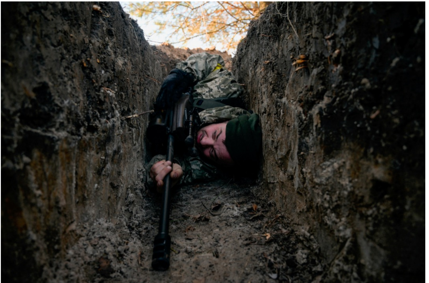
2022年3月10日，烏克蘭首都基輔近郊小鎮德米迪夫（Demydiv），一名烏軍士兵在戰壕裏躲避俄軍直升機的空襲。該照片攝影師於同年4月1日在鄰近小鎮被發現死亡，調查稱他遭俄軍槍殺。