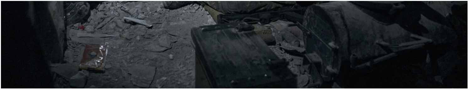
2023年2月11日，烏克蘭烏克蘭頓涅茨克州巴赫穆特市（Bakhmut），烏軍亞速營士兵在一個防空洞裏休息。