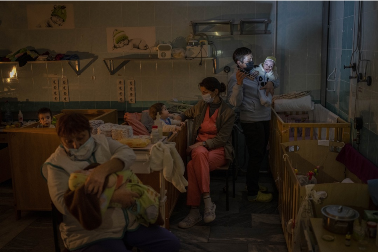
2022年11月22日，烏克蘭赫爾松，數名醫院員工在停了電的醫院嬰兒病房內照顧幼嬰。