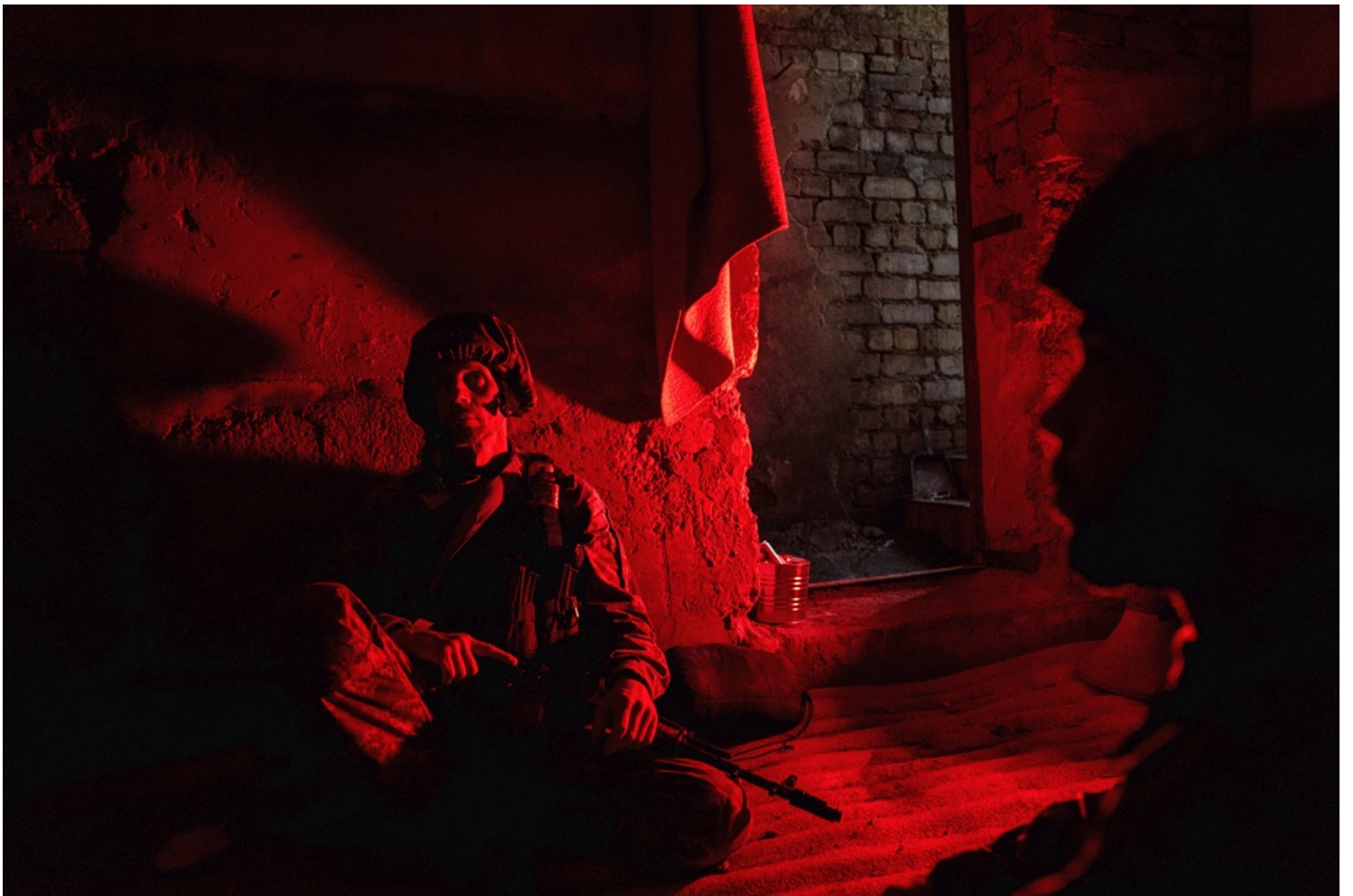
2022年7月12日，烏克蘭哈爾科夫，數名士兵在一個防空洞內找掩護。