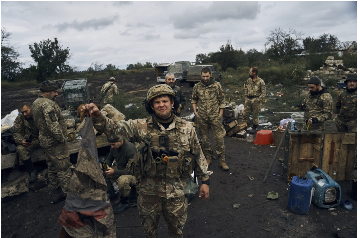
2022年9月13日，烏克蘭城市伊久姆 (Izium)，擊退佔據城市的俄軍後，一名烏克蘭士兵拿起一幅破爛的俄羅斯旗。