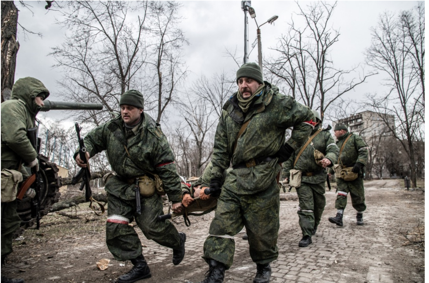
2022年3月27日，烏克蘭馬里烏波爾，親俄武裝組織用擔架抬走一名受傷的士兵。