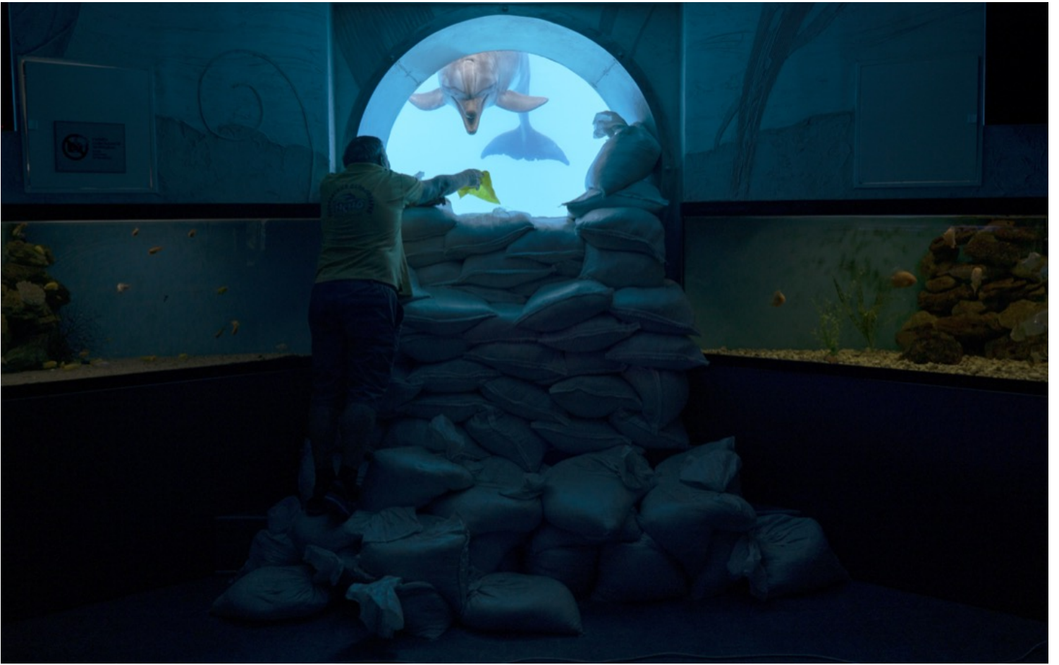
2022年9月21日，烏克蘭哈爾科夫，67歲昆蟲學家Yurii Voitenko在海豚館內與一隻海豚玩耍。魚缸旁堆滿沙包，以防戰爭造成損毀。