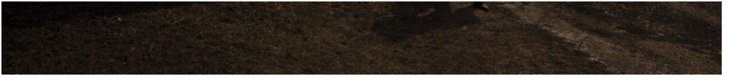
2022年3月25日，烏克蘭哈爾科夫，一名居民從一個著火的貨倉中取回個人物品。