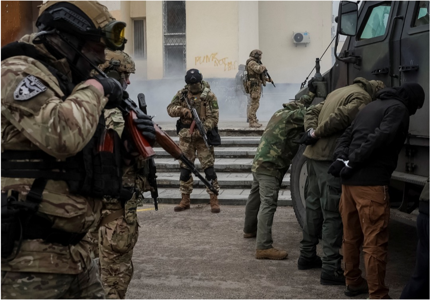
2023年2月11日，烏克蘭西部里夫內州（Rivne），烏軍士兵、邊防部隊和安全部隊成員參與共同軍事演習。