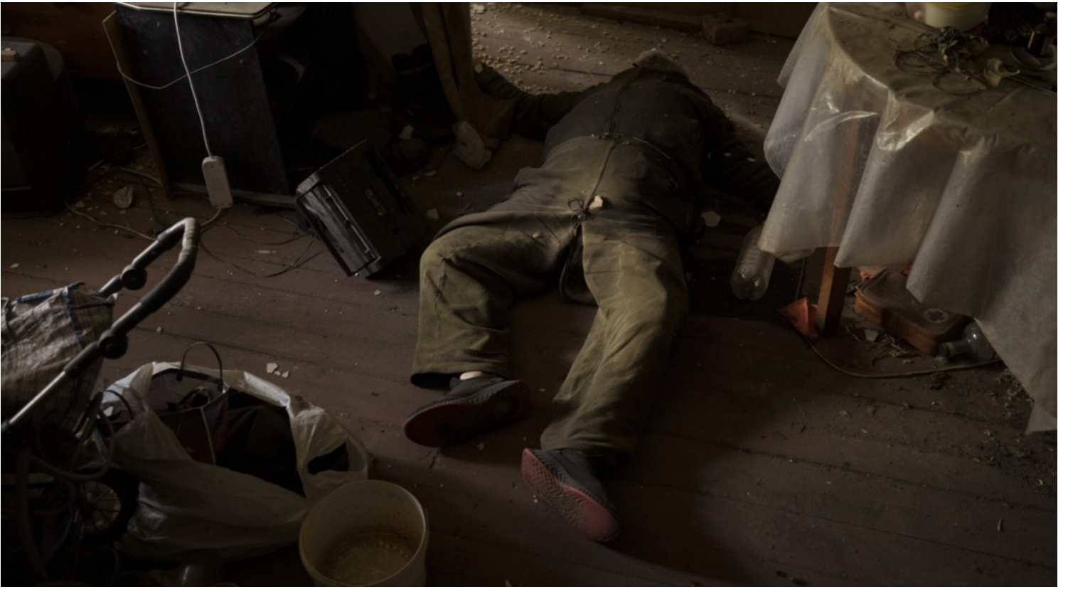
2022年4月30日，烏克蘭哈爾科夫，一名居民被俄軍炮轟炸死，遺體躺在房子裏。