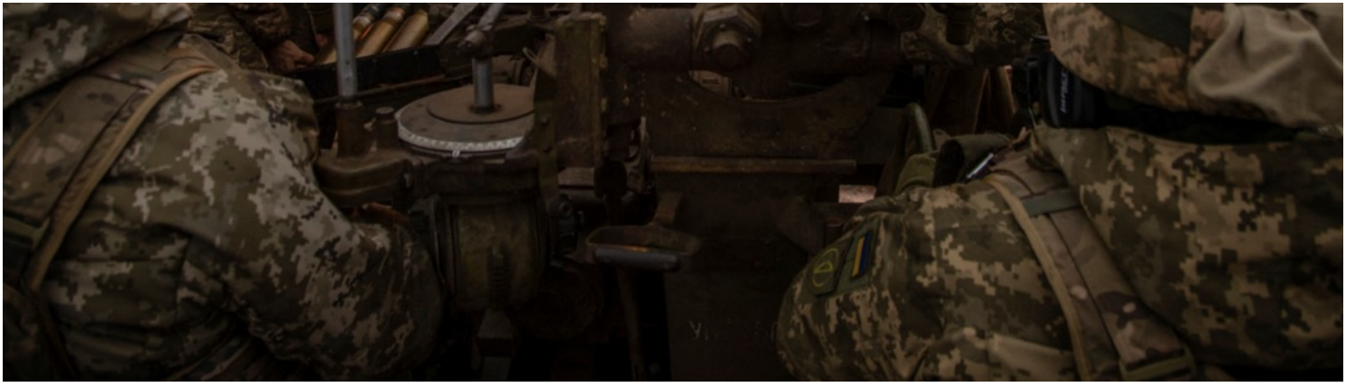
2023年1月15日，烏克蘭頓涅茨克州巴赫穆特市（Bakhmut），烏軍向俄軍戰線方向發射高射砲。