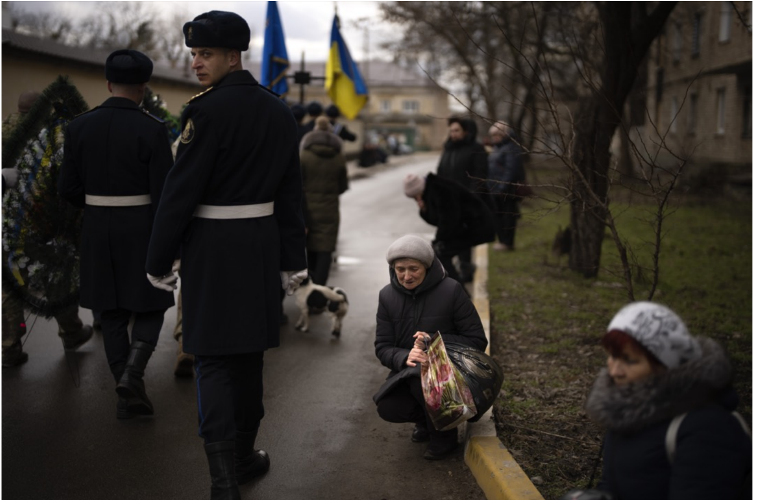
2023年2月14日，烏克蘭基輔近郊，一名女子參加一名烏軍士兵的喪禮期間跪地哀嚎。