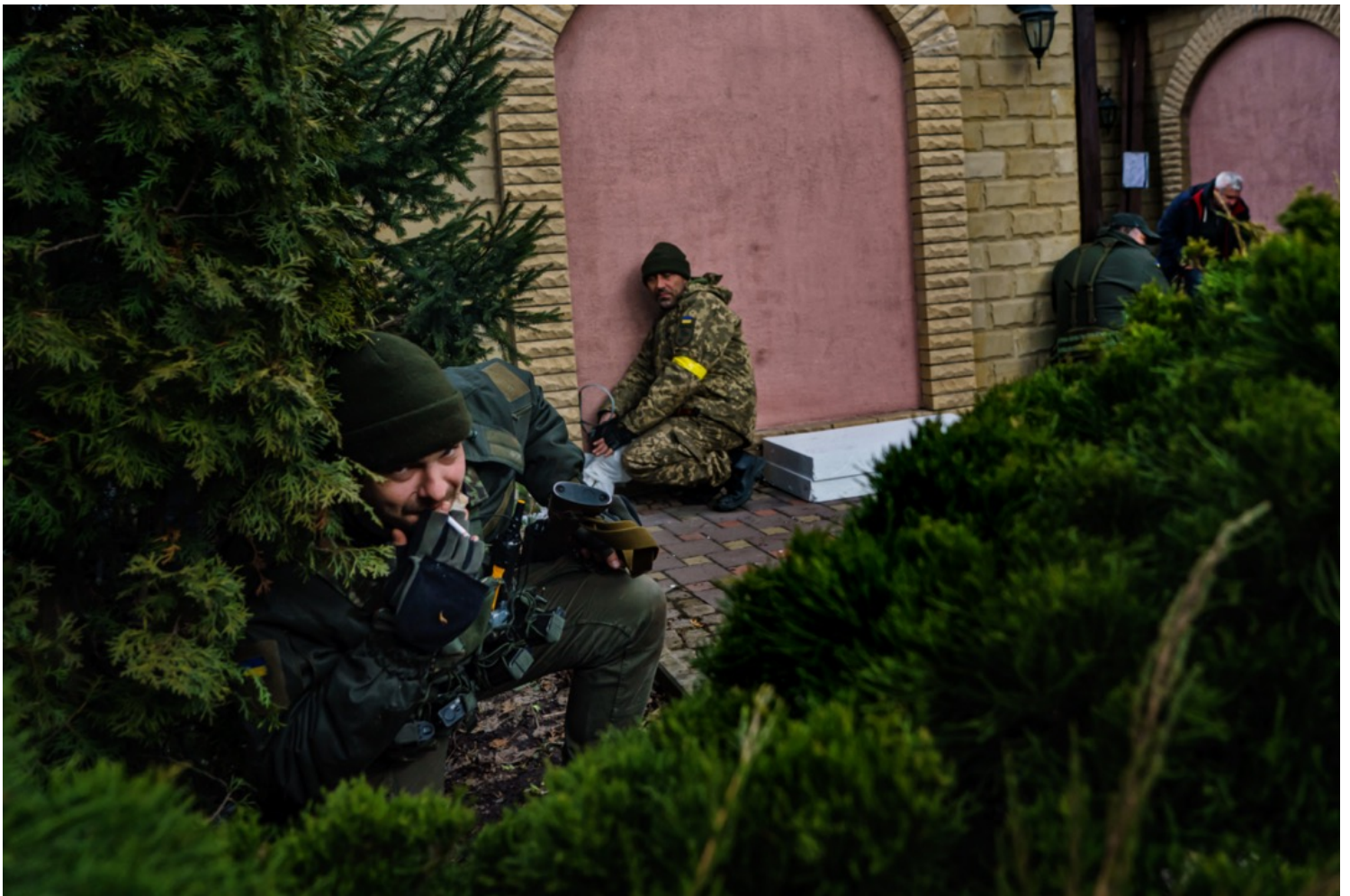
2022年3月6日，烏克蘭首都基輔近郊小鎮伊爾平，烏軍士兵在俄軍炮彈攻勢下找掩護。