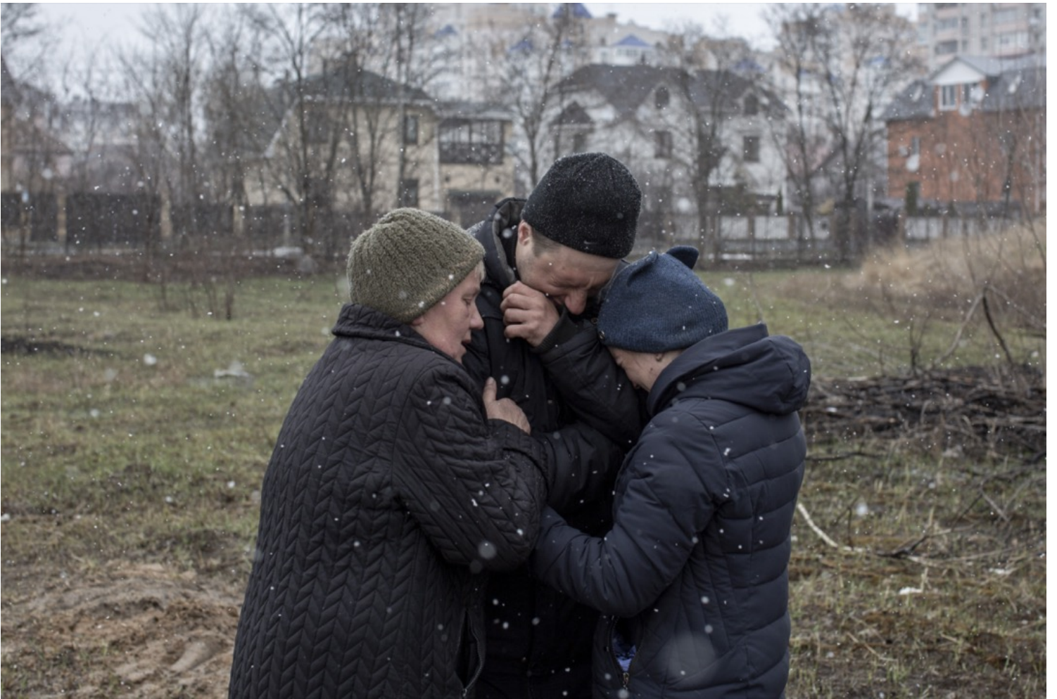
2022年4月3日，烏克蘭首都基輔近郊小鎮布查，數名居民在一個亂葬崗旁為一名失蹤的親人感到憂心。