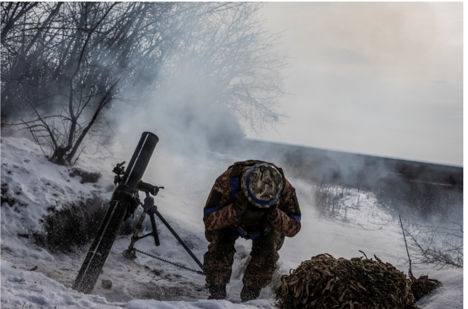
2023年2月7日，烏克蘭東部頓涅茨克，一名烏軍士兵向俄軍戰線發射迫擊炮。