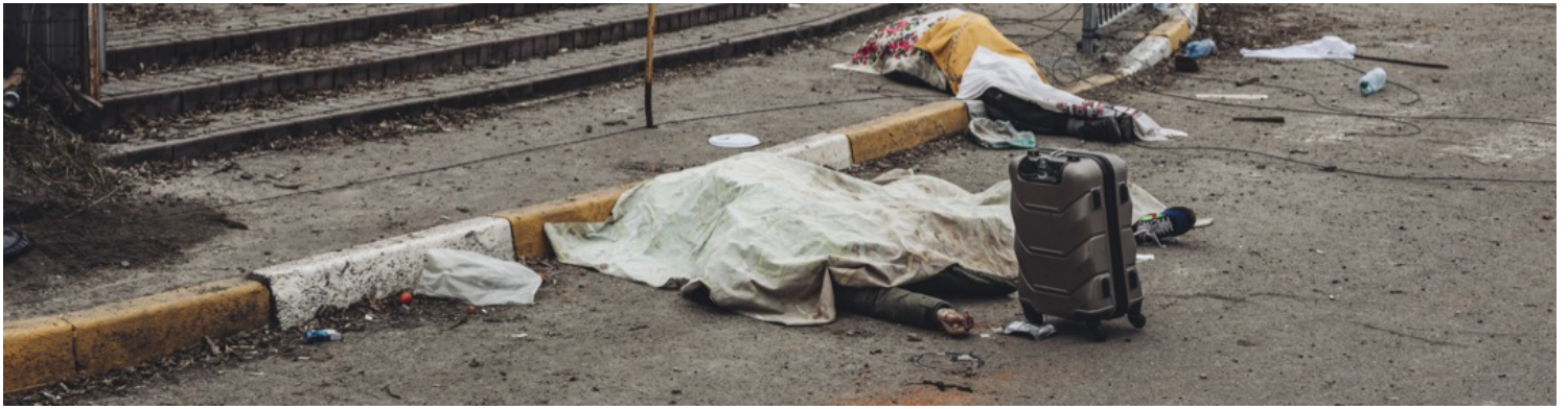
2022年3月6日，烏克蘭首都基輔近郊小鎮伊爾平，數名逃難中的當地居民被俄軍炮轟炸死。