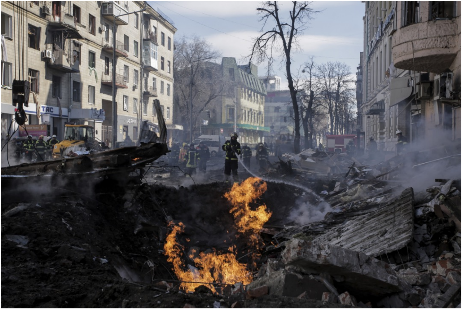
2022年3月14日，烏克蘭哈爾科夫，俄軍炮彈擊中民居引發大火，一名消防員在撲救。