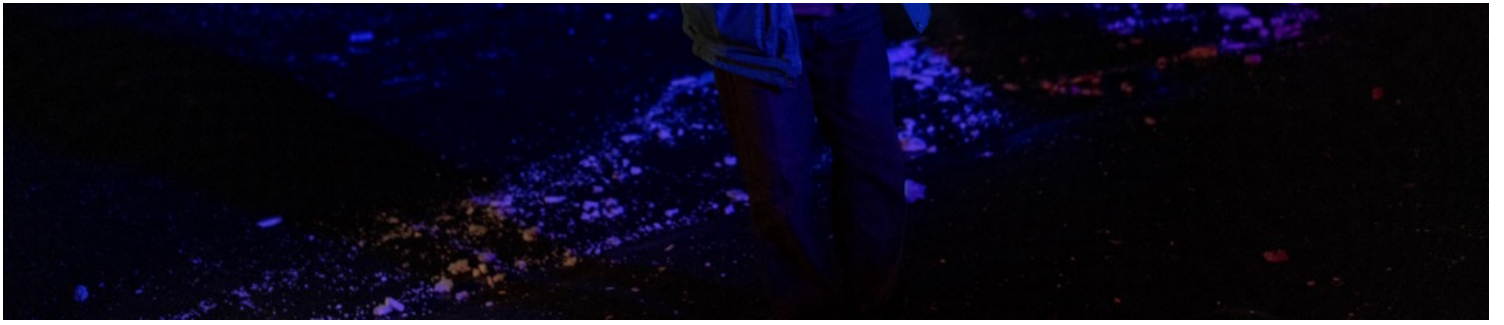
2022年11月24日，烏克蘭南部港口城市赫爾松，一名當地老翁抱著寵物狗走過瓦礫。