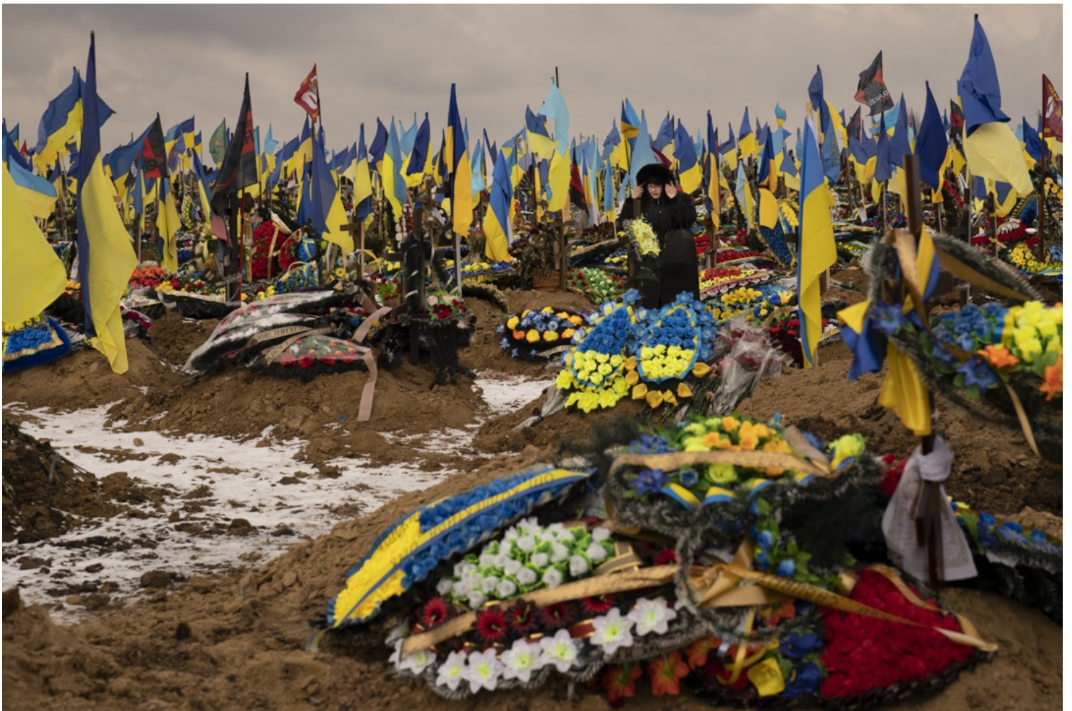
2023年2月16日，烏克蘭哈爾科夫，一名女子在一個陣亡士兵墓地中走過。