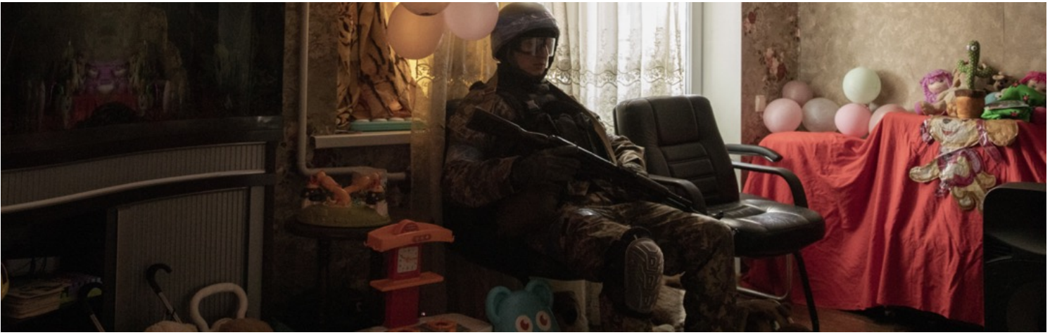
2022年3月28日，烏克蘭首都基輔東部戰線，一名烏克蘭志願軍坐在一個當地居民的房子裏。