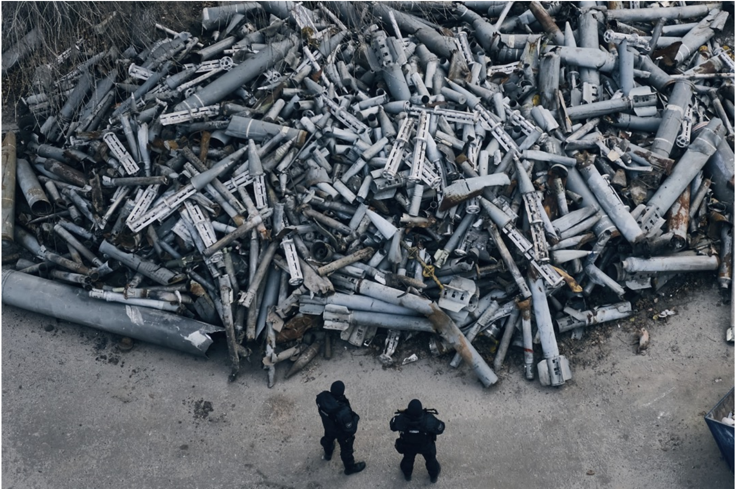
2022年12月3日，烏克蘭哈爾科夫，兩名警員在視察一堆俄軍炮彈殼。