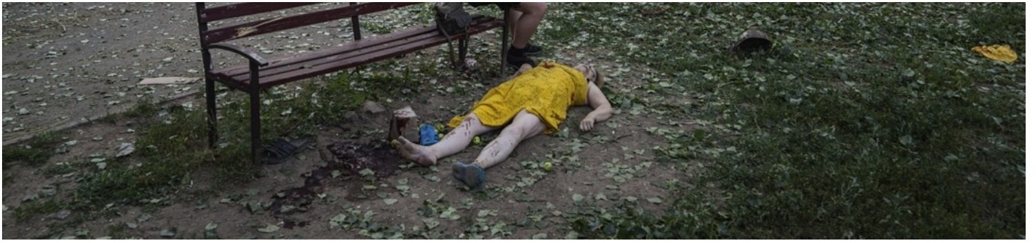
2022年7月7日，烏克蘭哈爾科夫，一名男子坐在一名女子的遺體旁哭泣。