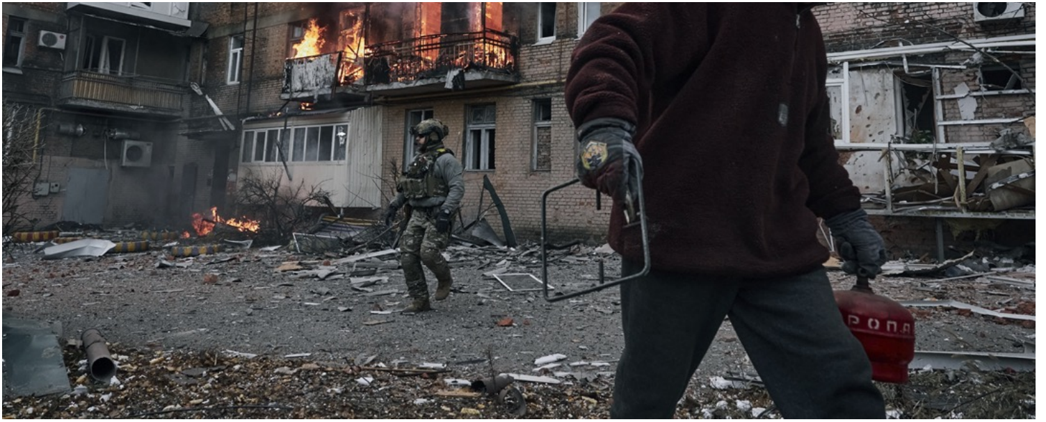
2022年12月7日，烏克蘭頓涅茨克州巴赫穆特市（Bakhmut），一名居民從一所被俄軍炮彈擊中後著火的民居中逃生。