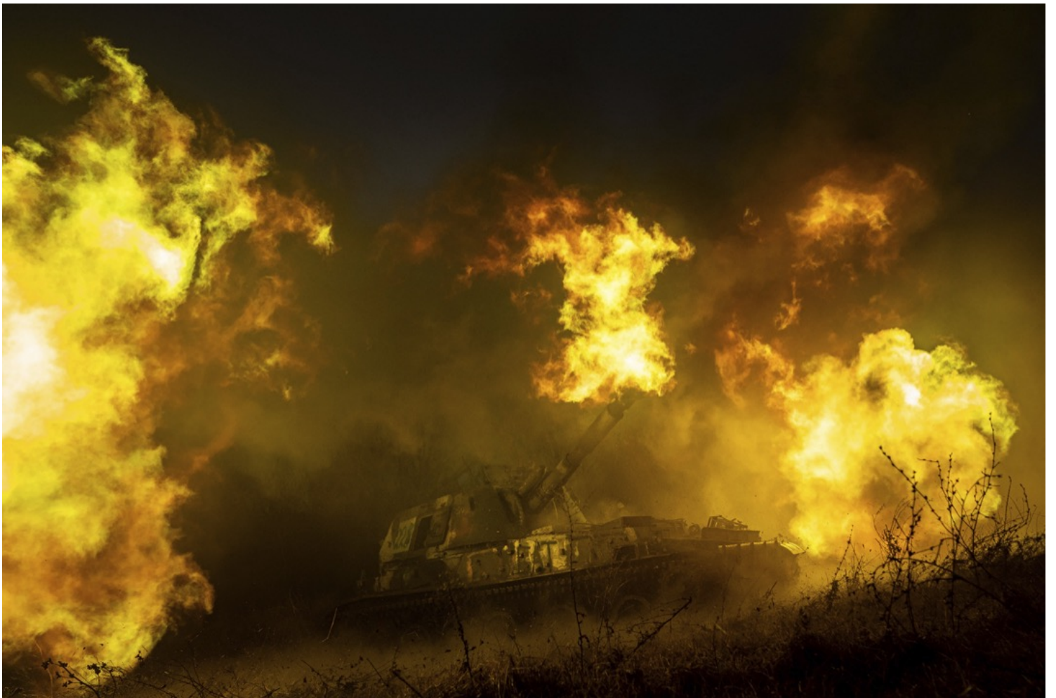
2022年12月24日，烏克蘭哈爾科夫，一輛炮彈裝甲車向俄軍戰線發射炮彈。