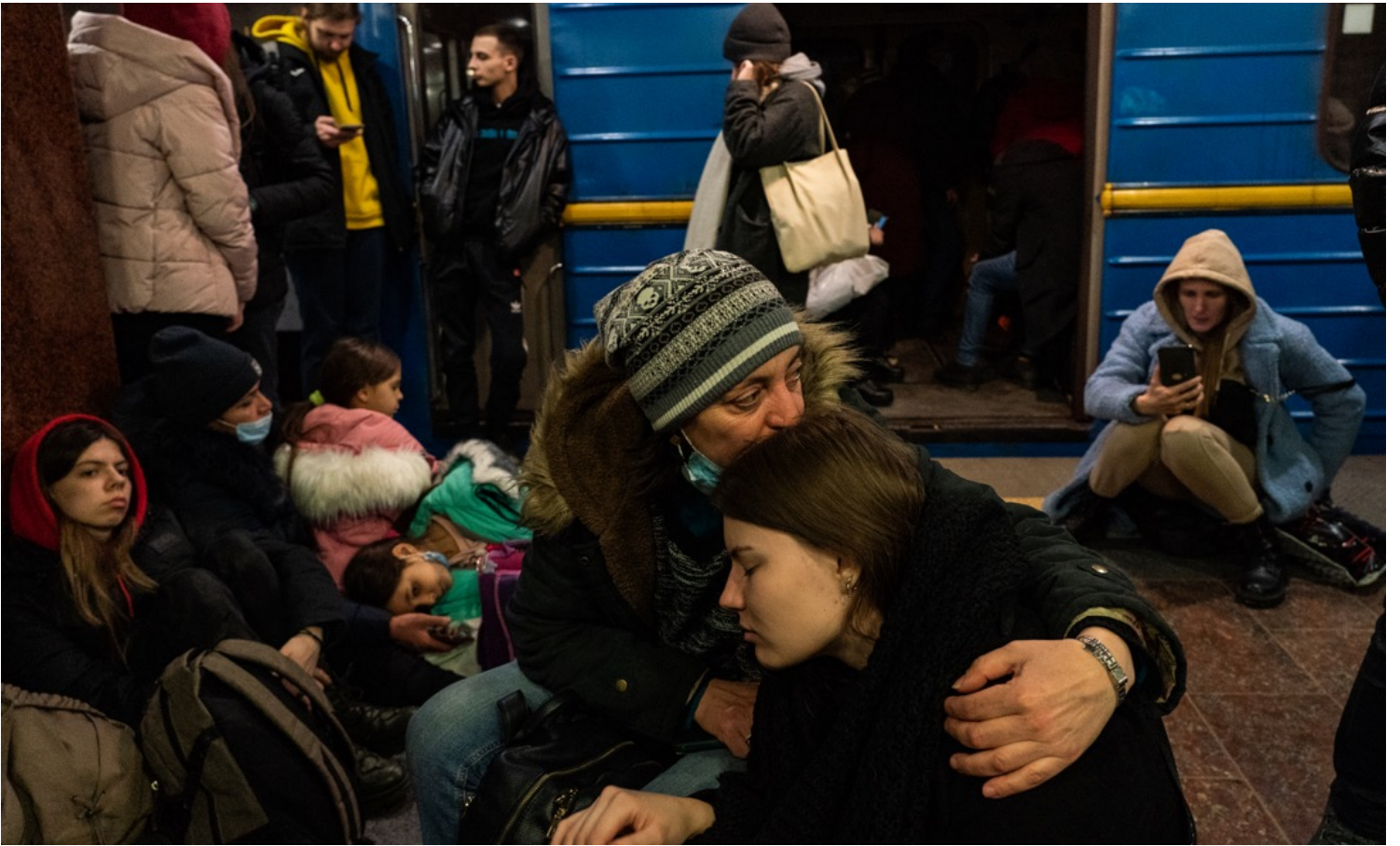
2022年2月24日，烏克蘭哈爾科夫，俄軍與凌晨時分向烏克蘭發動侵略行動，大批當地居民湧到地鐵站暫避。