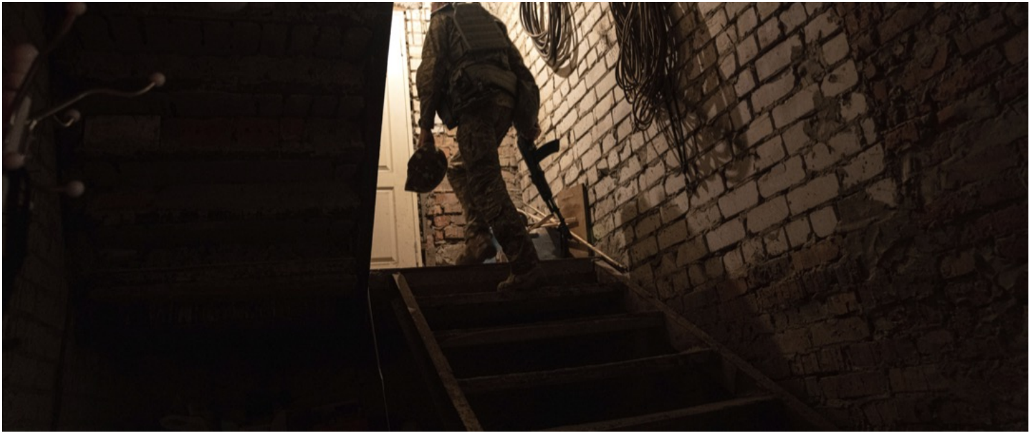
2022年7月12日，烏克蘭哈爾科夫，一名士兵正離開一所房子的地牢，前往戰線。