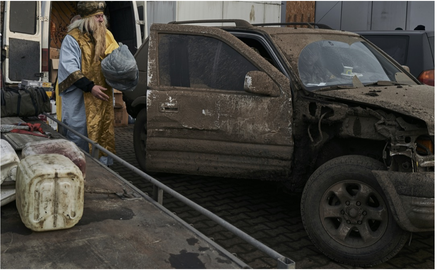
2022年12月25日，聖誕節，烏克蘭頓涅茨克州康斯坦丁尼夫卡市（Kostiantynivka），一名義工裝扮成聖尼古拉斯（Saint Nicholas）向當地軍人派禮物。