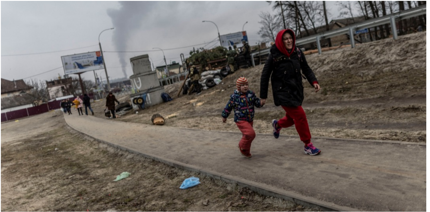
2022年3月6日，烏克蘭首都基輔近郊小鎮伊爾平，當地居民慌忙走避突如其來的俄軍炮彈襲擊。