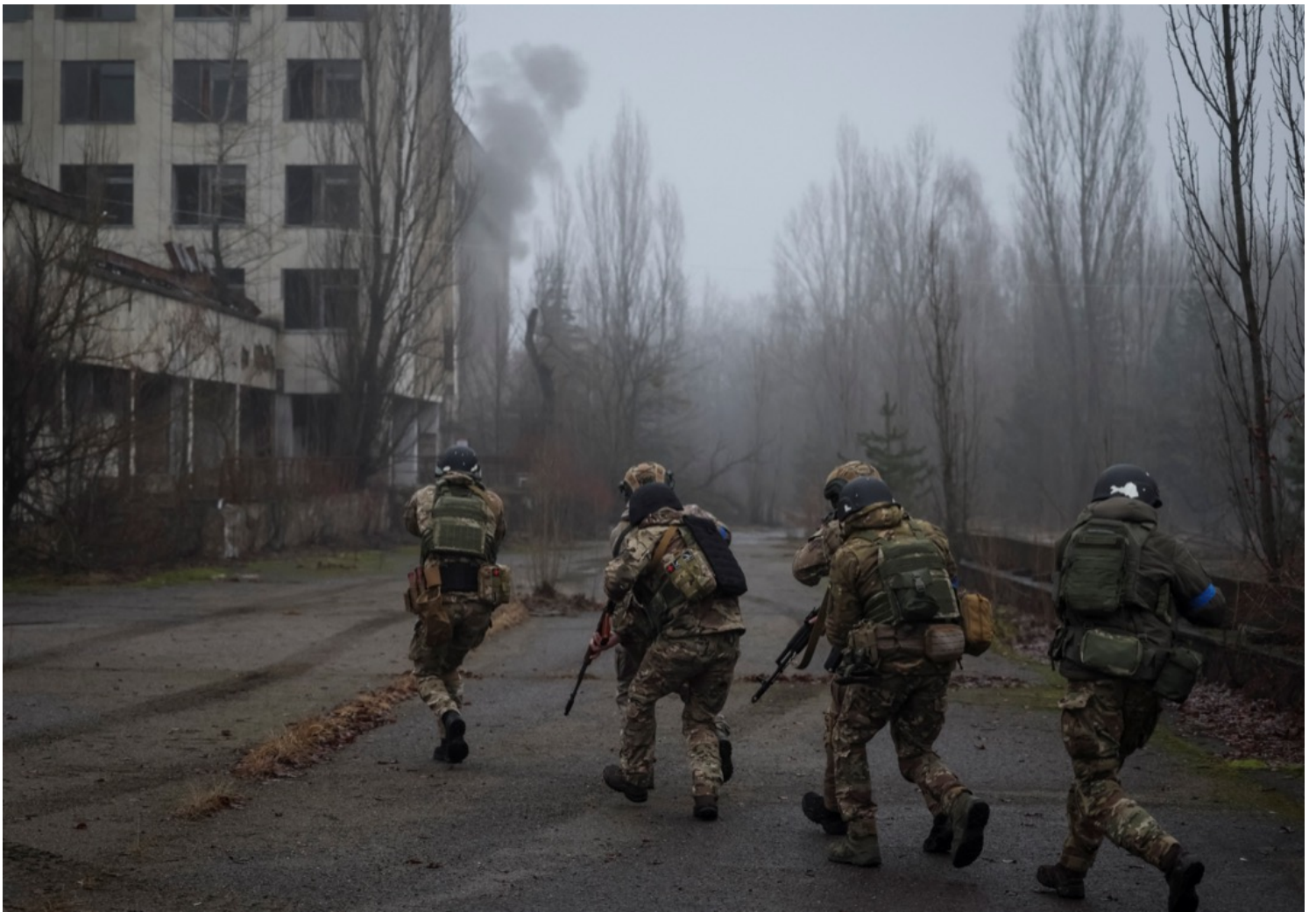
2023年1月20日，烏克蘭與白羅斯接壤邊境城市普里皮亞季（Pripyat），烏軍士兵、邊防部隊和安全部隊成員參與共同軍事演習。