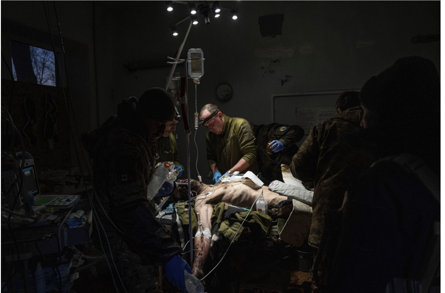
2023年1月9日，烏克蘭頓涅茨克，烏軍軍醫位一名受傷的士兵施手術。