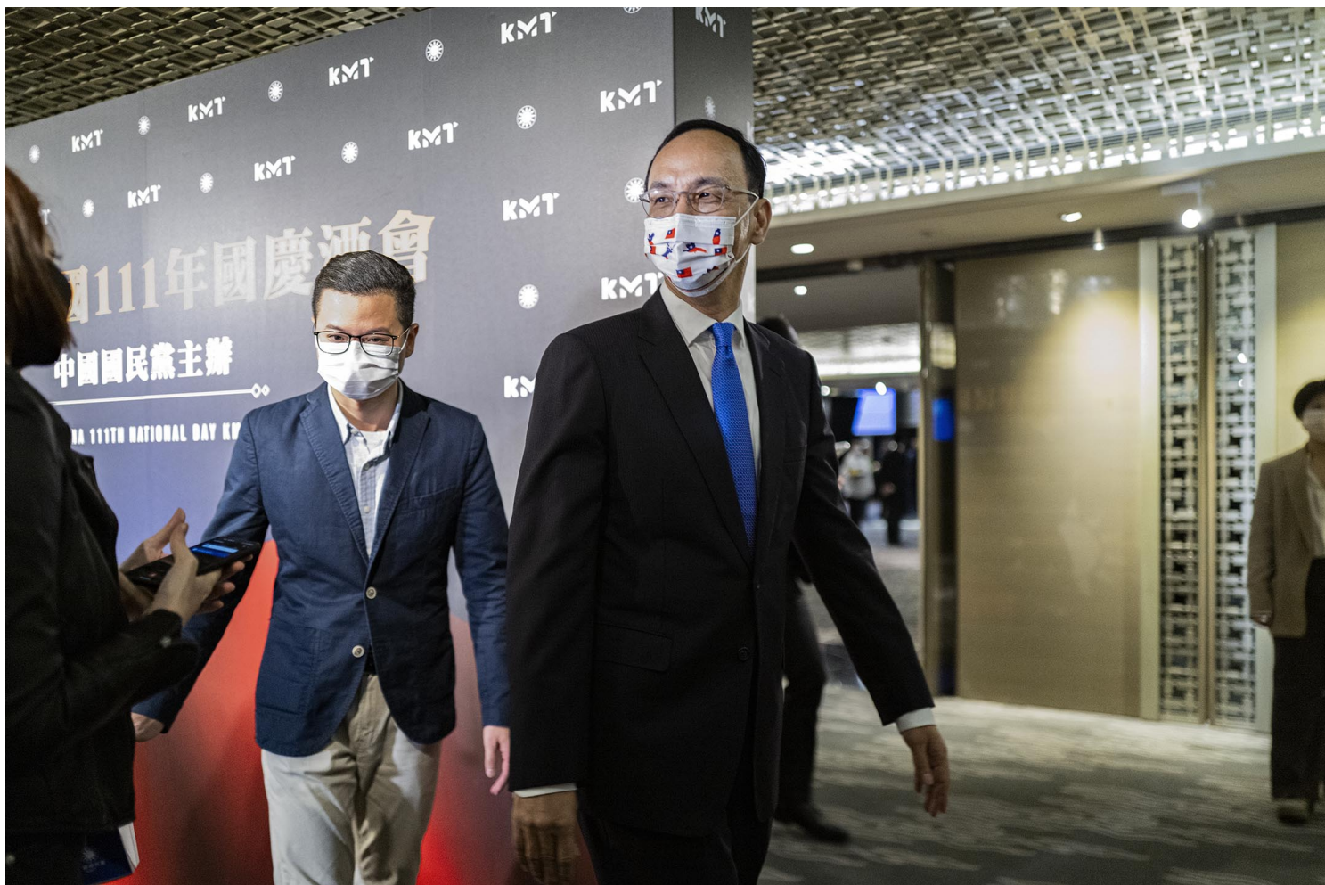
2022年10月13日，台北，朱立倫出席國民黨舉辦的國慶酒會。

除此之外，侯友宜在黨內或是面對其他政黨，也都有挑戰必須面對。對內在於侯友宜的本土色彩，加上被陳水扁於總統任內拔擢為警政署長的歷史，甚至被深藍支持者貼上「藍皮綠骨」的標籤。對外則是濃烈的本土特性，欠缺足夠的國際背景與視野，也容易成為選舉時遭到其他政黨攻擊的軟肋。