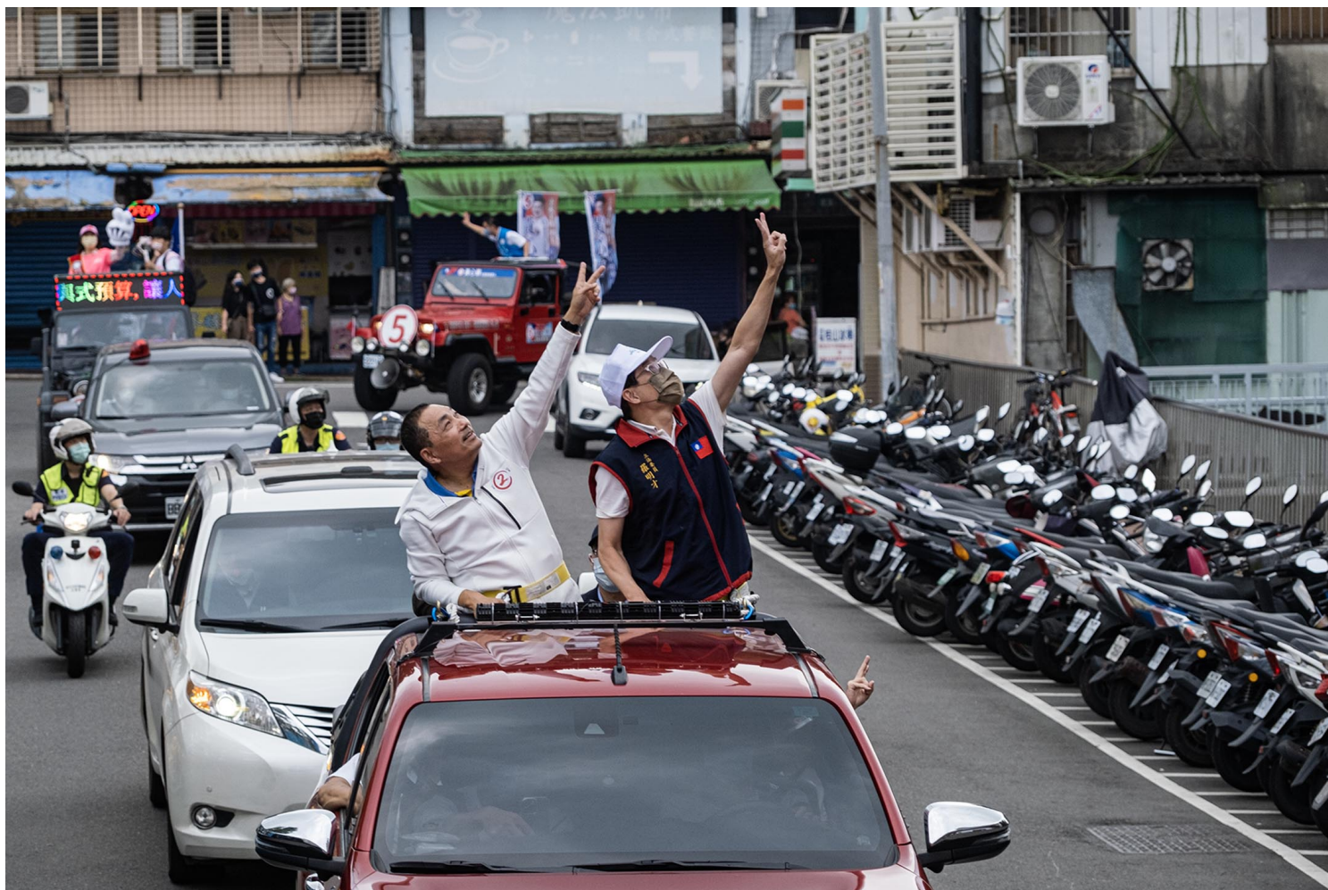
2022年11月22日，國民黨新北市長候選人侯友宜掃街拜票。