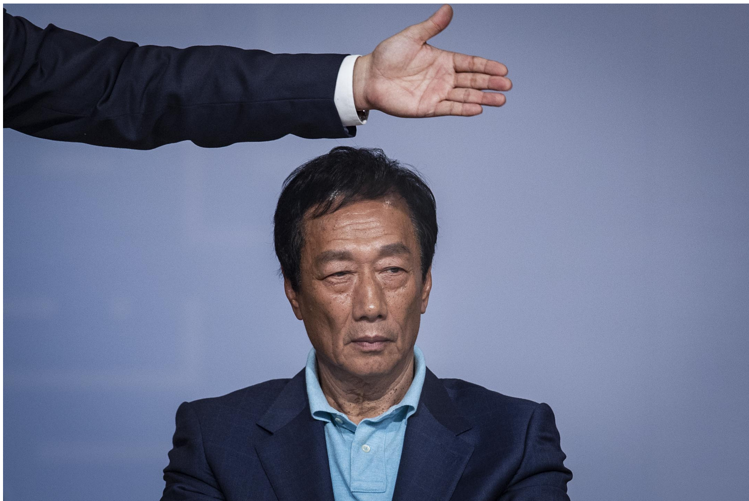
2019年4月30日，台北「突破困境·迎接挑戰——重振台灣競爭力會議」，郭台銘在圓桌論壇台上。

高的人選，在各種交叉比較下，朱立倫的勝選機率反而是最低的。此外，由於朱立倫在2016年本身是「換柱」風波的主角，加上黨內的立場也被深藍支持者所質疑，如果2024年再度參選，對內也要先說服深藍支持者。聲勢低、難以安撫深藍，是現任主席朱立倫的困境。