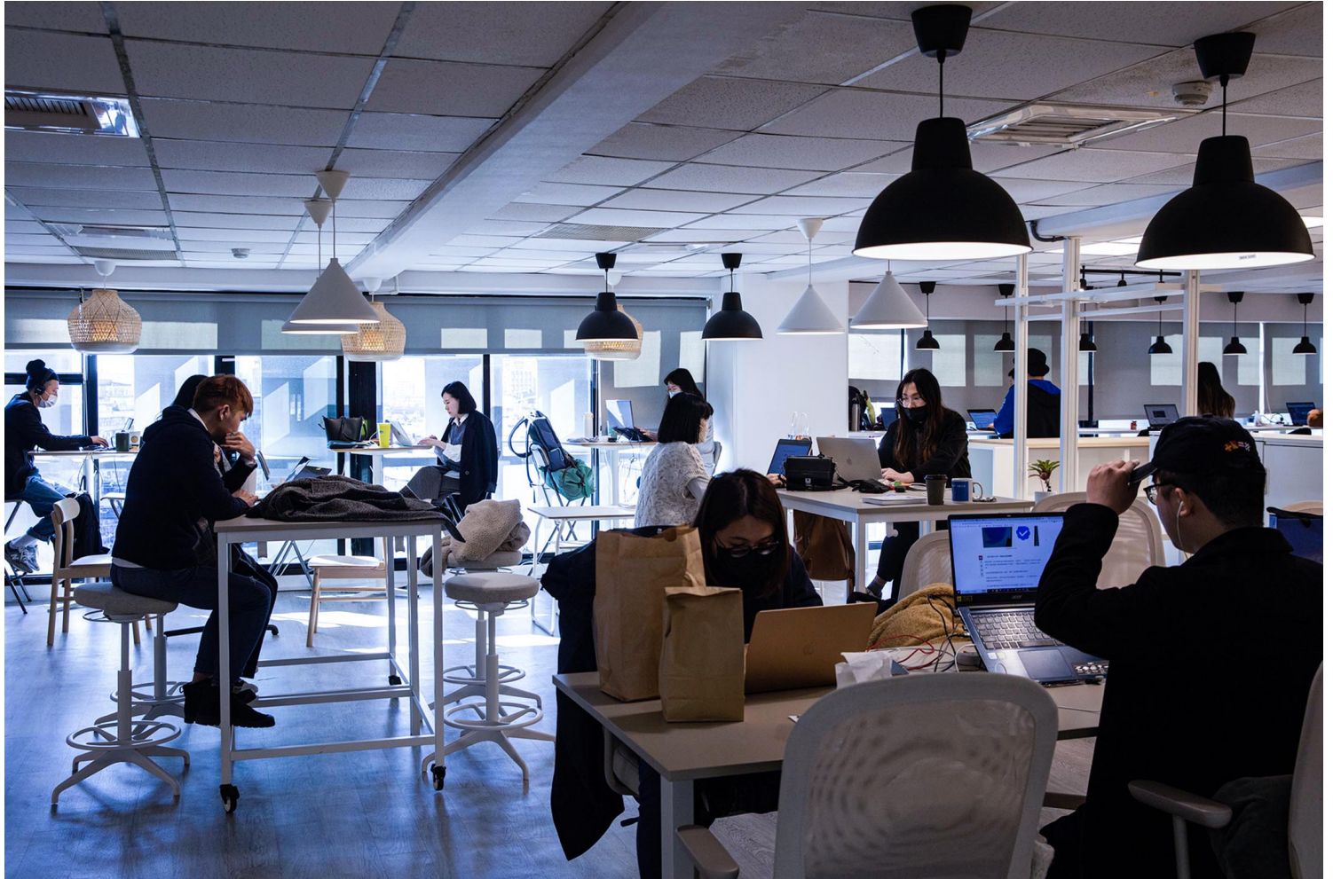
2023年1月31日，台北一間辦公室。

「職責的『分內』到底線劃在哪裏？」安靜離職者也許決定了自己的「分內」，但有沒有和團隊達成共識？「雖然偽裝成配合度很高，但旁人都看得出來，你正在和『自己沒有那麼認同的工作』保持著『可進可退的安全距離』，這種演，大家心知肚明。」楊元慶百感交集說道。