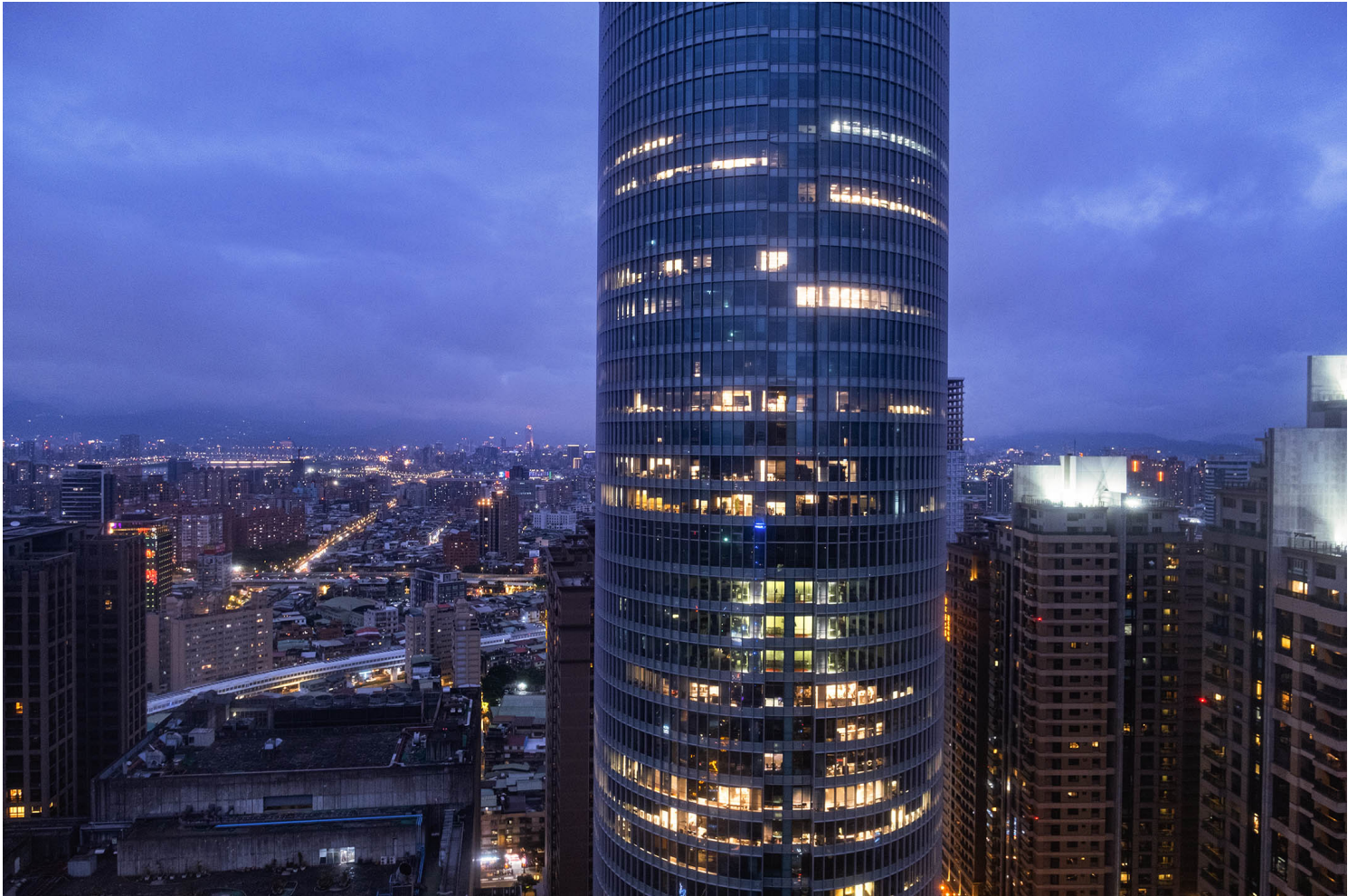
2023年2月5日，台灣板橋的商業大廈。

你聽過「安靜離職」（quiet quitting）這個新名詞嗎？別誤會，它不是真的離職，而是一種職場新觀念：工作者仍然履行自己的職責，只是工作上不再投入額外心力，去試圖做得更多、更好，停止推崇把工作視為人生全部的職場奮鬥文化（hustle culture），因為人的價值不等於他的生產力。