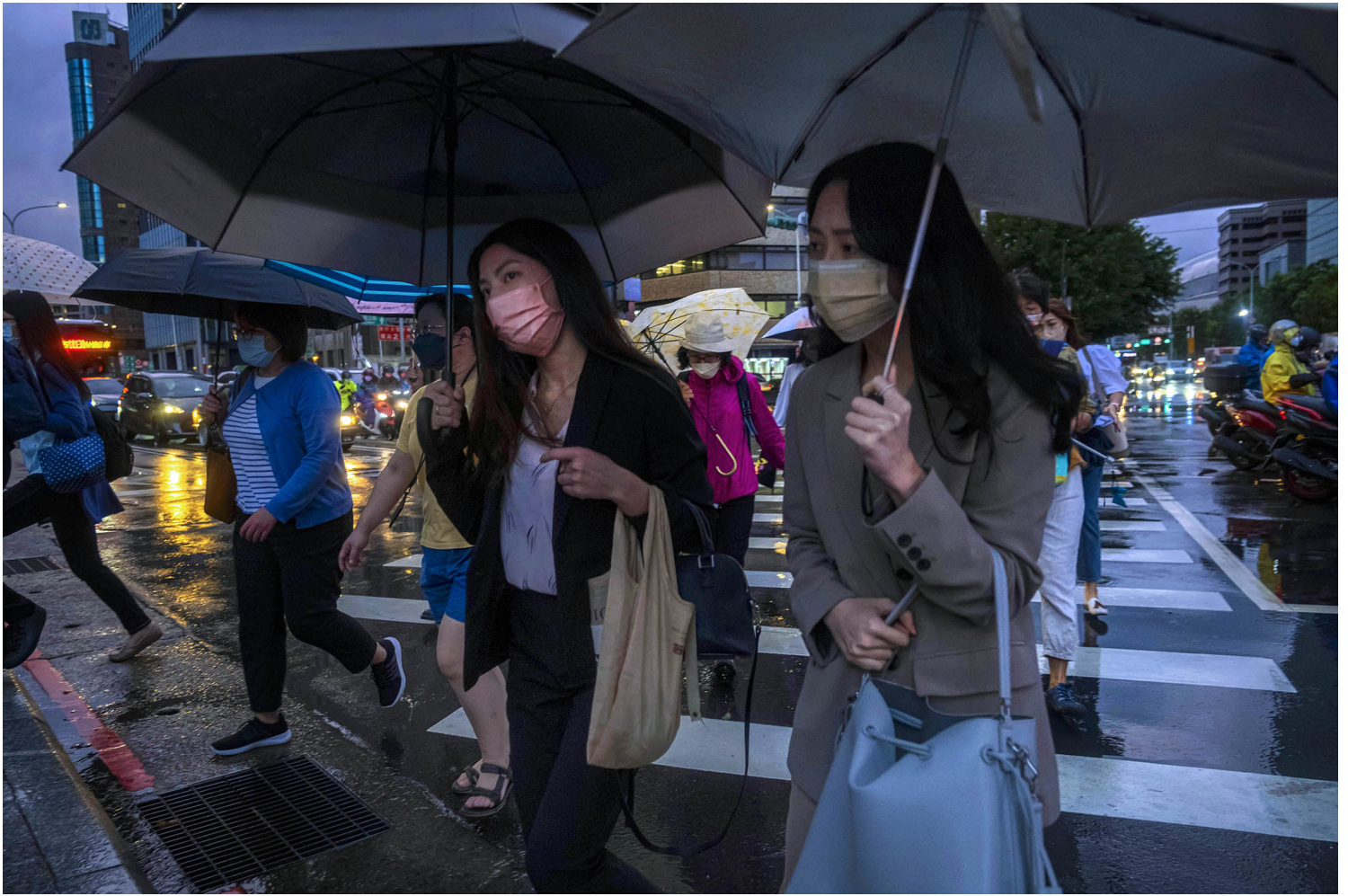
2022年9月3日，台北，市民在颱風天橫過馬路。

界」的工作狂宣言，與被職場成功學和 失控的熱情磨難 之間，工作有沒有一個平衡點？