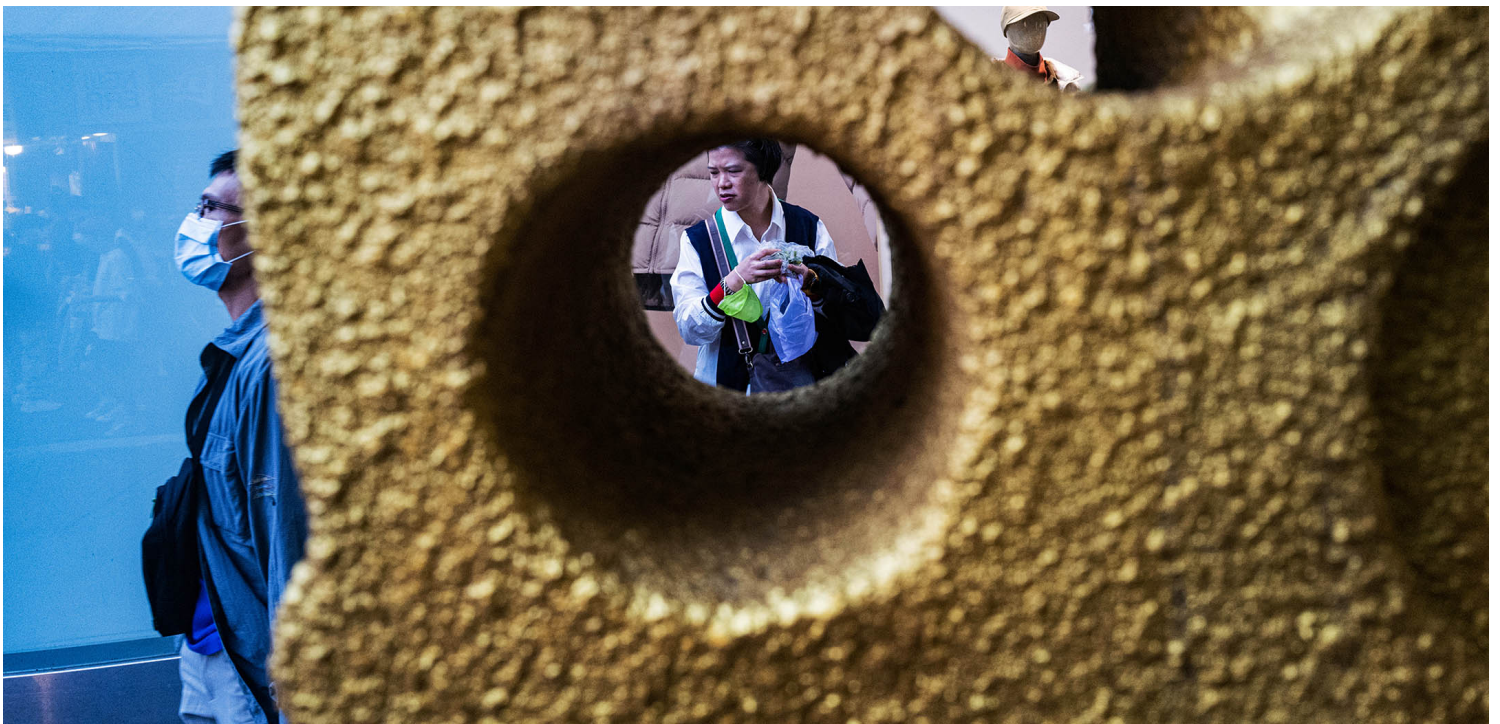
2022年12月4日，市民在西門的路邊吃東西。