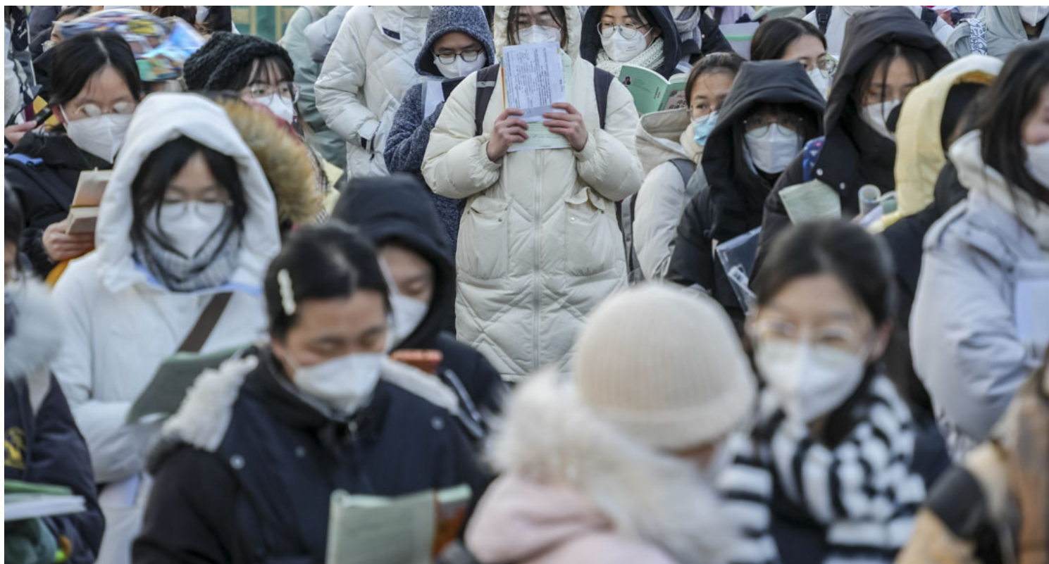
2022年12月24日，2023年全国研究生入学考试考生在中国山东省济南市排队进入考点。