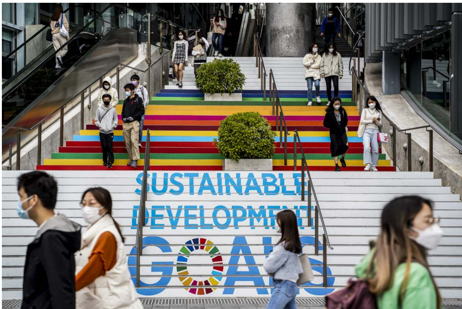
2023年2月2日，香港中文大学的学生。