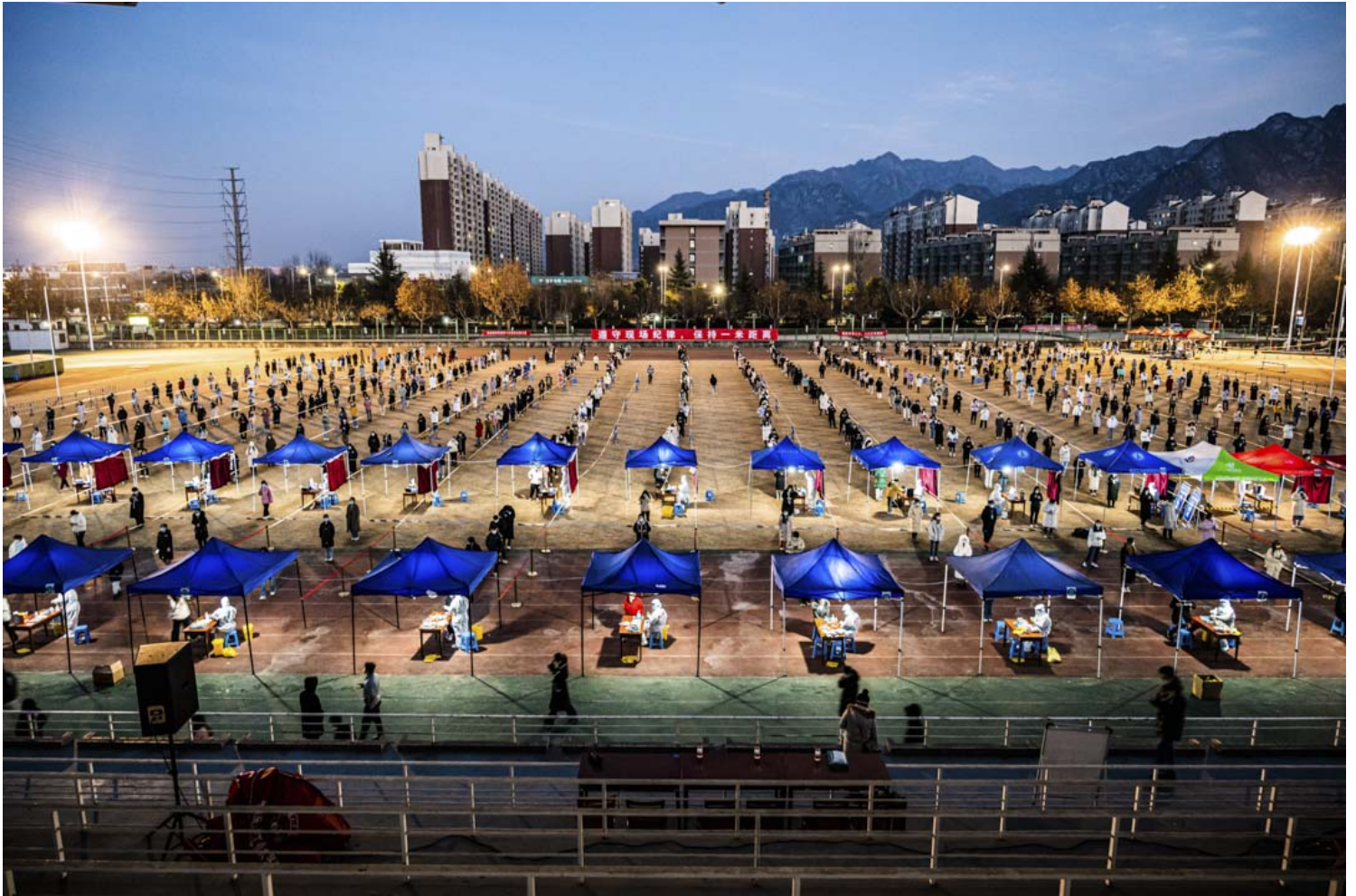
2021年12月29日，西北工业大学的学生在排队接受 COVID-19 核酸检测。

留学深造对罗忻家里是不小的负担。读书不只需要学费，还有生活费、房租、甚至包括公费师范违约金。罗忻家掂量着卖房子，但疫情期间房子也卖不出去，“现在谁敢用钱，都是存续经济的状态。”罗忻的父母不在体制内，社保拿不到几千元。“不是积蓄掏不出来，是养老积蓄给我拿去读书。那我能不能负担起家里的未来？”