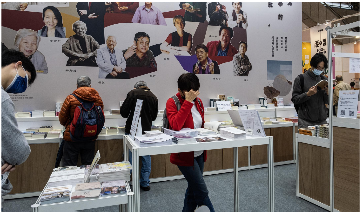
2023年2月1日，台北国际书展。