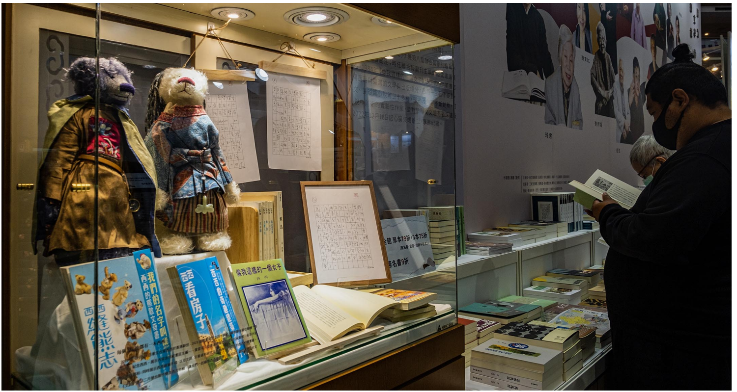
2023年2月1日，台北国际书展展出西西的作品。

这并不是评估参展单位有多少钱和预算布展的问题，例如心灵工坊的摊位并不大，但是展区设计完全以绿色植物围绕，对比其他许多直接设计成卖场一般的摊位，立刻显得清新脱俗无比；隔壁的台湾商务印书馆则亦维持历来的一贯风格，也是极有诚意的参展单位（想到他们把重庆南路的整幢建物放租出去、把书店门市撤掉就觉得心酸）。