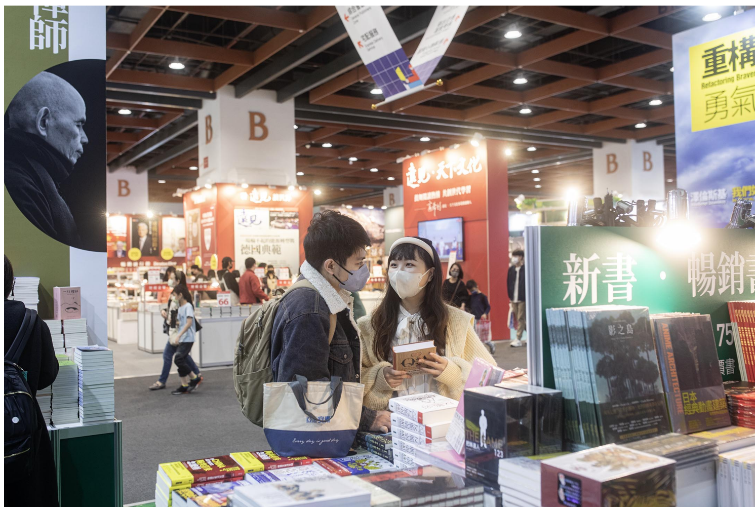
2023年2月1日，台北国际书展。

至于独立书店文化协会则是刚好欣逢成立十周年，便以“拾年”为主题做了一系列的书店历史回顾，这些种种规划，展现出的是独立出版联盟、NGO及独立书店协会这几个团体或组织的企划力、执行力。让人不禁感叹书业如果要真正成就“多重宇宙”，真的就需要凭借这样的创意及活力，开始进行各项规划重建修整的工作才行，不论在纵向的上下游供给面还是在横向的彼此连结的合作面，乃至从作者到读者的关系联系与服务提供的机制，我们的书业有太多破洞及漏隙需要修补，否则这宇宙只会一直萎缩衰落下去。