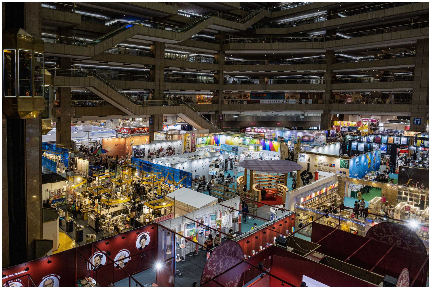
2023年2月1日，台北国际书展。

但这同时，也表示今次书展距离去年上次举办，其实只过了六七个月，在半年多的时间内连续举办两次国际书展，对所有参展单位而言，大概都会在布展预算上感到捉襟见肘吧？毕竟出版产业很可能是台湾现在所有产业中，最卑微、弱势、无利可图，且还在衰落中的产业了吧？