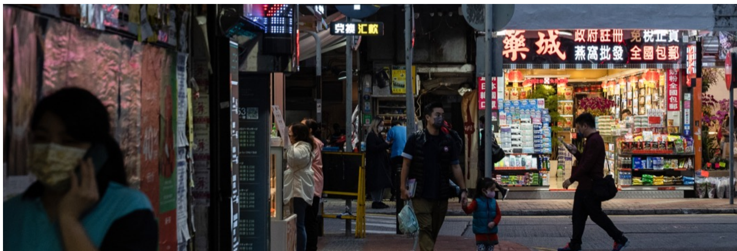
2023年1月4日，香港，铜锣湾购物区的药房。

香港放宽防疫政策，碰上与大陆通关，他心情复杂。他认为香港之前的防疫政策过严，只是因为大陆解封，突然急转弯。在大陆爆疫的节点通关，除了让他担心香港的物资短缺、疫情反复之外，也意味着将要重新面对中港两地居民恢复往常交流的城市生活。