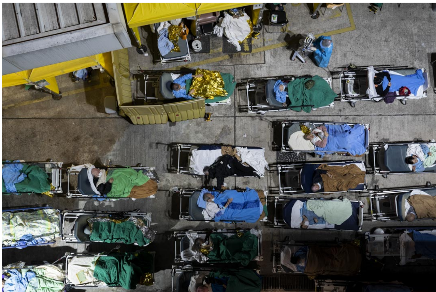
2022年2月16日，明爱医院在急症室旁边的露天空地设立隔离区，不少长者病人卧在病床上等待覆检，医护人员需要在露天环境照料患者。

通关安排引发公立医院再次爆煲的疑虑。医管局行政总裁高拔升在2023年1月1日的网志中提到，随着社会活动增加，Covid-19个案难免上升，但香港已经达致较高的疫苗接种率，早前曾确诊人数已超过250万，有足够防疫屏障。