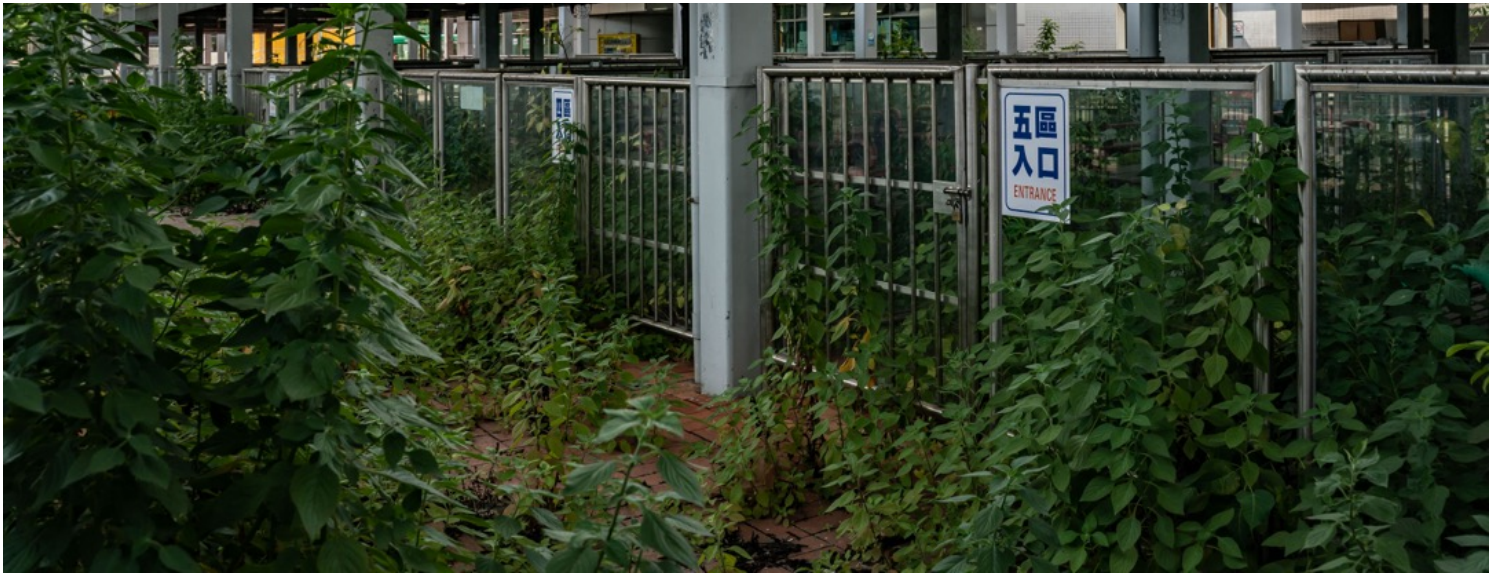
2022年10月5日，香港，落马洲新田过境巴士总站停用多时，站内长满杂草。

正在台湾读书的香港人子文，则计划趁着1月通关，到大陆跟亲人团聚过年，顺便带退烧药回家。去年暑假入境大陆有多重限制，他透过黄牛、花了1800港元才买到一个回乡名额。除这次回乡之外，他已经3年没有跟大陆亲戚一起过年了。