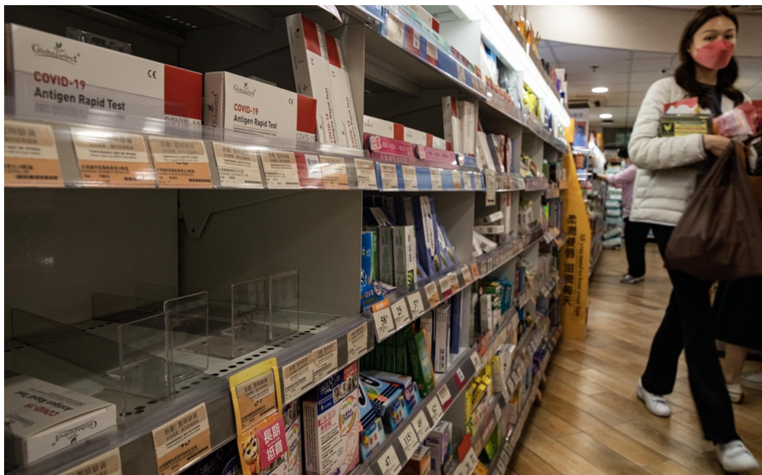
2023年1月5日，香港，北角一家万宁，原本放置必理痛、幸福伤风素的货架上，堆满Covid-19的快测试剂。

记者走访铜锣湾区13间药房和药物连锁店，大部分必理痛已经售罄。一名药房职员说自己也买不到必理痛，“我有鼻敏感要食，但之前儿女确诊，一人一盒食完了。”香港人比较熟悉的感冒止痛药品牌如乐信、幸福、克痛等等，货源亦紧张。大多店铺转向客人推广来自日本、马来西亚和印度的扑热息痛药物，也有药房售卖散装止痛药。