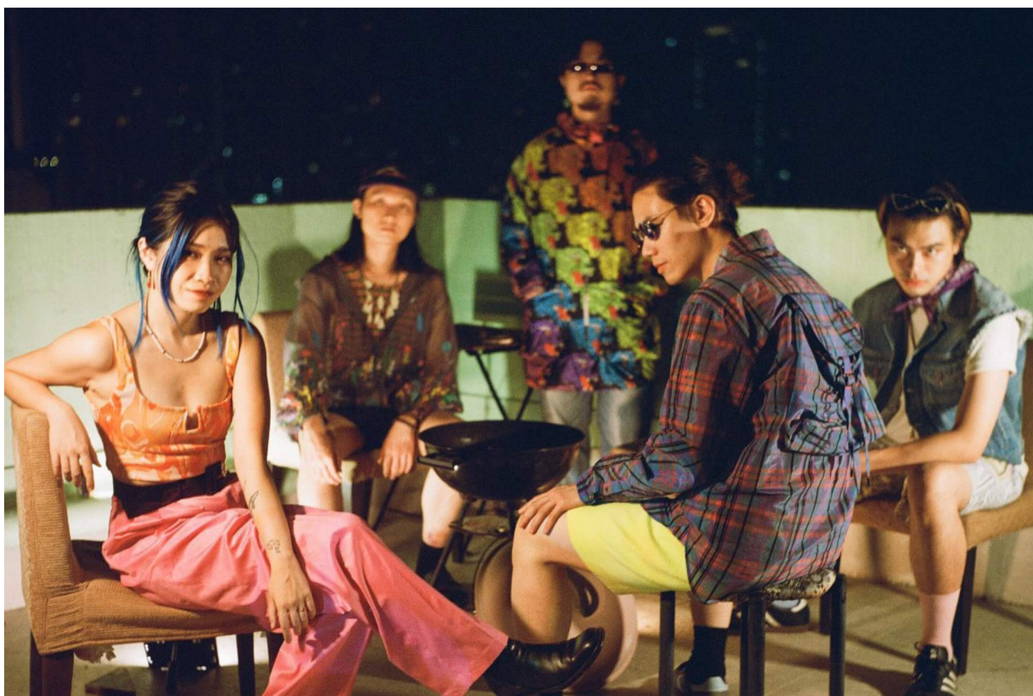
乐队 Lucid Express。

身份、语言、情绪的困境，如何通过音乐表达？这些音乐人会怎样书写自己的尴尬与痛苦？