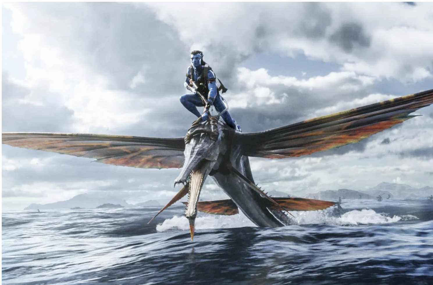
《阿凡达：水之道》剧照。

有前头的预设、前提和背景，方才能理解坊间对《阿凡达：水之道》救市的渴切之心，而上映三天票房占比直近98%，也是理所当然。由于防疫政策的反复无常，大陆电影院在2022年遭受腰斩般的灭顶之灾。全国范围内的营业率，一度跌穿至36%。院线入不敷出，人们无片可看。