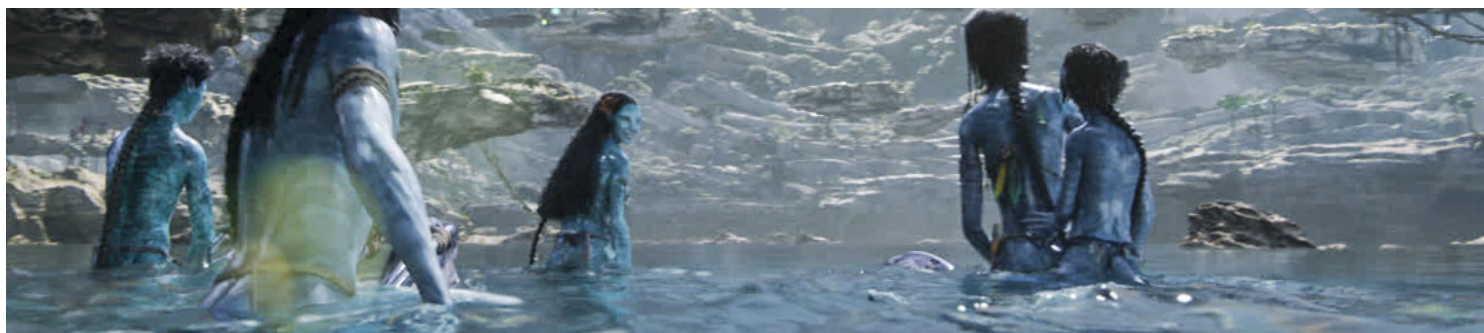
《阿凡达：水之道》剧照。网上图片