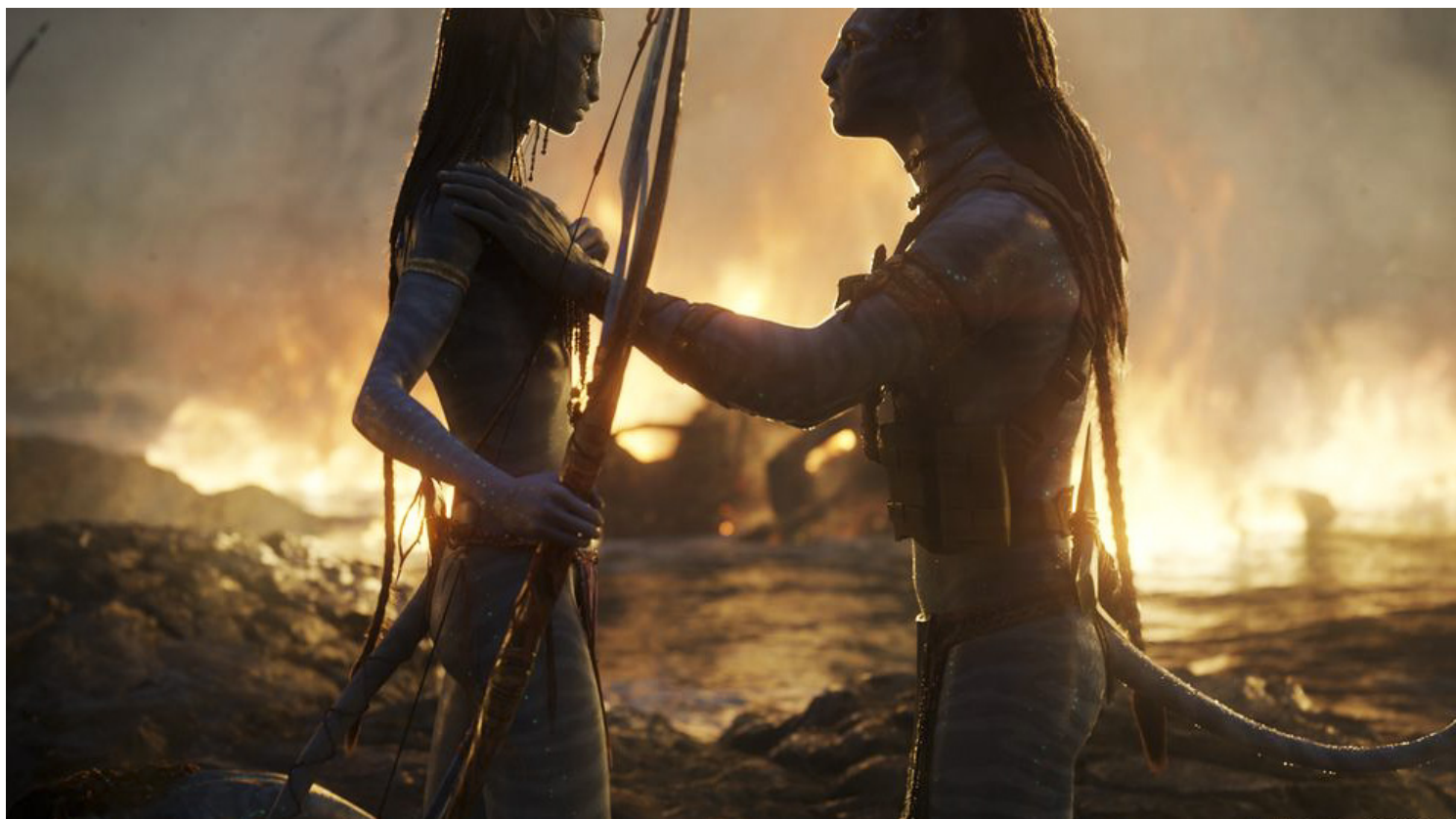
《阿凡达：水之道》剧照。网上图片