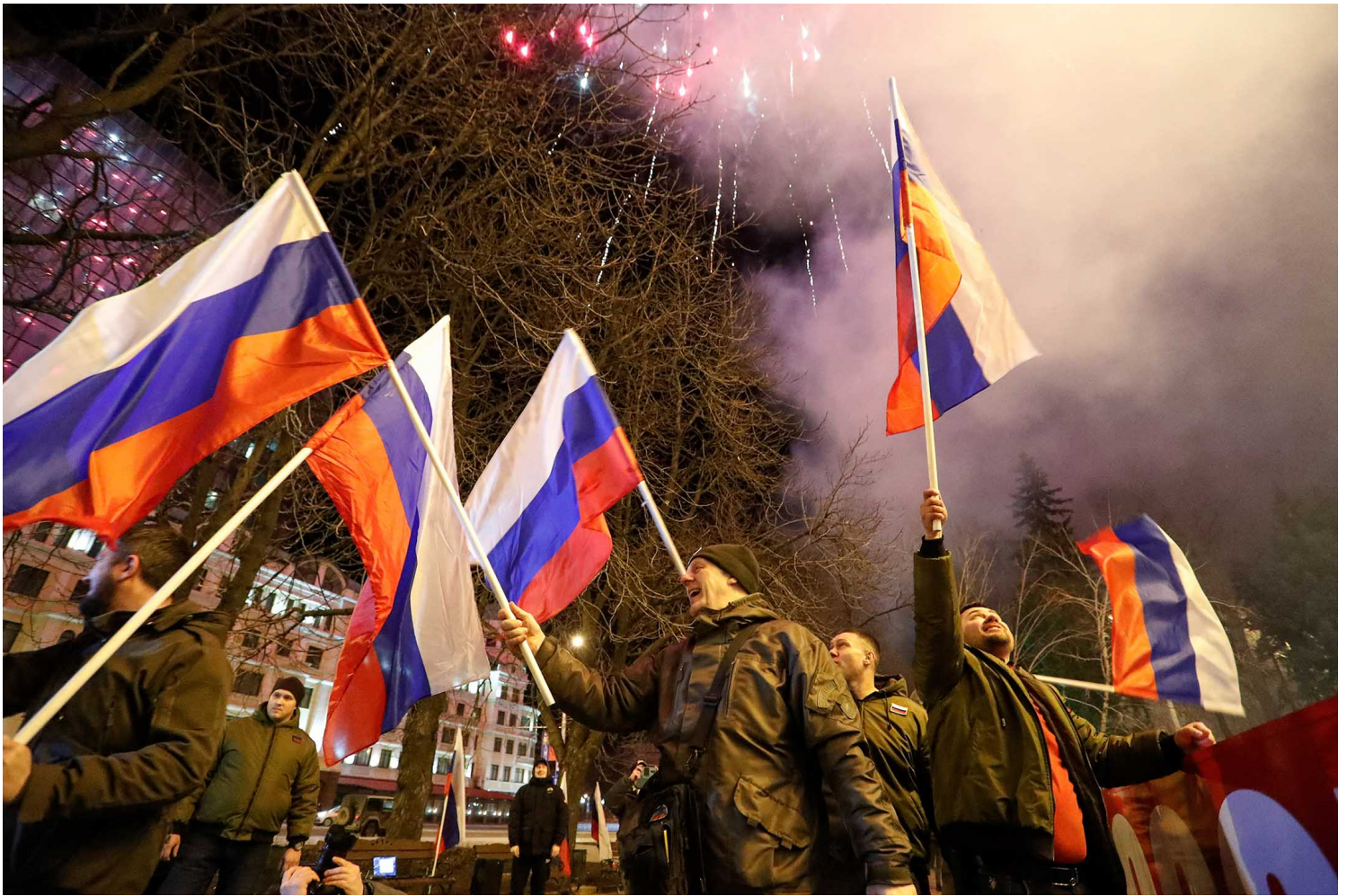
2022年2月21日，俄罗斯总统普京签署一项法令，承认乌克兰东部的两个分离地区独立后，亲政府支持者在街道上放烟花。

元首姆你白时 有么白八你，与元二/T天相 我们的 三千上正五市不俄开奥世 。以及白八你，但俄夕列国防部的所有要求都得到了100%满足。他表示：“我们没有看到任何问题。”