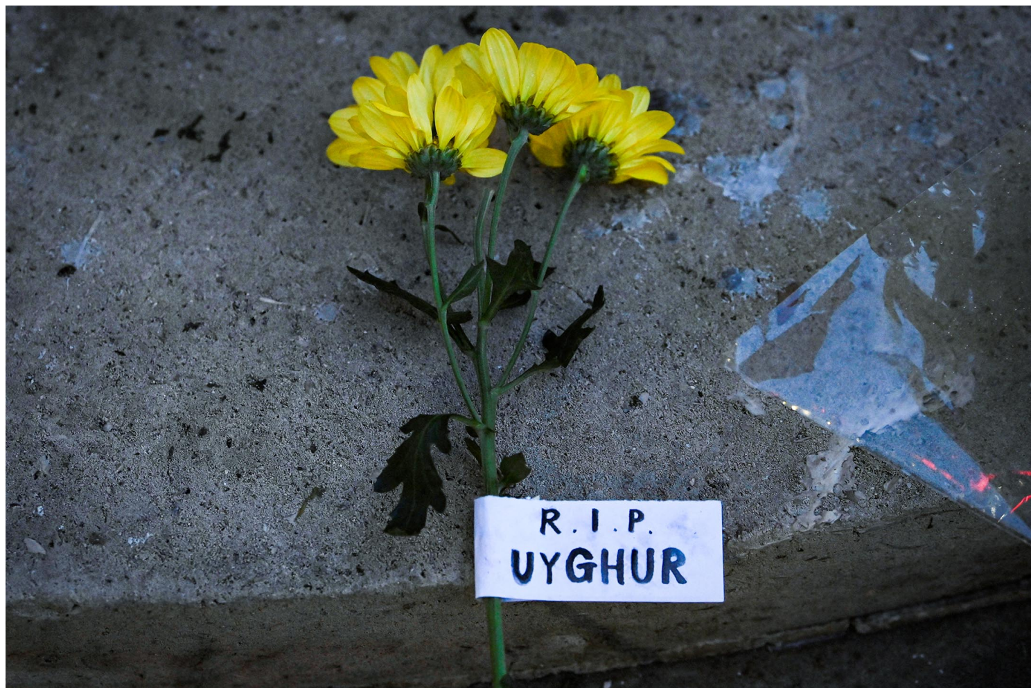
2022年11月28日，为悼念乌鲁木齐大火之死难者，中国驻英国伦敦大使馆对面放满鲜花和蜡烛。

从来没有“中国人”和“我们”。运动不是和中国人站在一起，而应该是和维吾尔人站在一起，和新疆的所有少数群体站在一起，和最被压迫的人站在一起。