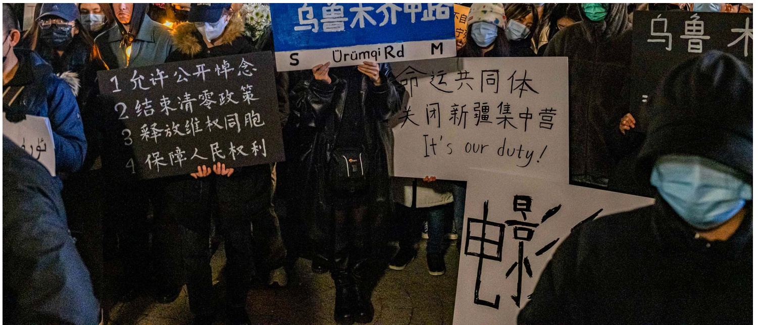
2022年12月2日，超过四百人参加了在波士顿唐人街举行的烛光守夜活动，以抗议中国的清零政策，并纪念乌鲁木齐火灾中的遇难者。

我没有什么立场去指责别的抗议者和组织者，因为我也是一员。在为乌鲁木齐火灾惨案愤怒的那些天里，在为国内群起的反抗活动振奋的那些天里，我从来没有一刻去主动了解，遇难的到底是谁。来之前，我只想着带白纸，都没想着把逝者照片打印带过来。也是在追悼会前不久，我才想到我不知道悼念的人是谁，上网查找才知道所有遇难的人都是维吾尔人。是在 Abduweli Ayup 这位维吾尔博主那里，我才第一次知道那一家五口的男主人和大儿子的遭遇。