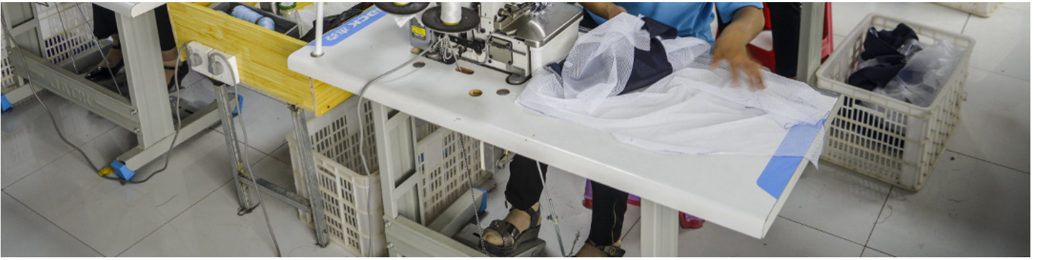
2020年6月18日中国新疆维吾尔自治区，工人戴着口罩在一家服装厂工作。

我也听过这样一种支持观点：为维吾尔人发声是很重要的，因为维吾尔人的现在就是汉人的未来，为维吾尔人发声也是为自己发声。这样的观点在政治动员策略（strategy）的层面是有可取性的，但是这种观点问题也很大。因为它的潜台词是说：汉人为汉人的自由发声，维吾尔人为维吾尔人的自由发声，只有在维吾尔人的命运关系到汉人的命运时才为维吾尔人发声。大部分人的重点还是在骂独裁、骂封控上，维吾尔人的问题实际上是被边缘化的。