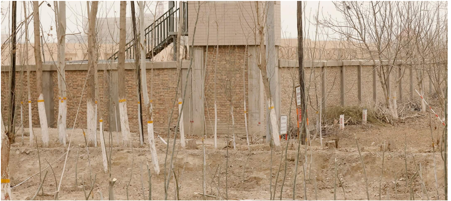
2022年5月23日，新疆莎车县一个拘留中心，一名保安人员在守望台看守。