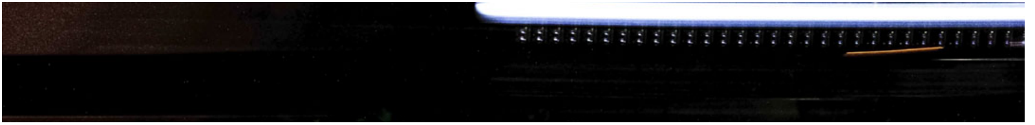
2022年10月20日，国民党高雄市长候选人柯志恩举行造势活动，站在舞台车上演讲。