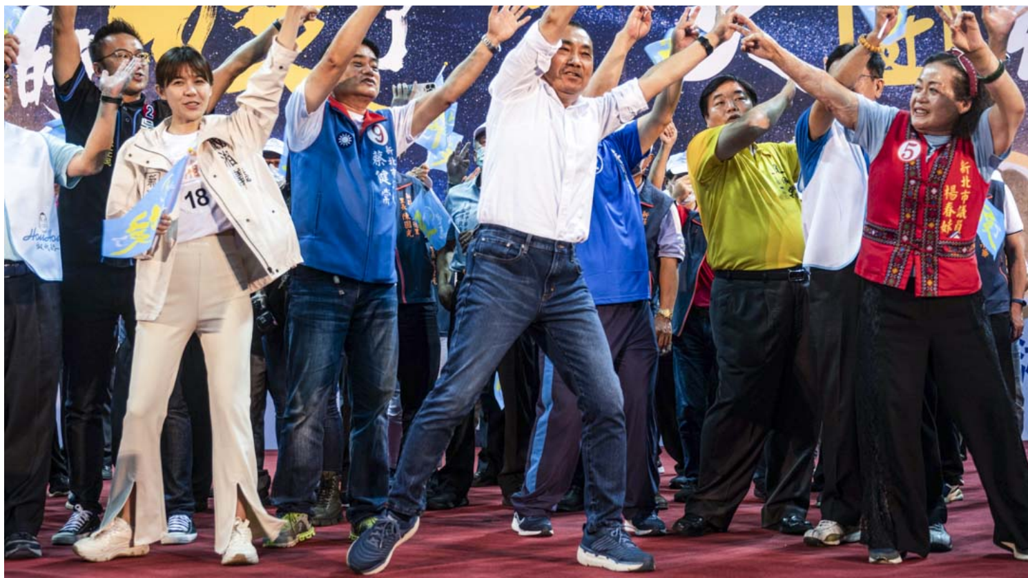
2022年11月20日，争取连任的新北市市长侯友宜举行造势晚会，并在台上跳唱自己的竞选宣传歌。