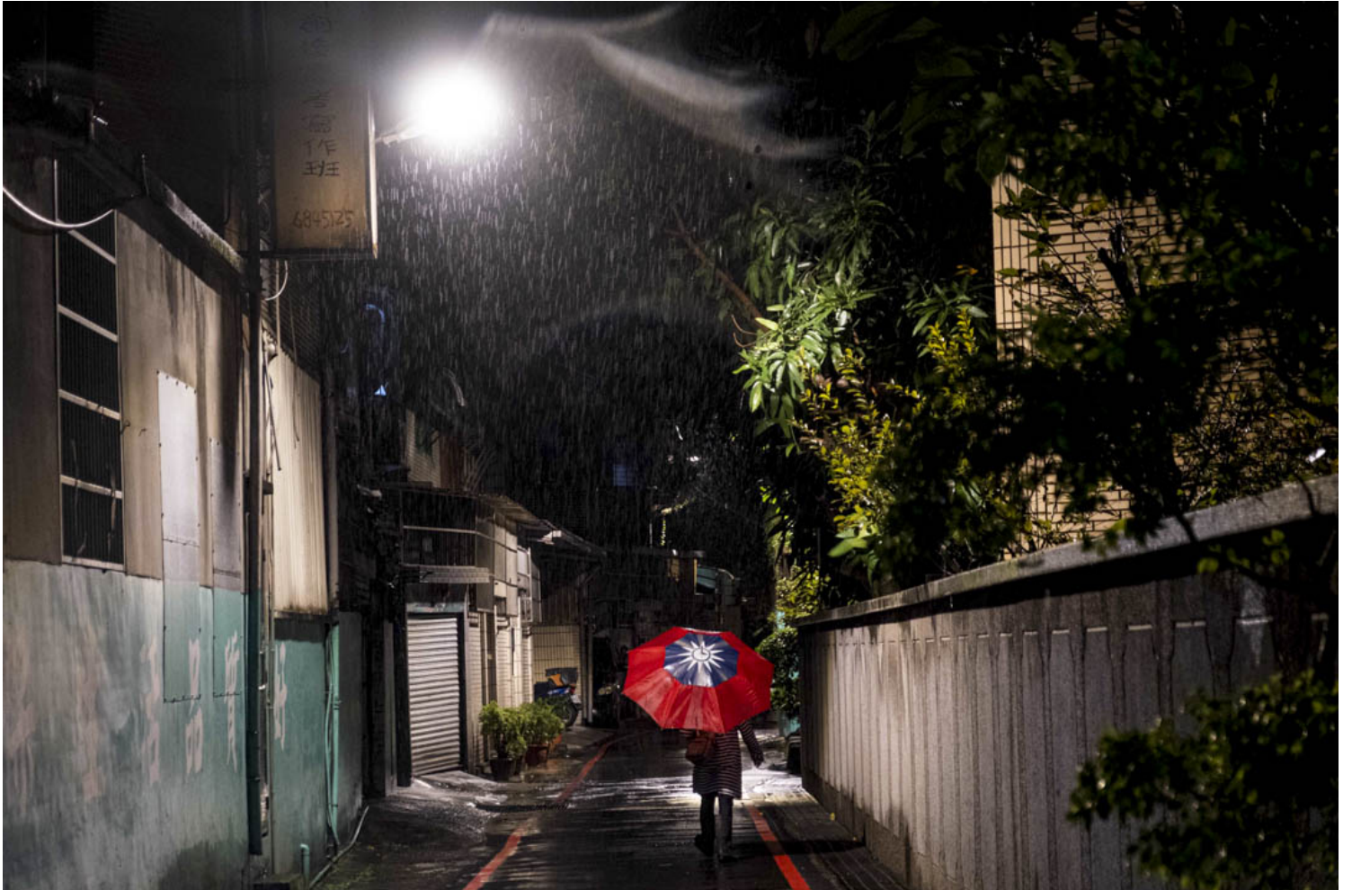
2022年10月19日，一名国民党的支持者在参加造势晚会后离开。