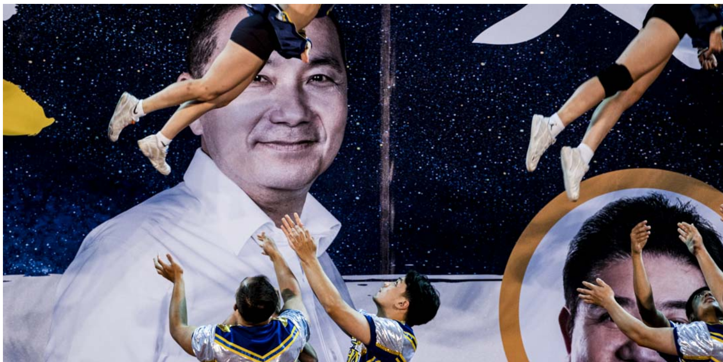
2022年11月20日，争取连任的新北市市长侯友宜举行造势晚会，台上有啦啦队表演。