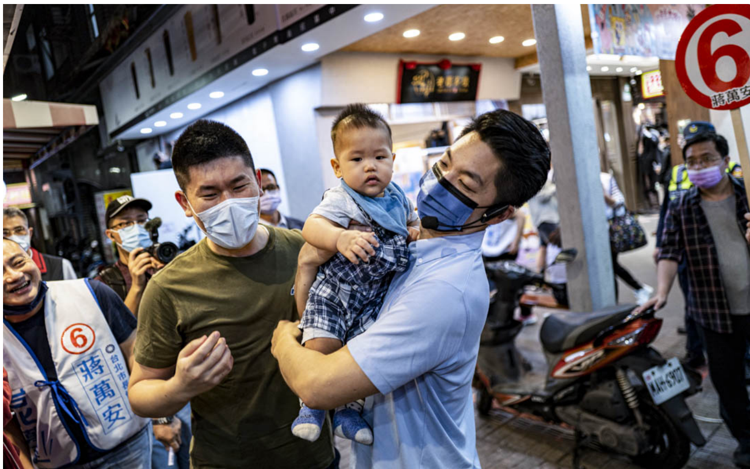
2022年11月21日，国民党台北市市长候选人蒋万安到西门町拜票，跟支持者合照。