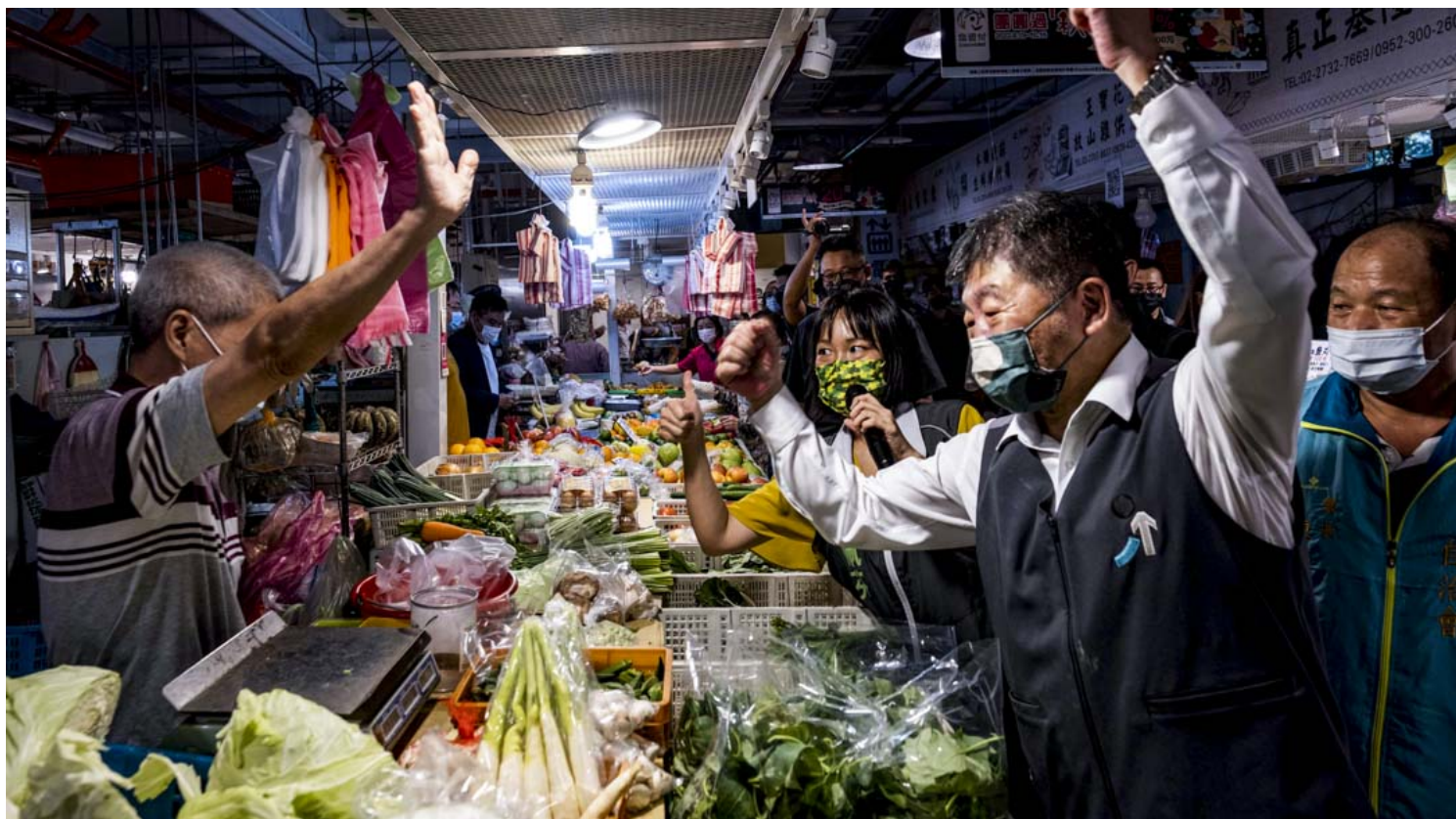
2022年9月27日，民进党台北市市长候选人陈时中到成功市场拜票，与市民握手。