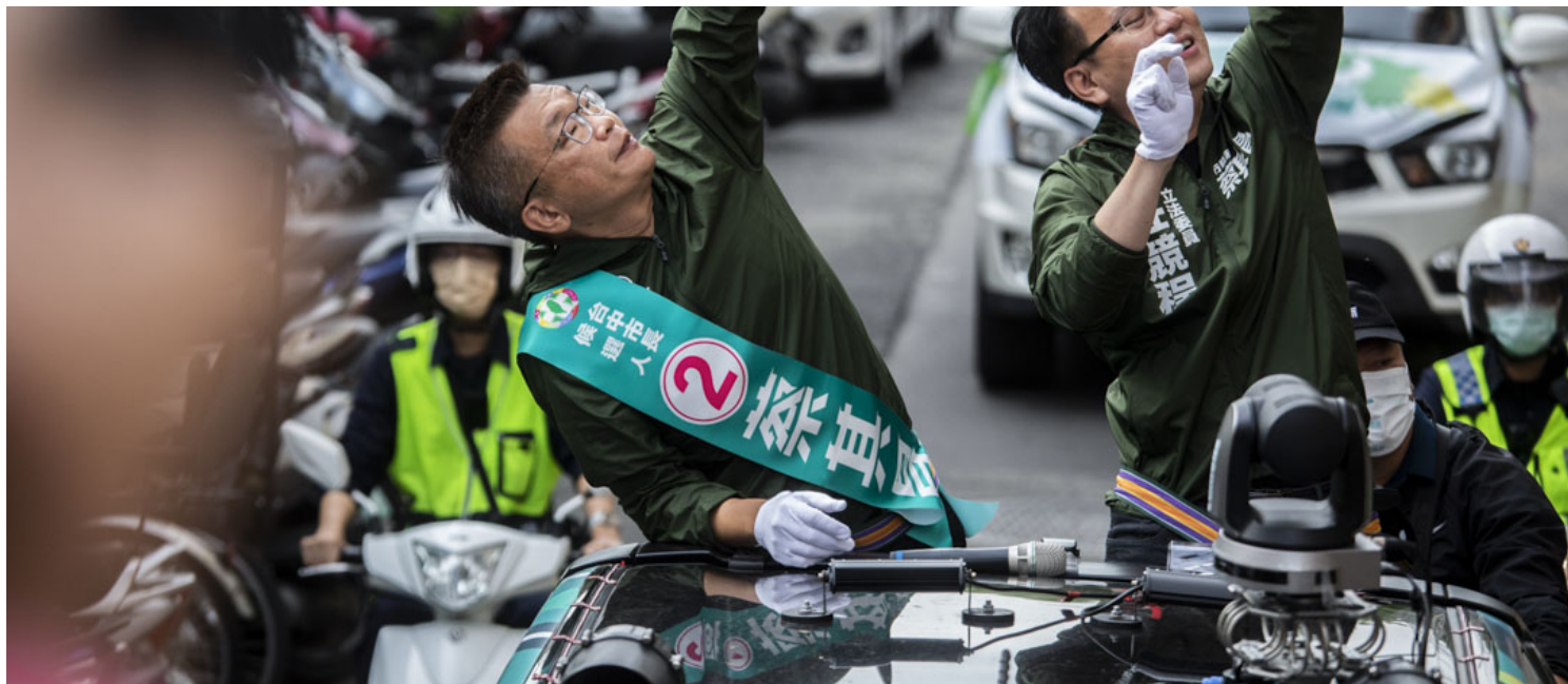
2022年11月24日，民进党台中市长候选人蔡其昌在北屯车队扫街。