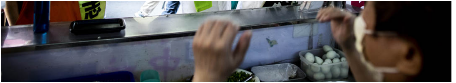
2022年11月23日，争取连任的民进党高雄市长陈其迈到冈山文贤市场拜票。