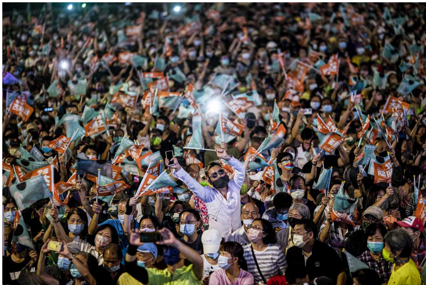
2022年11月13日，民进党台北市市长候选人陈时中在凯道举行造势活动，支持者挥舞旗帜。