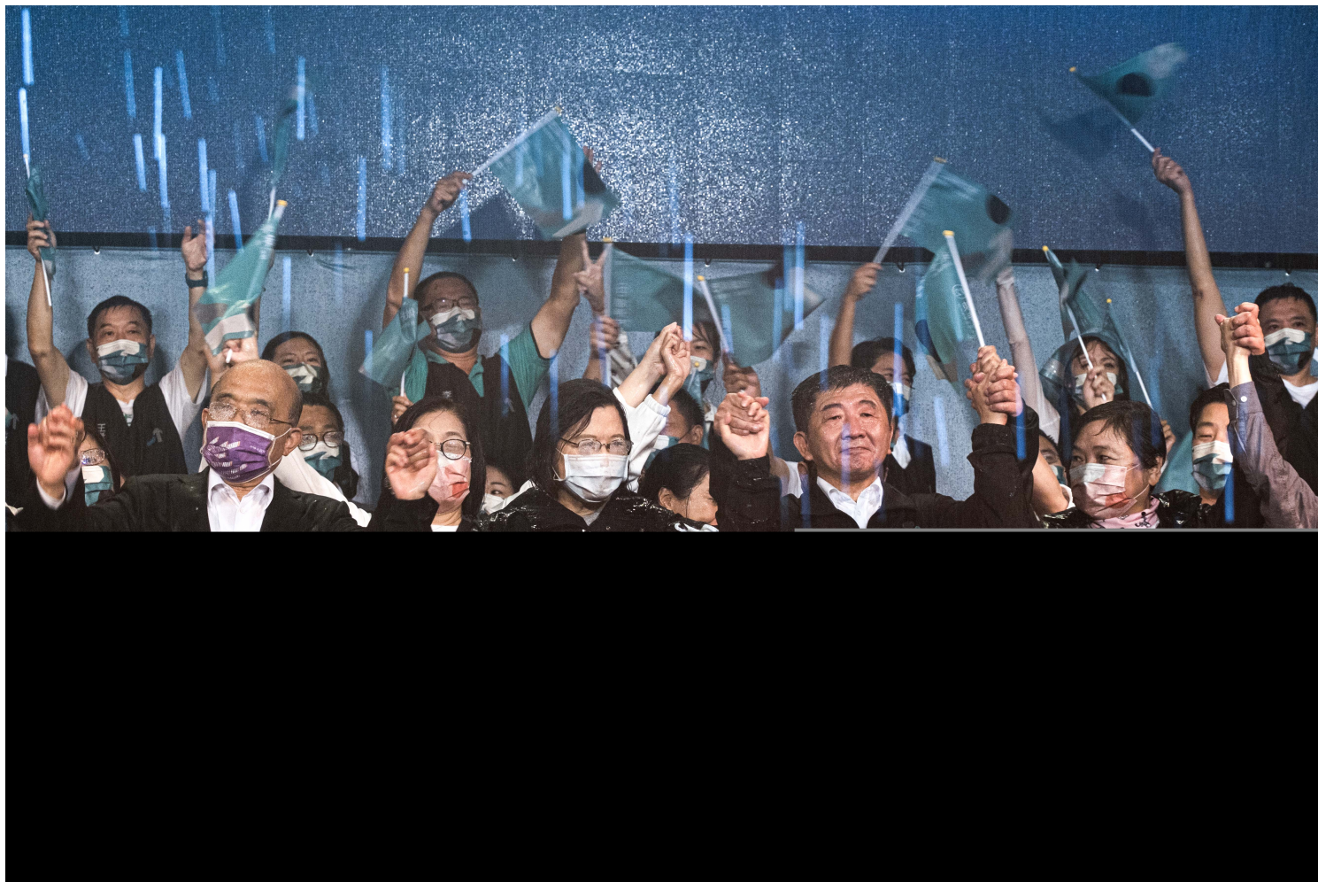
2022年11月25日，民进党台北市候选人陈时中的选前之夜，陈时中在大雨下演讲。