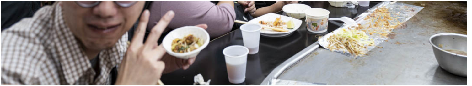
2022年11月22日，台北市市长候选人黄珊珊到景美夜市扫街拜票，走入一间食肆派发宣传品。