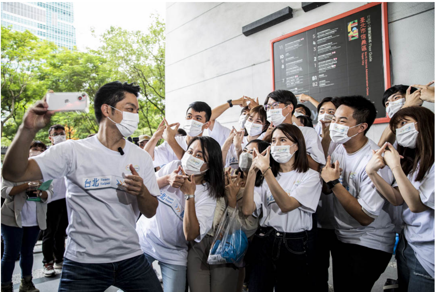
2022年9月1日，国民党台北市长候选人蒋万安登记参选市长，其后与自己的工作人员合照。