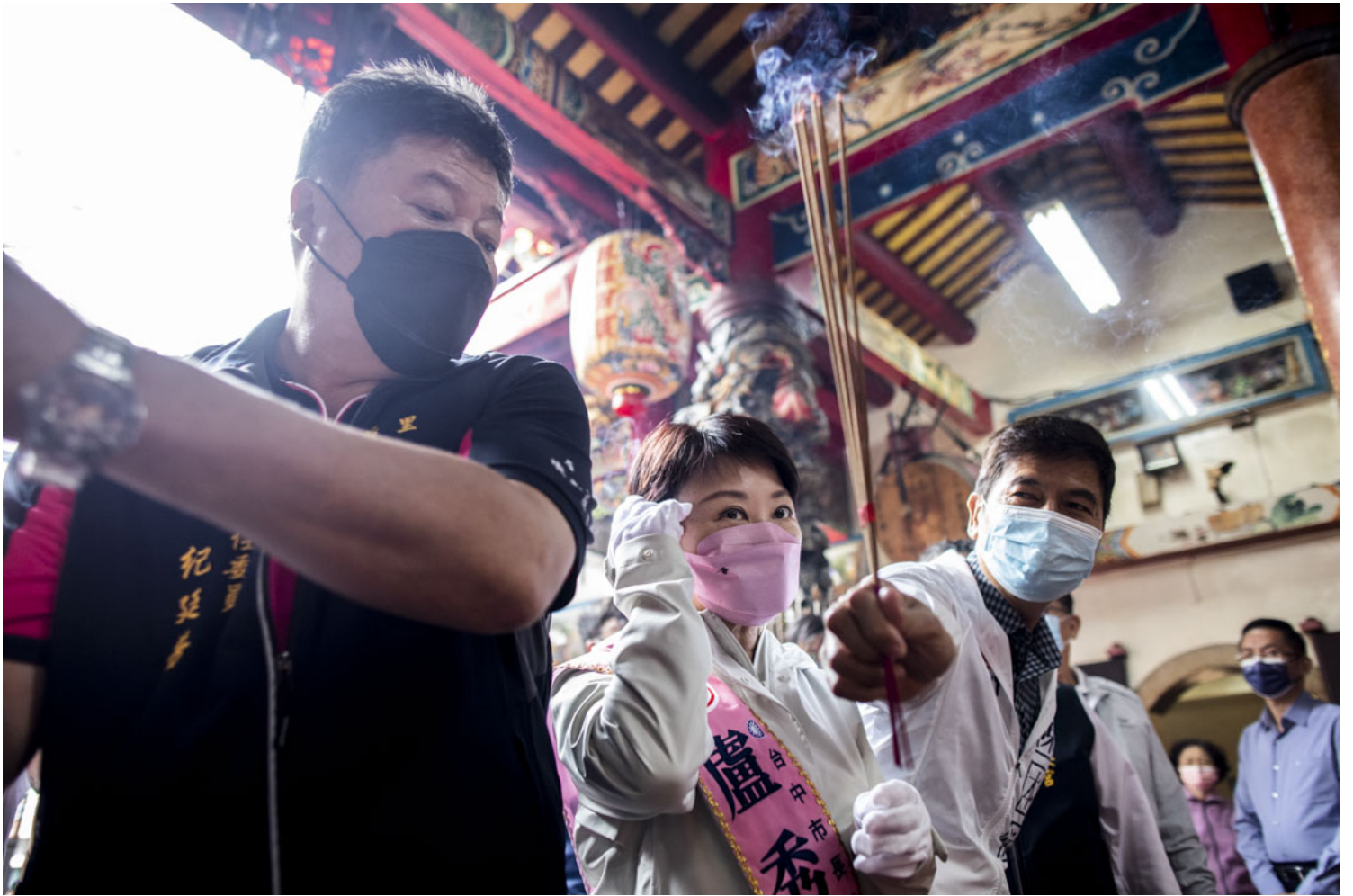
2022年11月24日，争取连任的国民党台中市长卢秀燕举行车队扫街活动，期间到一间庙宇参拜。