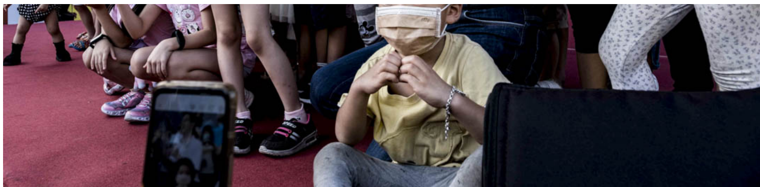
2022年10月2日，桃园，国民党桃园市候选人张善政的造势活动，小朋友站在台上与他合照。